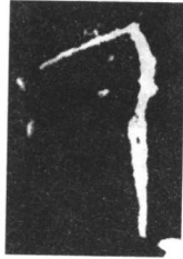
合 19309 反