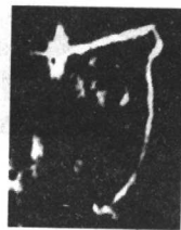
合 367 反