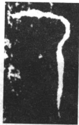
合 16949 反