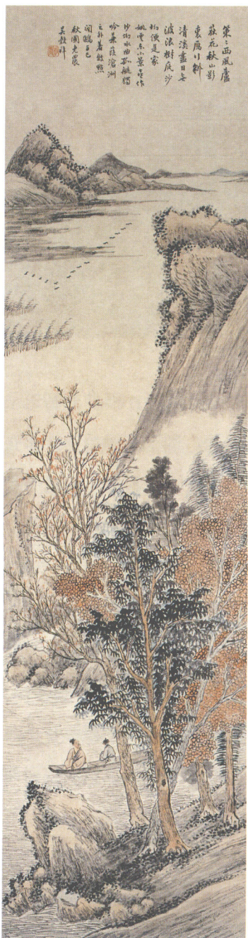
吴毅祥 秋林雁阵图轴