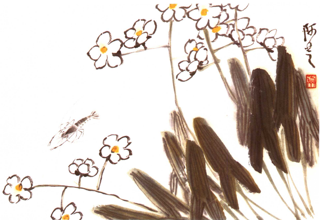
茨花游虾 尺寸不详 私人藏