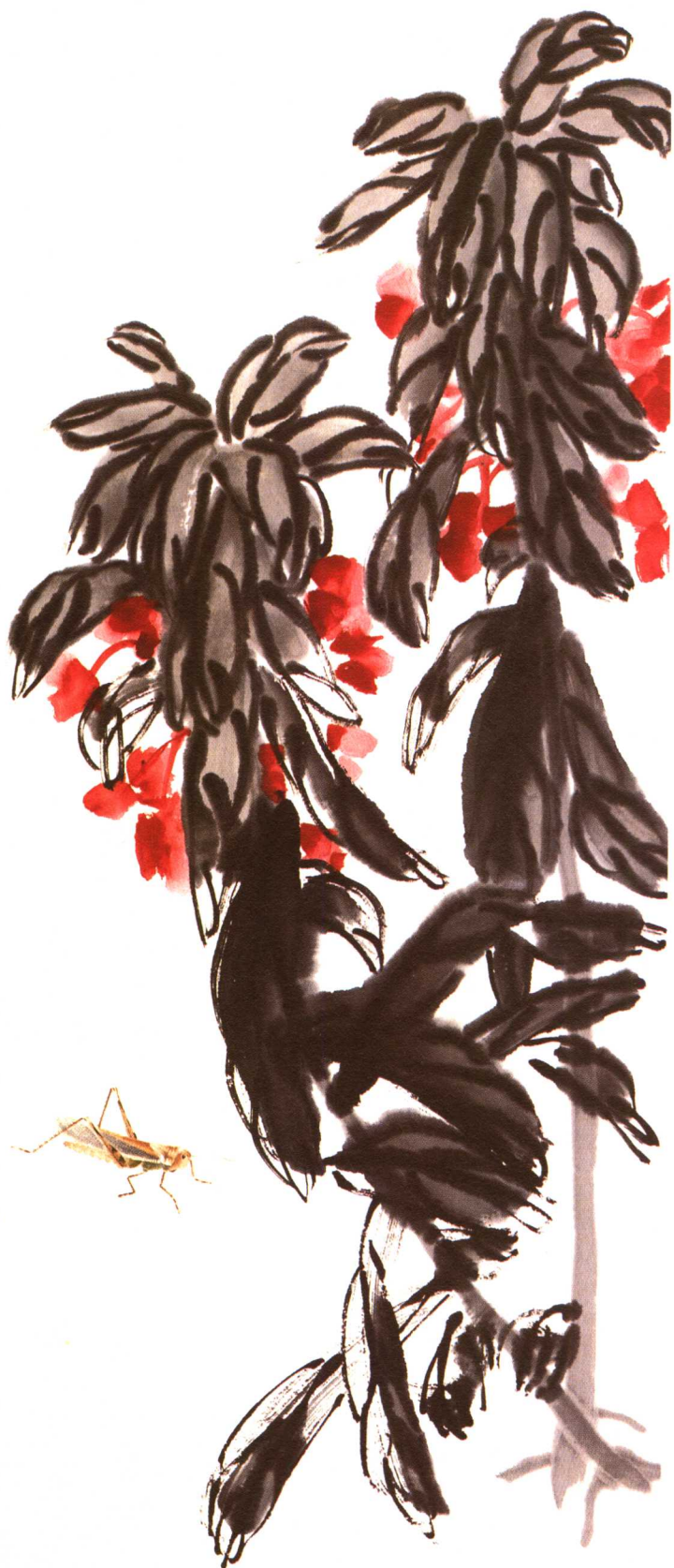
凤仙蚂蚱 尺寸不详 私人藏