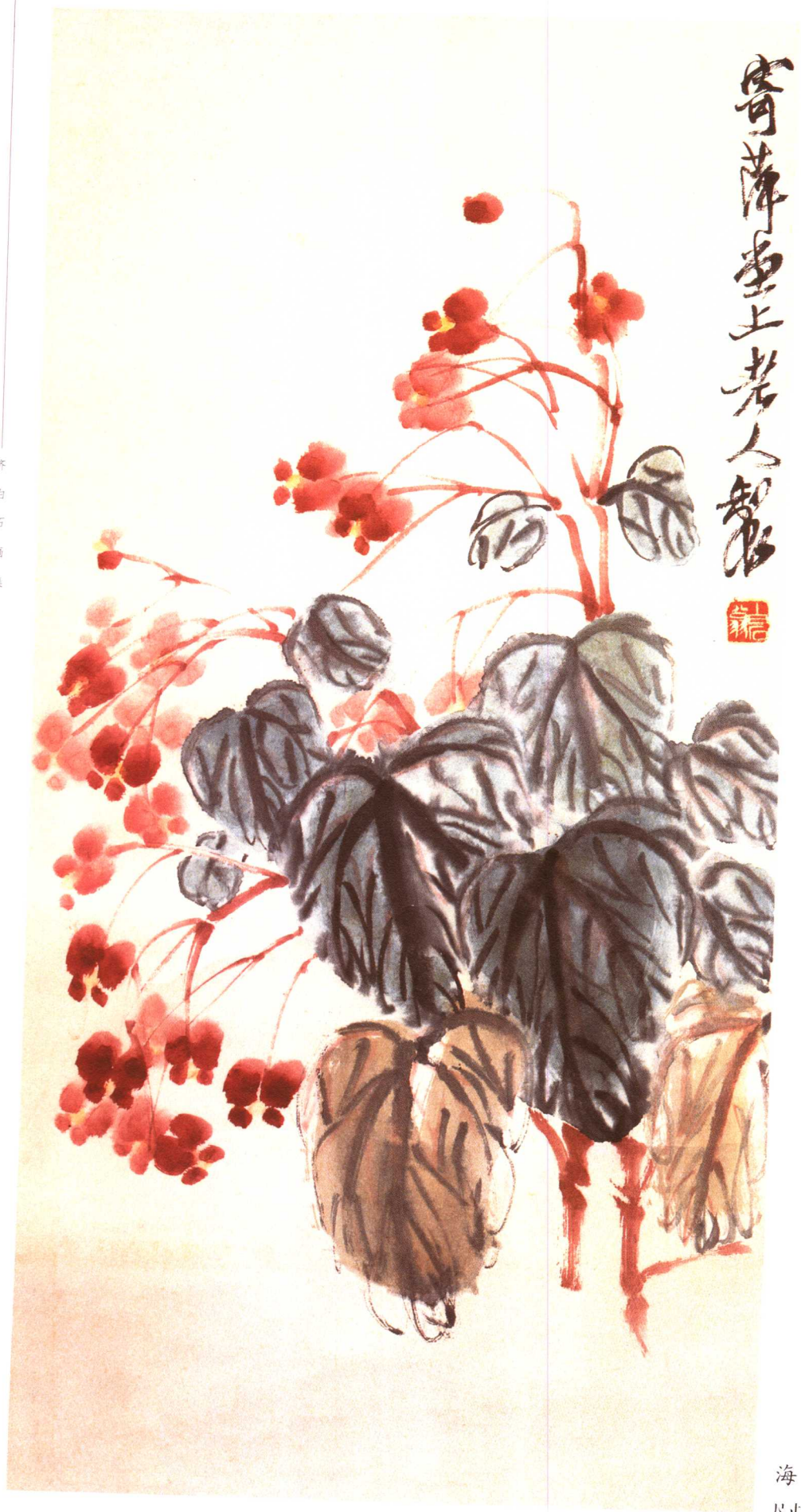
海棠 尺寸不详 私人藏