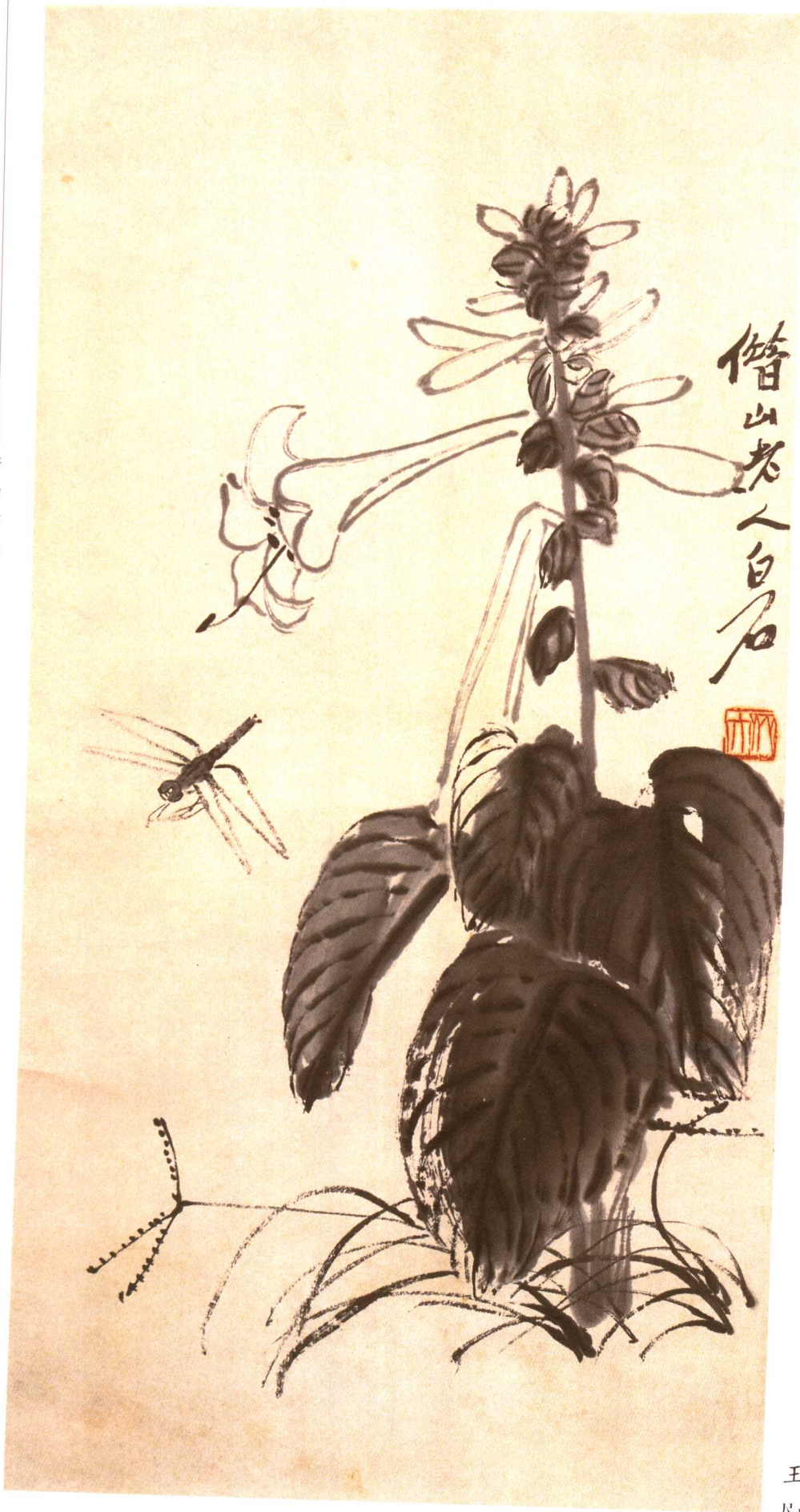
玉簪蜻蜓 尺寸不详 私人藏