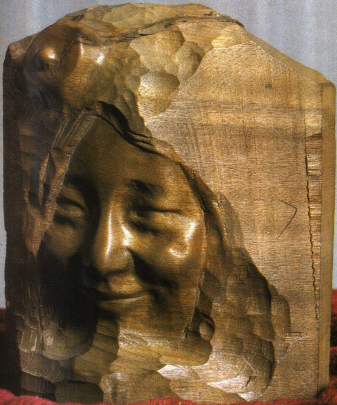
嘎玛 (木雕) 一九七七年