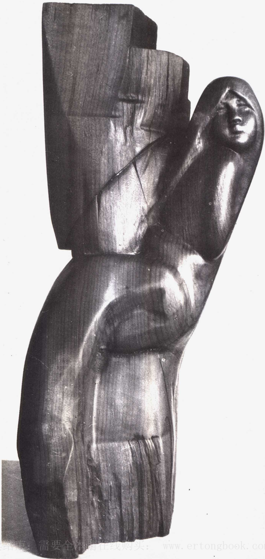
背 (楠木雕) 一九八一年