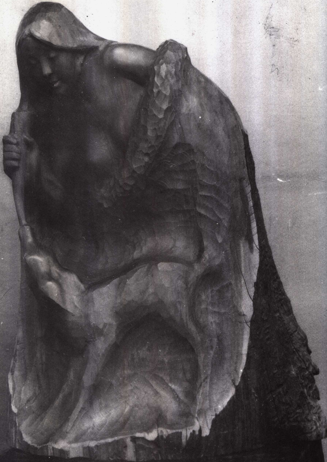
喂鹿 (木雕) 1982年