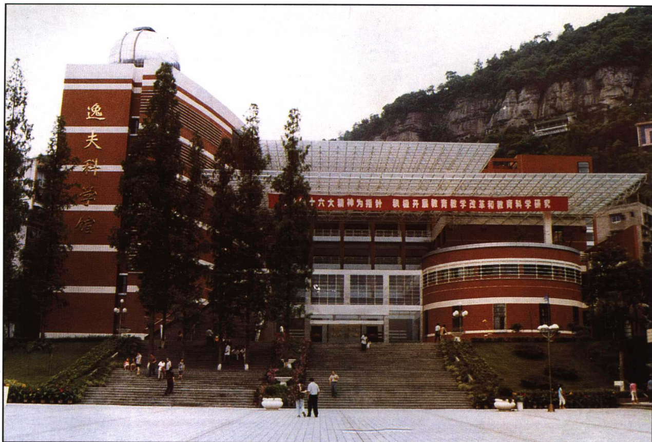
万二中逸夫科学馆