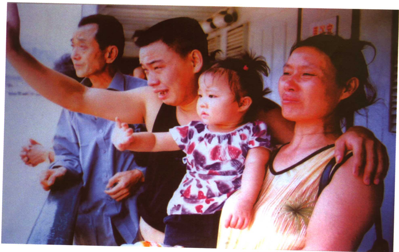
三峡移民舍小家顾大家