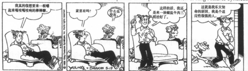
充分利用现有条件

Reprinted with Special Permission of King Features Syndicate