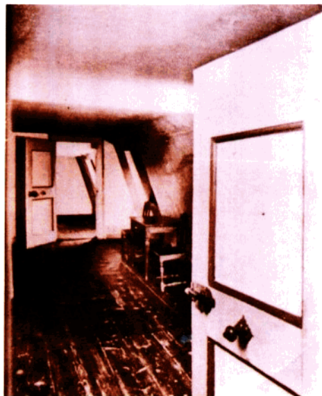
貝多芬博物館也是他的誕生地

苛刻的訓練，可怕的要求，厲聲的斥責，任性的敲打，日日夜夜折磨着稚嫩的心靈。祇有練完琴後的那點間隙，小貝多芬跑到在廚房裏忙碌的母親身邊，投入含淚凝視他的媽媽的懷抱，他的心纔能感到一絲寬慰和平靜。