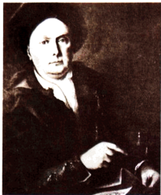
貝多芬的祖父魯多維克