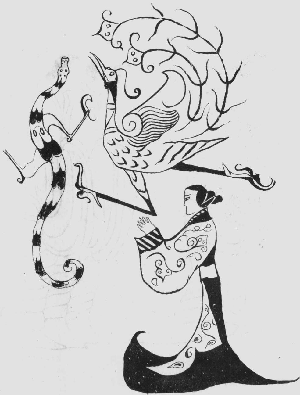
白描摹稿(战国·《龙凤人物帛画》) 图3