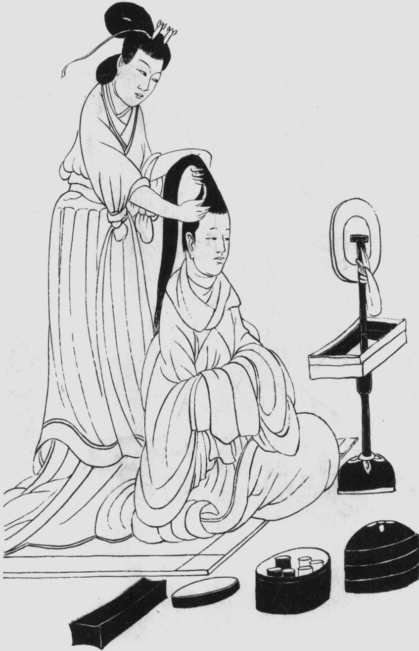
白描摹稿(传晋·顾凯之《女史箴图·修容》)