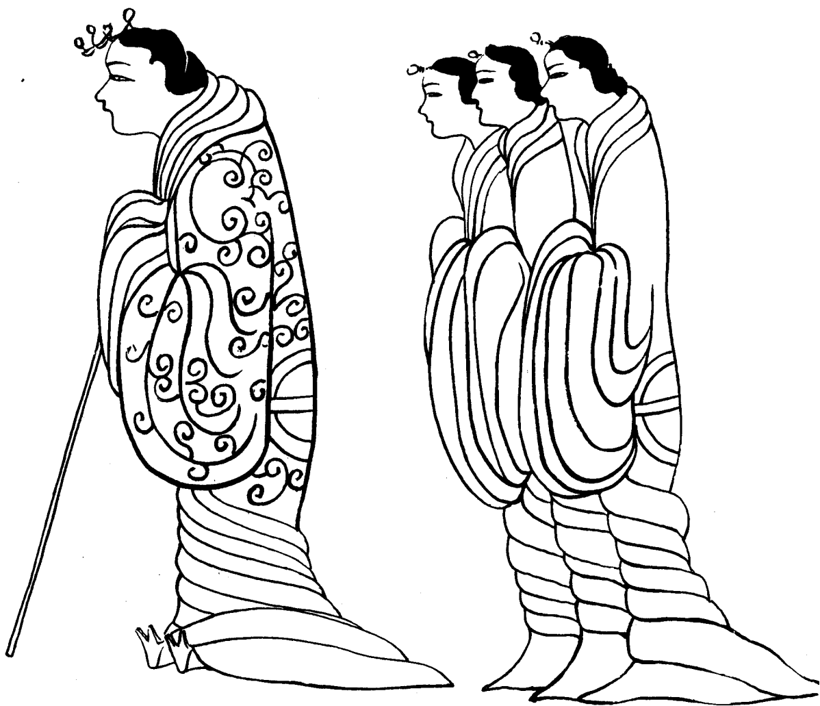
白描摹稿(汉墓帛画中人物) 图 4