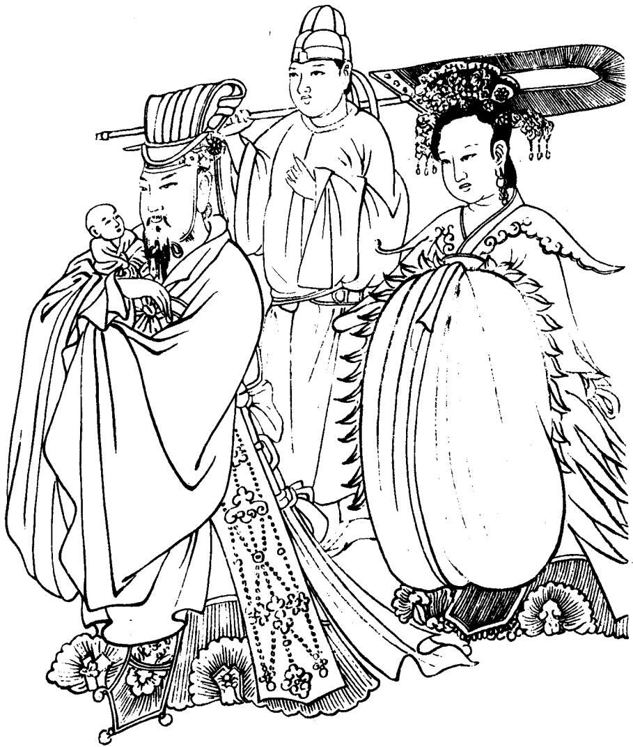
白描摹稿(传唐·吴道子《天王送子图》) 图6