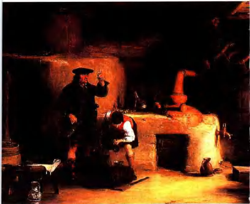
苏格三为他早期的威士忌酿造作坊。