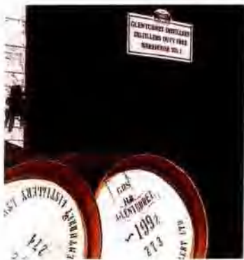
政府酒商工完酒原器包作