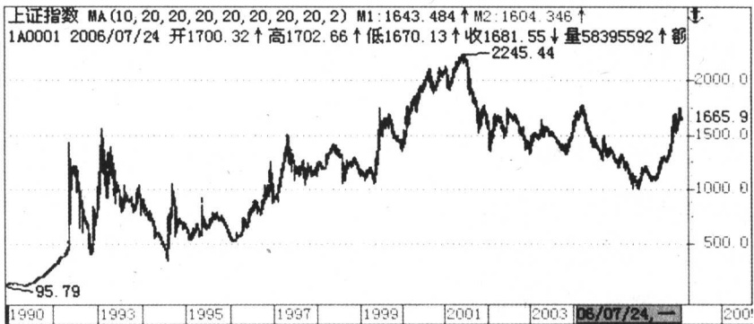
图 1-1 上证指数走势图

股票价格波动是一个极端复杂的问题，受经济、政治、社会因素和股票自身供求关系的影响而波动，而这些因素不断重演，此消彼长。例如经济复苏、政策利好，股票价格就一路上涨。涨完还会有下跌，但跌完又会再上涨。即使是短线，支配价格波动也离不开上述因素，投资者如果能够预测哪些因素支配着价格波动，就可以预知未来股价的波动范围及其走势。股票价格波动反映了投资者的投资心态。这种心态的构成是与投资者的社会阅历、文化程度、收入、年龄、对消息的了解程度以及投资信心和接受消化程度分不开的，全部都由股票价格波动反映出来。在股票价格走势图表上，就可以看到涨涨落落、此起彼伏的价格波动曲线，这个价格波动曲线就是我们通常说的趋势。见图 1-1 所示。