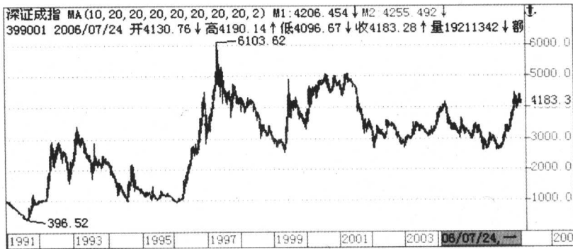
图 1-2 深证成指走势图

由于经济、政治、社会因素和股票自身供求关系等各类信息的不确定性和随机性，导致价格波动也具有不确定性和随机波动性。一个有效的股指或个股价格应该是随机波动的，这种波动反映市场信息对股指和股价不同程度的冲击。见图 1-2 所示。