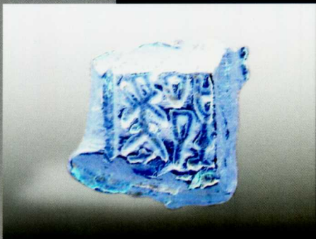
郢爰 浙江安吉出土

爰金的形状有版、饼两类,是先将黄金做成版或饼状,再用印戳打上文字。使用时需切割成小块,称量。成色为93%~99%。目前发现有郢爰、陈爰、鄢爰等不同铭文。前者是地名,后者“爰”是重量单位,表示黄金的重量。郢爰是楚