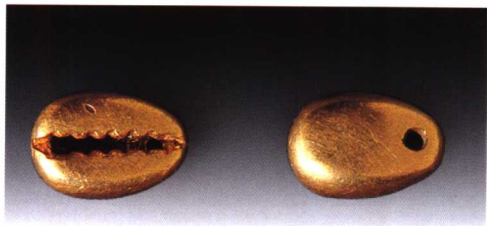
金贝 河北灵寿战国墓出土

海贝在商周时期已成为货币，中国金属货币的最初形式就是模仿海贝制成的青铜贝，在春秋战国时期的墓葬中也陆续发现包金贝、鍍金贝等。1984年河北省灵寿县