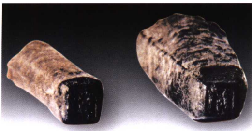
郢爰戳记 录《中国钱币》

国建都于郢时所铸的，是目前发现最多的一种。河南、浙江、山东、陕西、湖北、安徽、江苏等都有出土。其中最大的两块是江苏盱眙出土的，一块长12.2厘米，宽