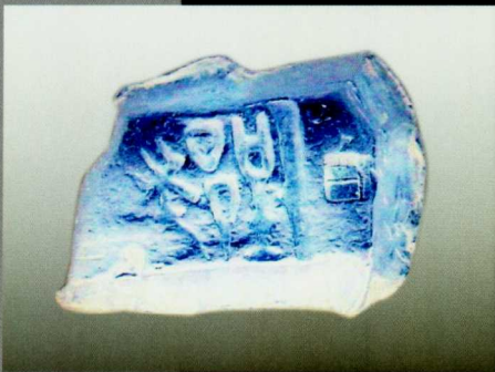
郢爰 安徽寿县出土