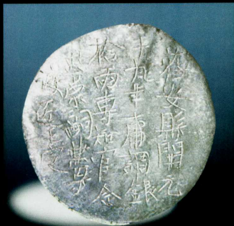
庸调十两银饼 录《中国历史银锭》