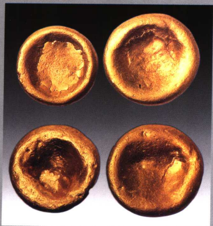
金饼 山西太原东太宝汉墓出土 录《山西历史货币》