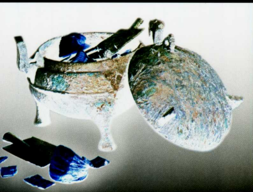
江苏盱眙南窑庄出土金银窖藏 录《中国钱币》

在汉之后的几百年中,金银称量货币以饼和铤的形式为主。不过,目前还没有发现魏晋南北朝时期的金银饼铤等称量货币。