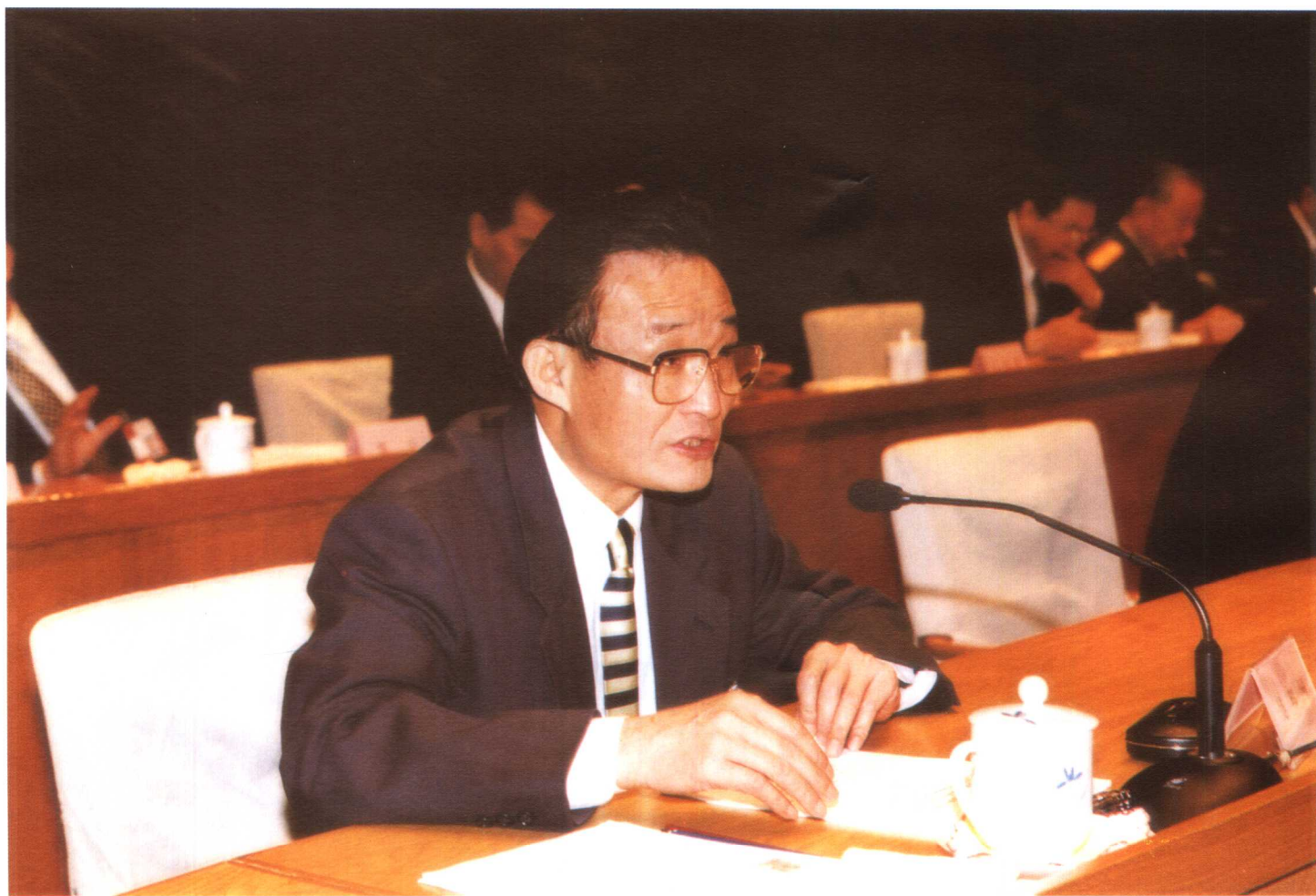
图为5月14日吴邦国副总理在国有企业下岗职工基本生活保障和再就业工作会议上作工作报告。