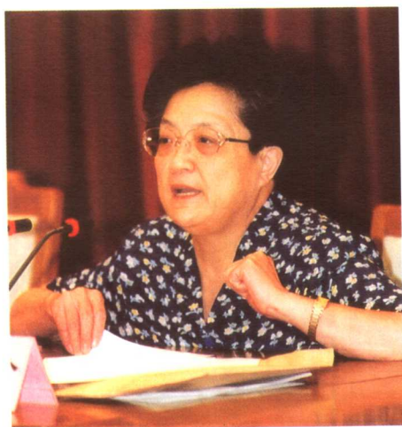
劳动和社会保障部副部长王建伦