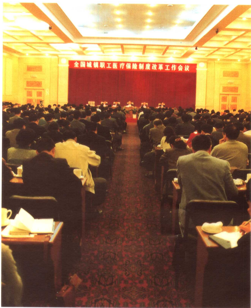
1998年11月26日至27日，国务院在京召开全国城镇职工医疗保险制度改革工作会议。中共中央政治局常委、国务院副总理李岚清作重要讲话，中共中央政治局委员，国务院副总理吴邦国作工作报告。图为大会场景。