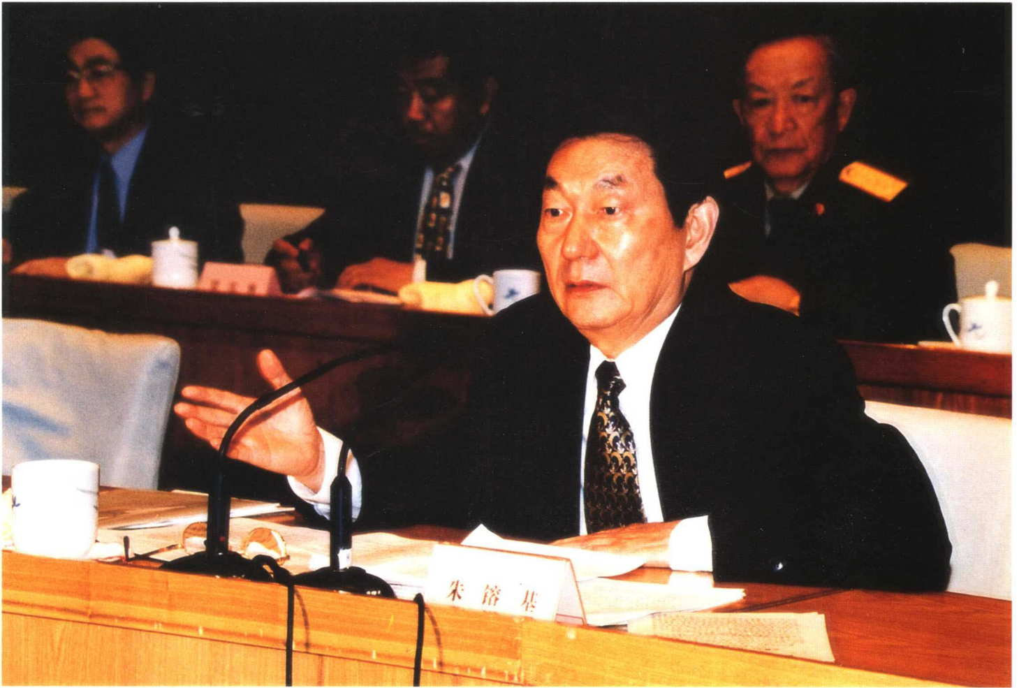
图为5月16日中共中央政治局常委、国务院总理朱镕基在国有企业下岗职工基本生活保障和再就业工作会议闭幕时作重要讲话。