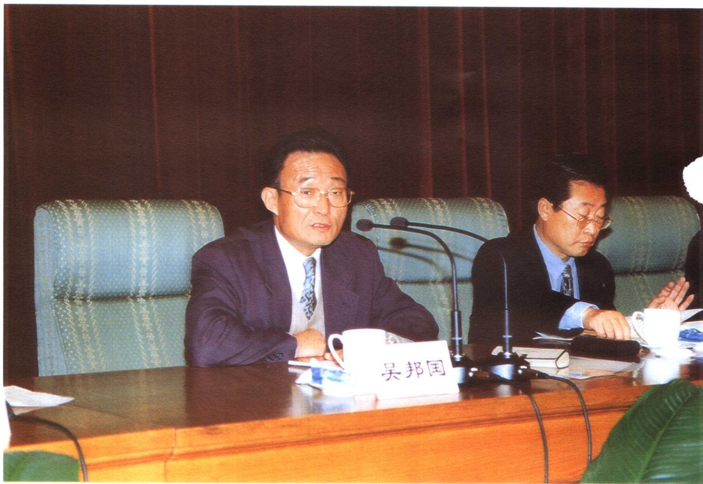
图为 11 月 26 日，中共中央政治局委员、国务院副总理吴邦国在全国城镇职工医疗保险制度改革工作会议上作工作报告。