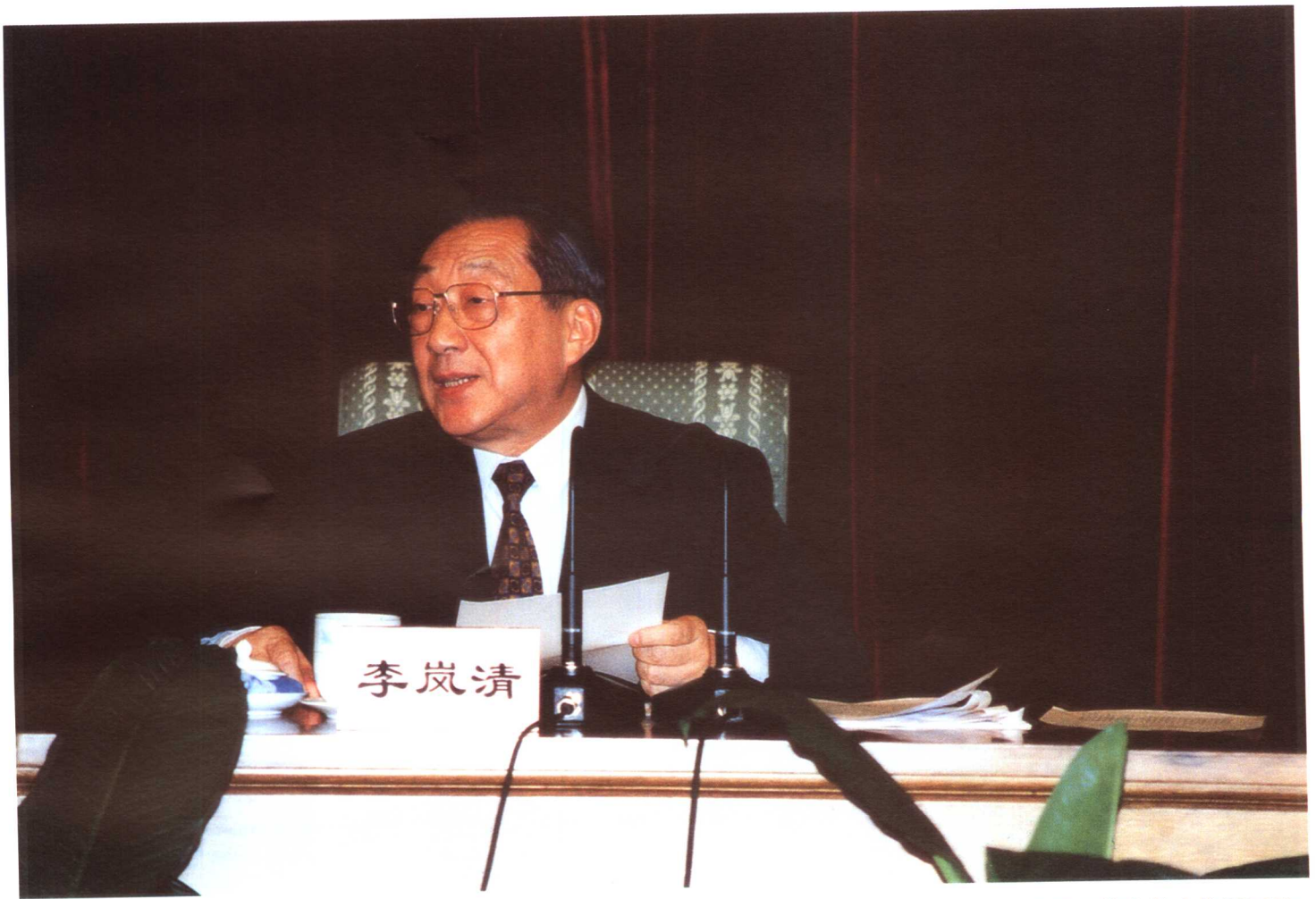
图为11月27日，中共中央政治局常委、国务院副总理李岚清在全国城镇职工医疗保险制度改革工作会议上作重要讲话。