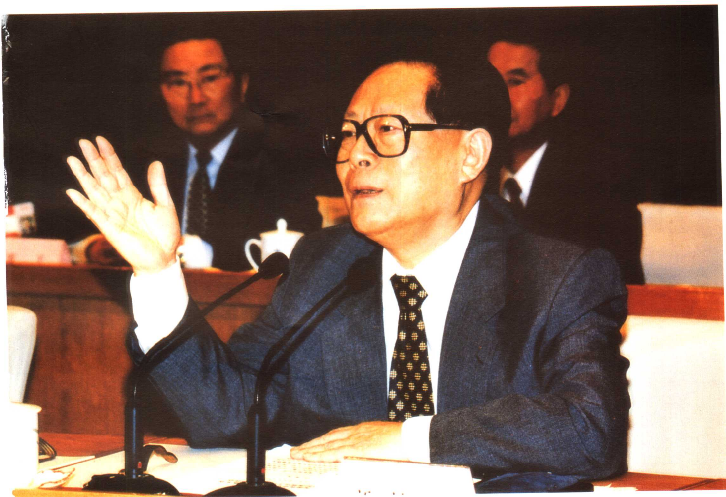
1998年5月14日至16日，中共中央、国务院在京召开国有企业下岗职工基本生活保障和再就业工作会议。中共中央总书记、国家主席江泽民出席开幕式并作重要讲话，号召全党动手，动员全社会的力量，共同做好国有企业下岗职工基本生活保障和再就业工作。