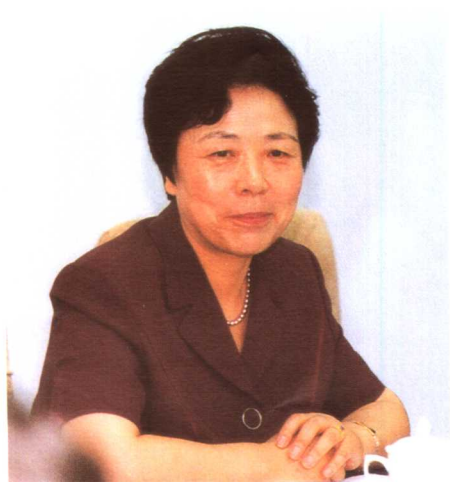
劳动和社会保障部副部长刘雅芝