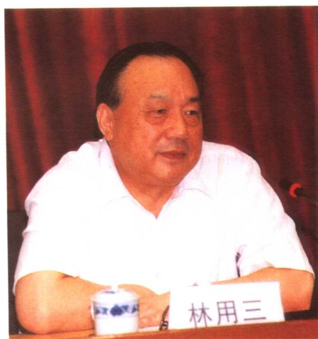
劳动和社会保障部副部长林用三