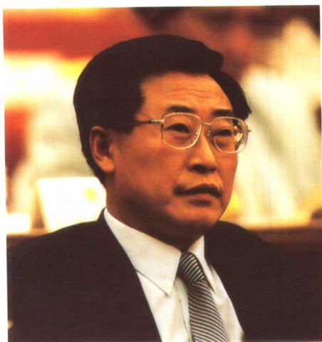
劳动和社会保障部部长张左己