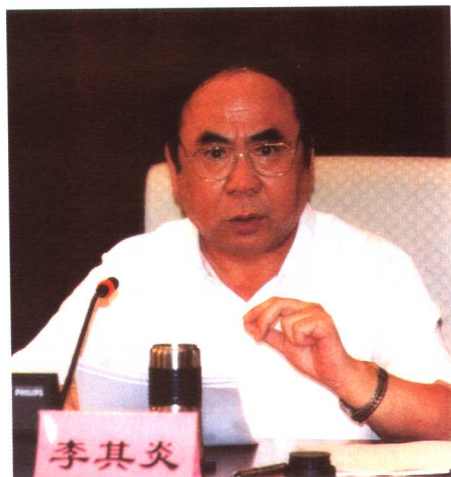
劳动和社会保障部副部长李其炎