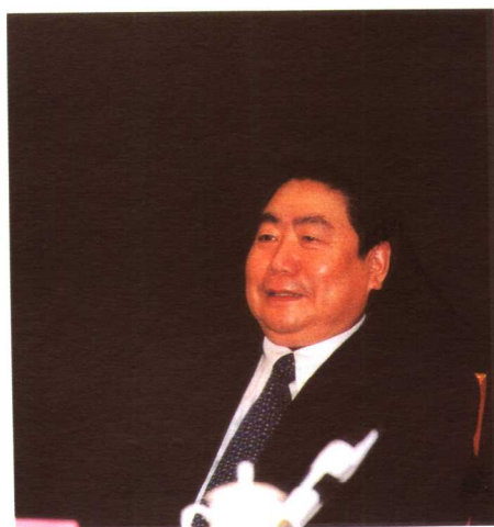
劳动和社会保障部副部长王东进