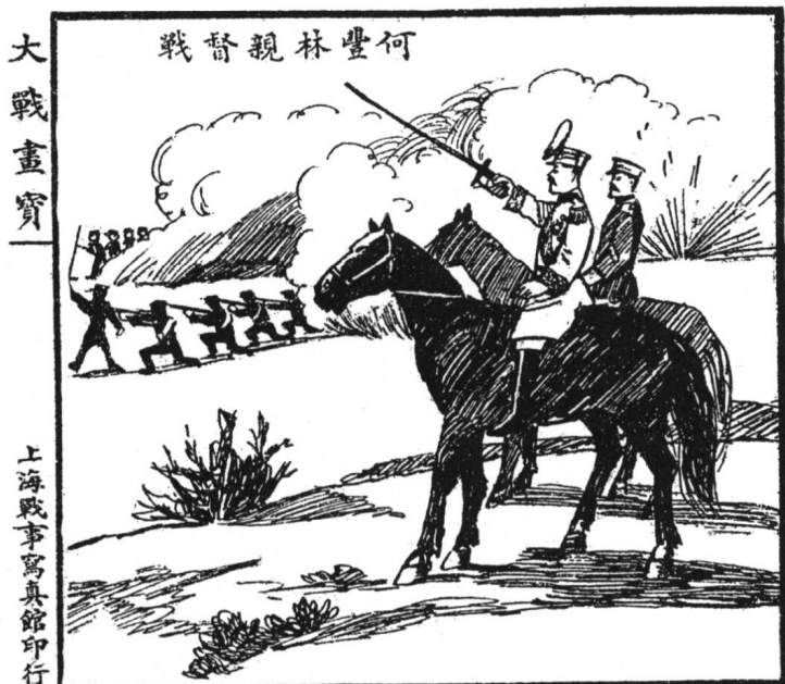
《江浙直奉血战画宝大全》

解放区连环画作品的鲜明特点是，它具有现实性，它来自生活，与现实生活密切结合；它具有群众性，它从群众中来，到群众中去，与群众情感相通，血肉相联。在我国，连环画虽然起源很早，现代连环画在它的发祥地、大本营上海及其它地方尽管发展很快，但真正反映人民群众的生活和命运，特别是他们如何以历史主人翁的姿态去创造历史、改变历史的连环画的这种主导方向，只有在中国共产党直接领导下的解放区才能实现。这是连环画发展中极其宝贵的革命传统。