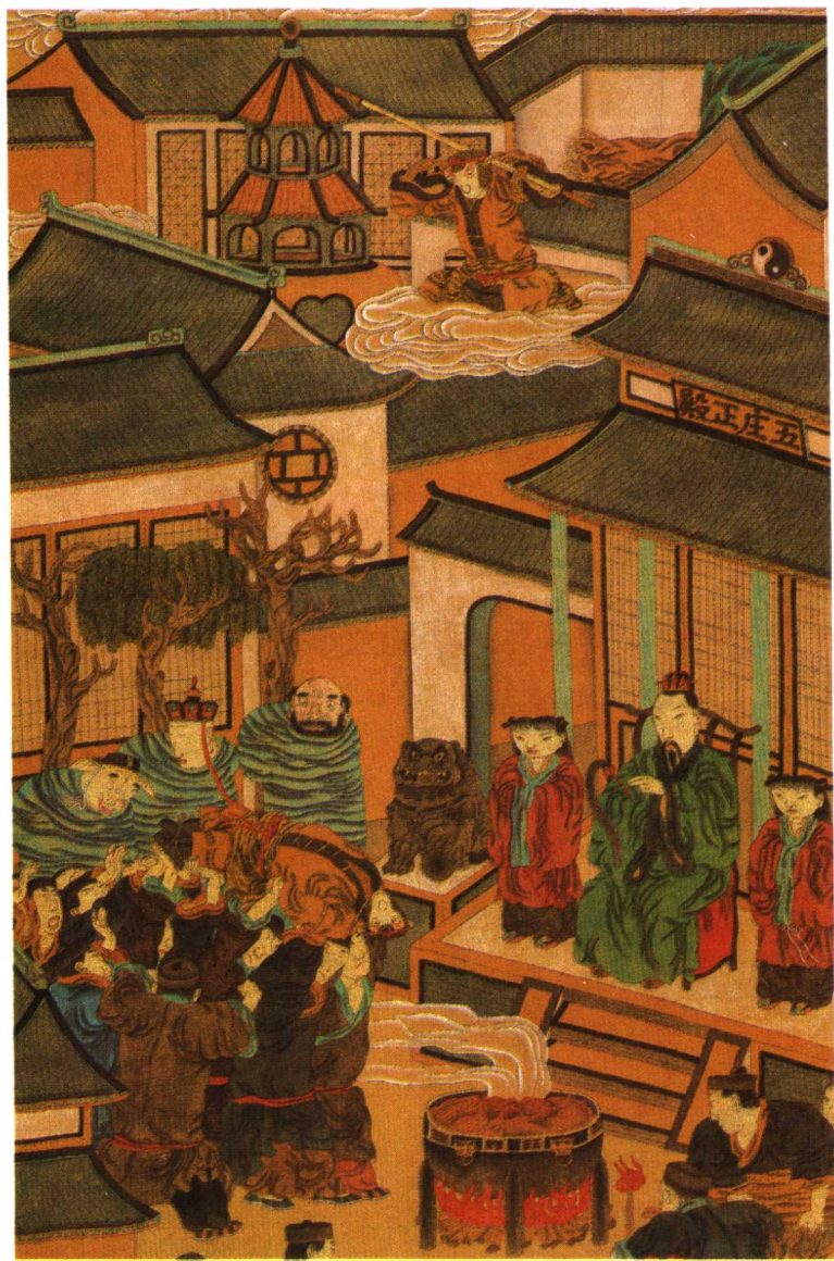
孙行者大闹五庄观