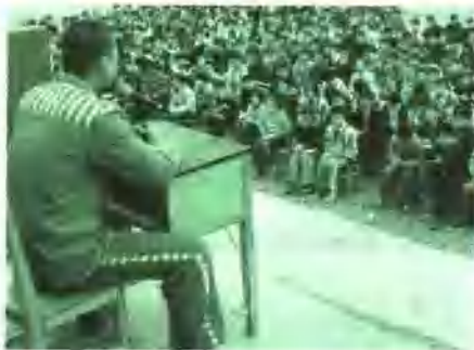
走访少管所，听少年犯现身讲感受