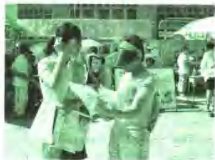
法律咨询走进校园和社区