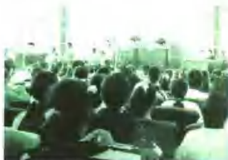
参观法院少年庭庭审