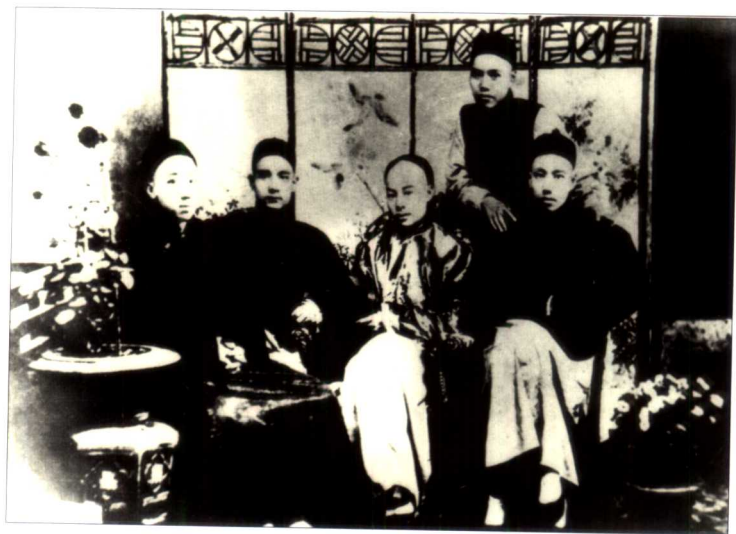
“四大寇”，右起杨鹤龄、陈少白、孙中山、尤烈