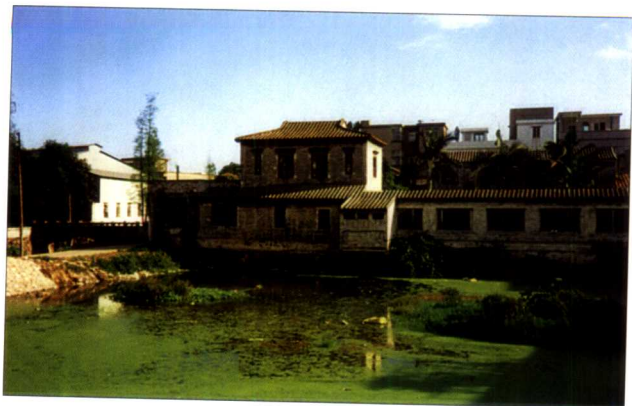
陈少白先生之故居——白园外景