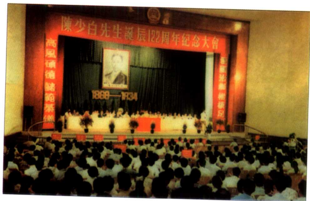
1991年8月，陈少白先生诞辰122周年纪念大会