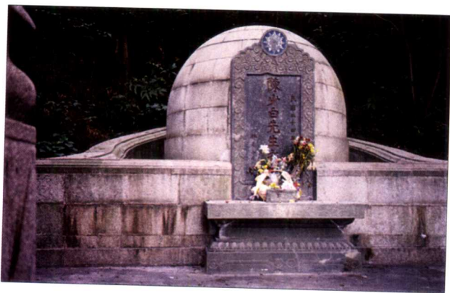
陈少白先生墓（在外海镇茶庵寺之后山）