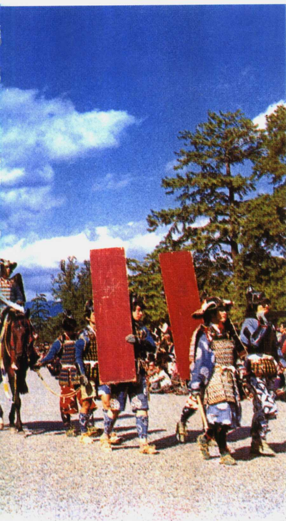
京都三大节之一——时代祭的游行