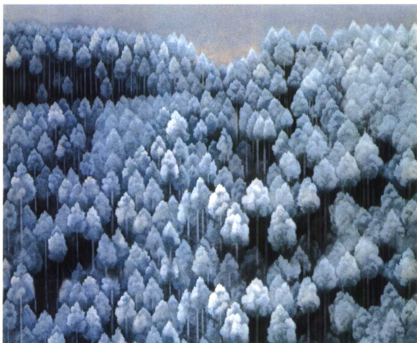
东山魁夷绘画《北山初雪》