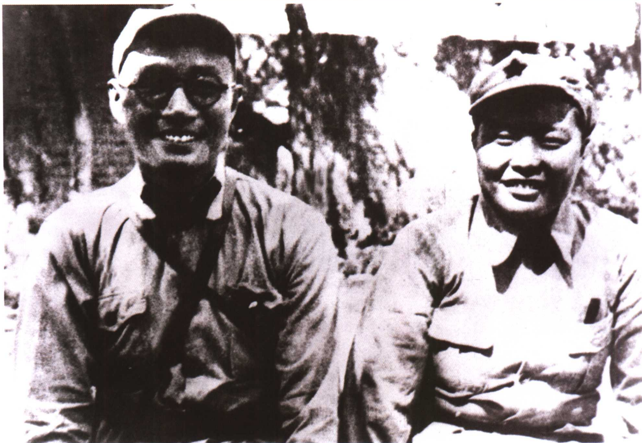
1936年11月，刘伯承与汪荣华在陕北结婚。图为他们当时的合影。

民解放战争由战略防御转为战略进攻的转折点，扭转了整个战局。此后，他和邓小平又指挥大军逐鹿中原，取得了包括淮海战役在内的一系列战役的胜利，歼灭了国民党军精锐。1949年，他麾下的第二野战军参与渡江战役和向西南地区的大进军，所向披靡，直到1951年和平解放西藏。他的指挥艺术，可说达到炉火纯青的程度；他的智谋韬略和他的军事理论素养，体现在他所做的许多战役总结和他主持编写的许多军事教材、军事条令中。