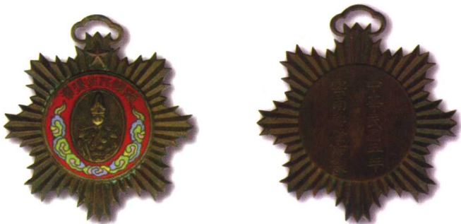
7. 拥护共和奖章(中华民国五年 云南都督府制) 质地:铜镀金、珐琅 径:60mm 参考价:1200元