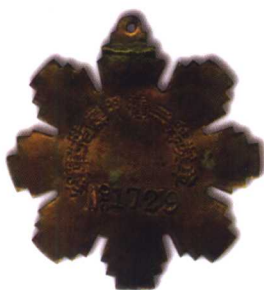
10、空军楷模甲种二等奖章 质地：铜镀金、珐琅 径：46mm 参考价：2000元