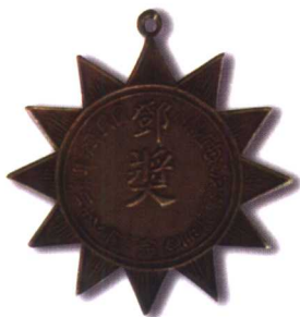
13、国民革命军第二十八军军长兼四川松理懋汶屯殖督办邓奖 质地：银 径：51mm 参考价：2000元