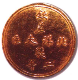
5. 钦差北洋大臣二等奖