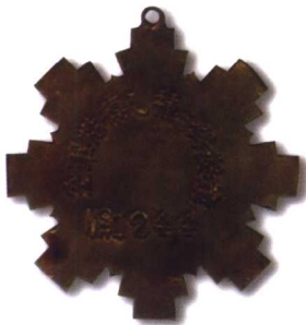
11、空军楷模乙种一等奖章 质地：铜镀金、珐琅 径：46mm 参考价：2000元