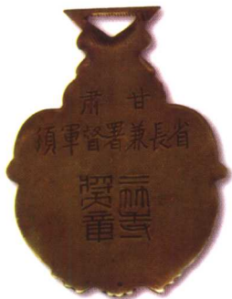
8. 甘肃省长兼督军颁二等奖章 质地:银 尺寸:58X44mm 参考价:1200元