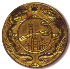
1、宣統二年褒獎（南洋勸業會農工商部頒給） 质地：銅鍍金 直径：60mm 参考价：15000元