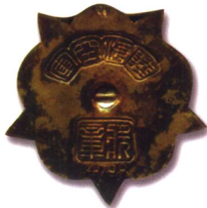
19、海陆空军奖章 质地：铜镀金 径：47mm 参考价：1500元