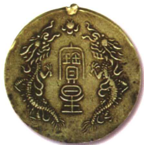
4、簡州運動會寶星獎章 （光緒三十二年十一月十九日） 质地：銀 直径：30mm 参考价：3000元