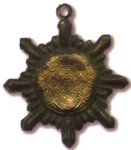
6. 贵州省长乙等奖章 质地：银 径：66mm 参考价：1500元