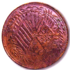
18、川陕边防督办刘存厚给 质地：铜 直径：38mm 参考价：400元