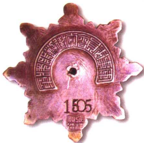
20、军事委员会党徽剿匪奖章 质地：银 径：50mm 参考价：700元