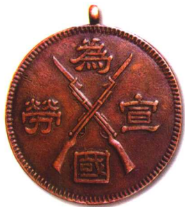
9. 为国宣劳(奉天省长奖) 质地:铜 直径:32.5mm 参考价:500元