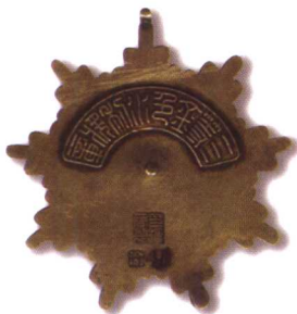
5. 三等金色水利奖章 质地：银 径：62mm 参考价：1500元