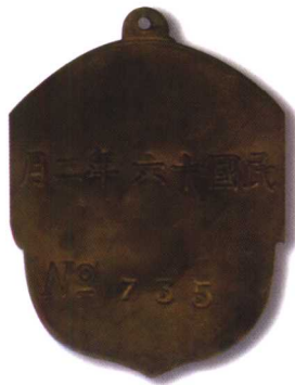
12、国民革命军第四军北伐胜利负伤奖牌 质地：铜镀金、珐琅 尺寸：30X36mm 参考价：3000元