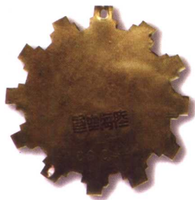
4. 海陆空军奖章 质地：银 径：47mm 参考价：2000元