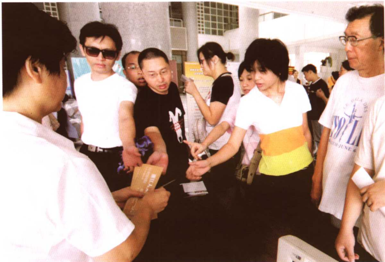
1.在浙江图书馆领票点,每次都有热情的读者等候领票。