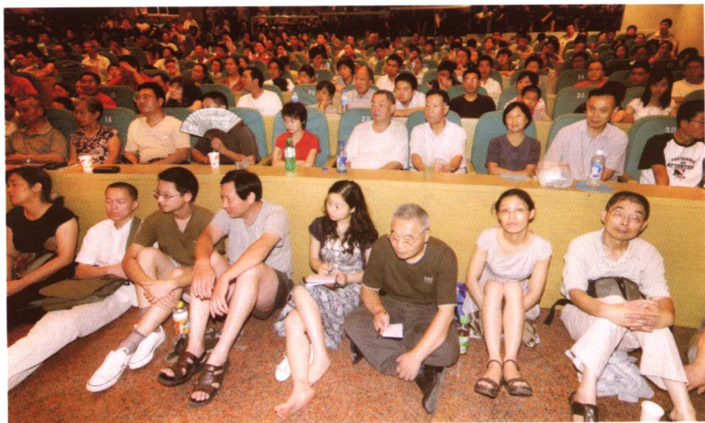
2.“浙江人文大讲堂”讲课现场。