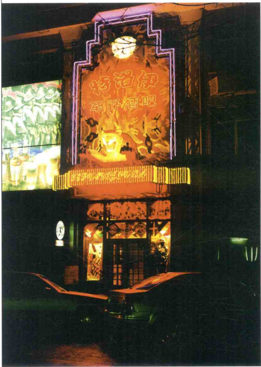
■ 特洛伊军野酒吧外立面