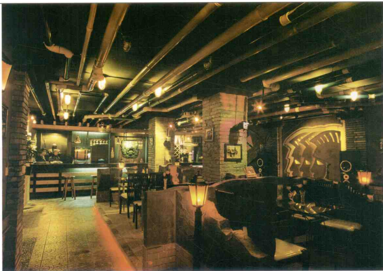
■ 特洛伊军野酒吧二楼酒吧大厅