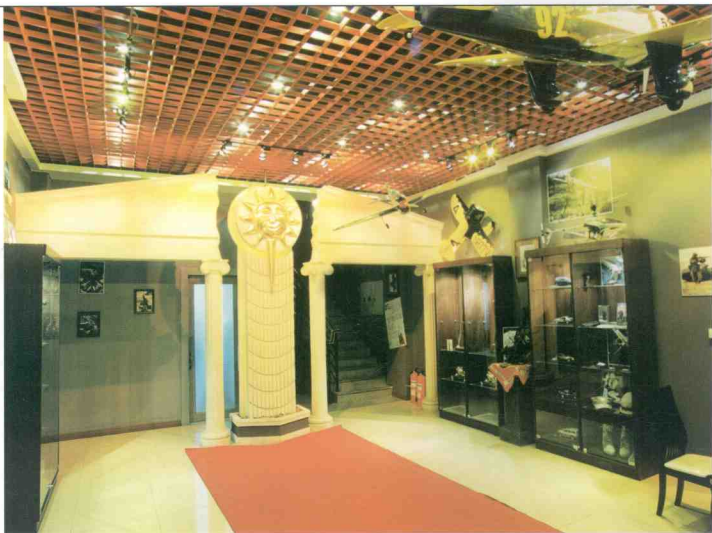
■ 特洛伊军野酒吧一层大厅