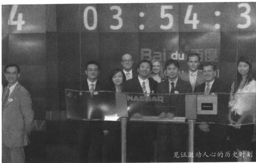
见证激动人心的历史时刻

练。4点，李彦宏在分别与投资人、银行家、上市团队合影留念以后，启动了2005年8月5日纳斯达克的闭市仪式，这一刻百度的收盘价锁定在122.54美元，百度市值为39.58亿美元。股价涨幅达到了令人疯狂的353.85%。