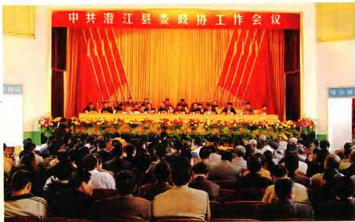
中共澄江县委、县政协工作会议