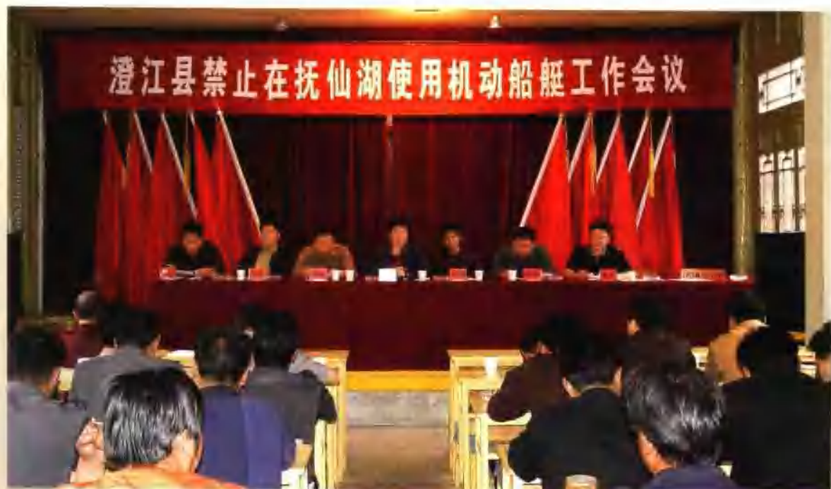
澄江县禁止在抚仙湖使用机动船艇工作会议