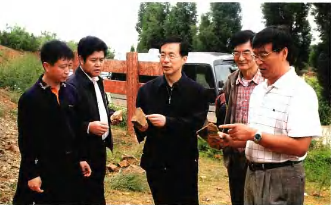
省长徐荣凯(中)在市、县领导的陪同下到帽天山调研