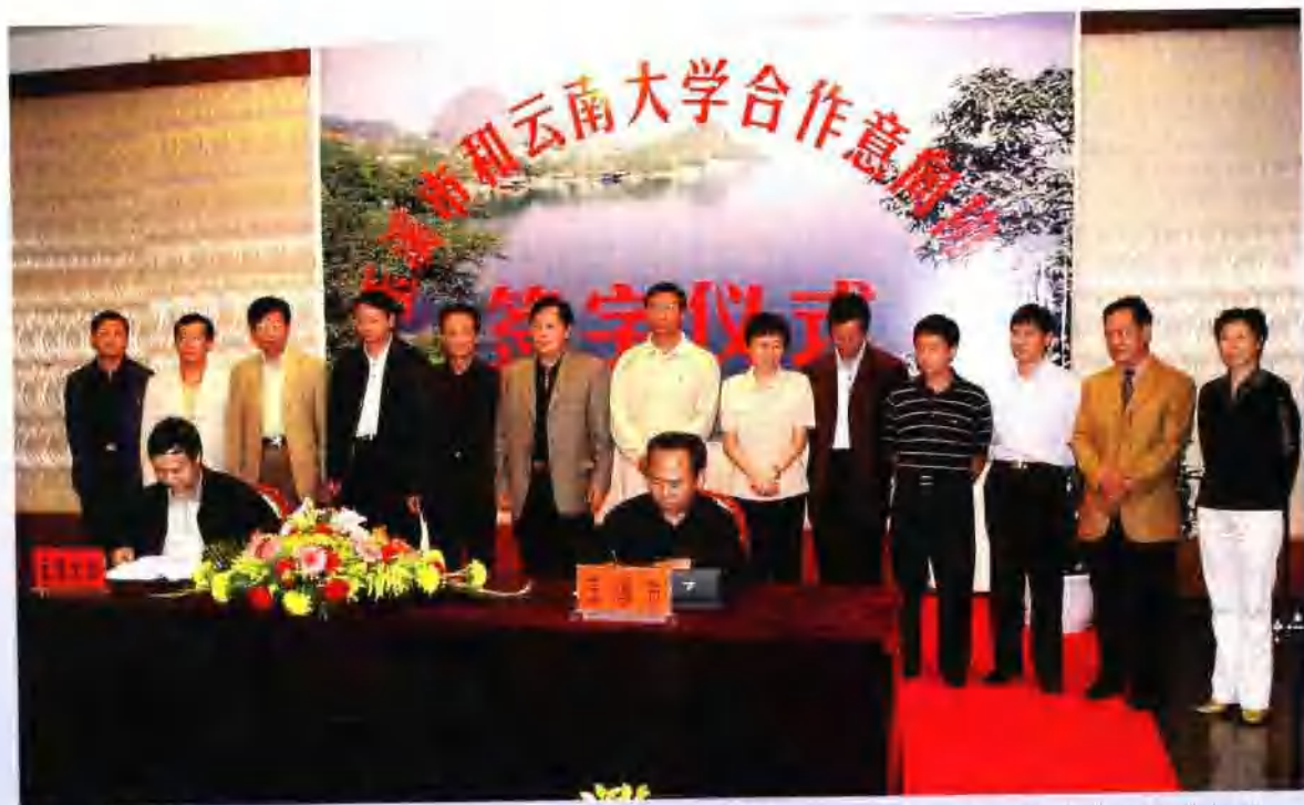
玉溪市人民政府市长董诗强和云南大学签署共同建设云南古生物研究重点实验室合作协议