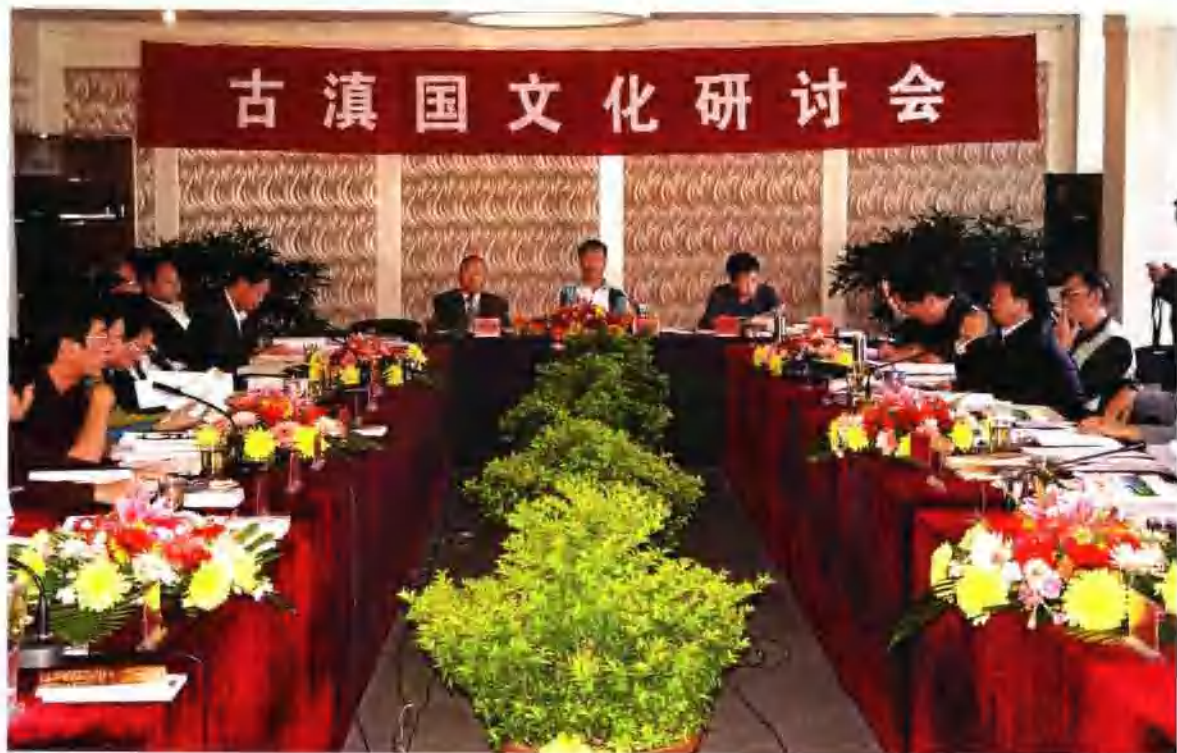
古滇国文化研讨会在澄江召开