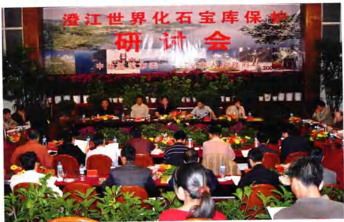
澄江世界化石宝库保护研讨会