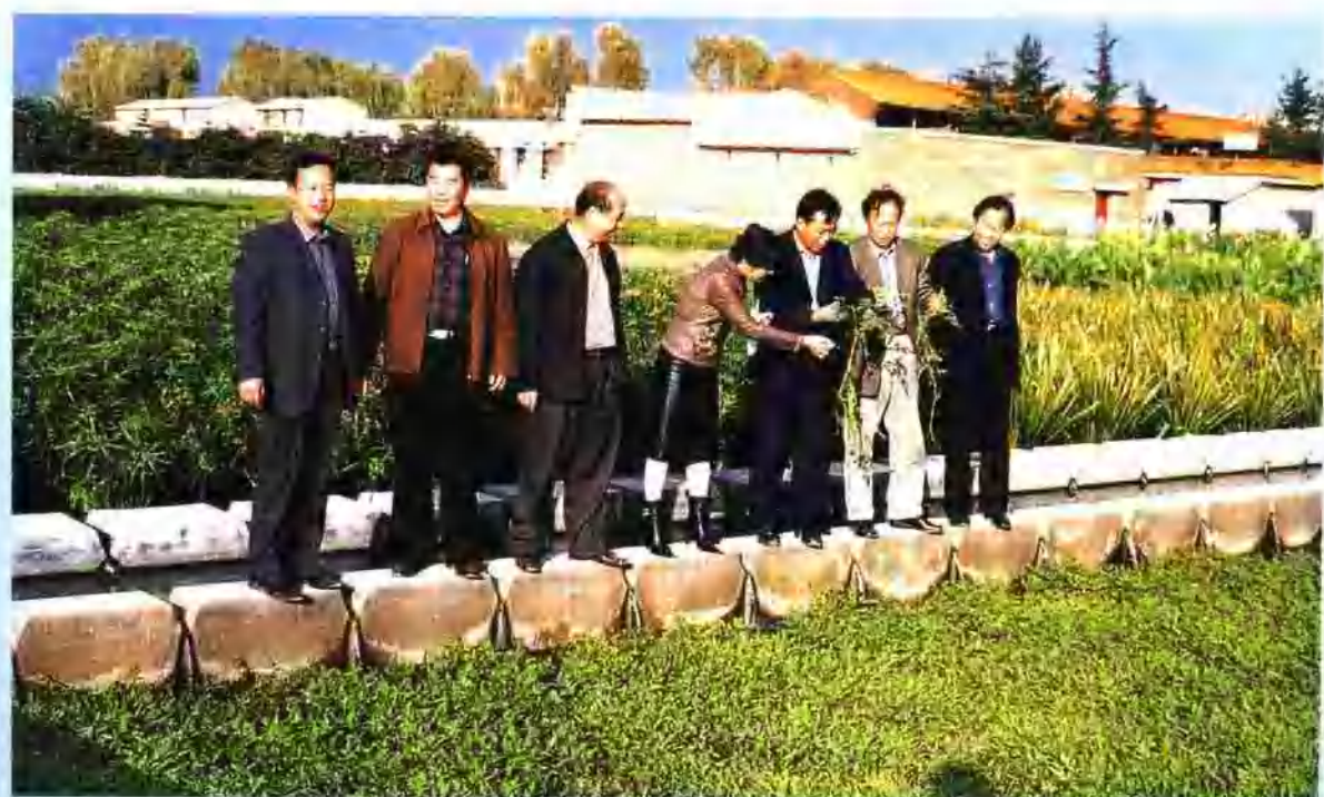
县政协领导视察人工湿地