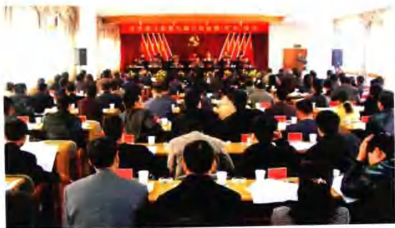
中共澄江县委九届三次全委(扩大)会议