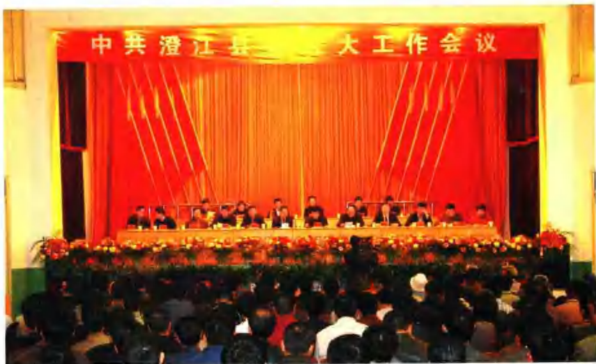
中共澄江县委、县人大工作会议