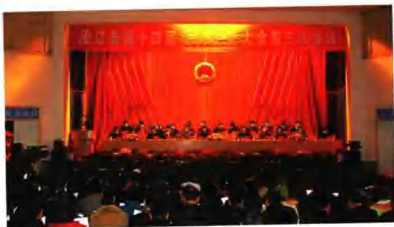
澄江县第十四届人民代表大会第三次会议