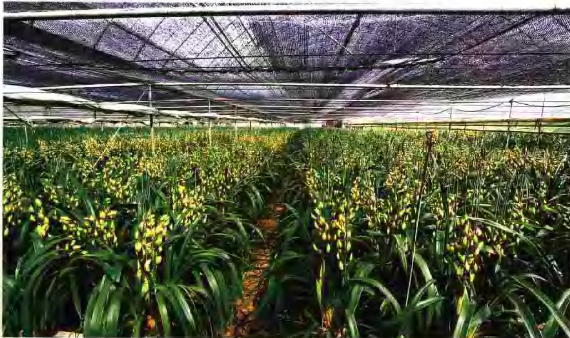
素心兰规模化种植