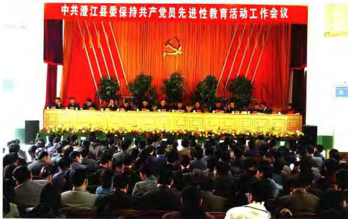
中共澄江县委保持共产党员先进性教育活动工作会议