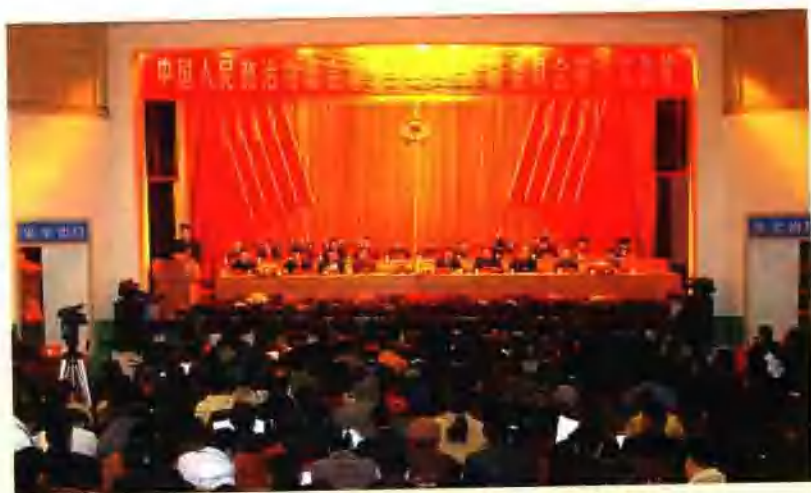
政协澄江县第六届委员会第三次会议