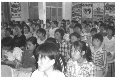
参加法律知识培训的打工妹们。