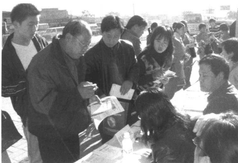
2005年10月28日，中心在北京市海淀区打工者聚集地肖家河社区举办了“让法律帮助你”——妇女权益大型法律咨询活动。