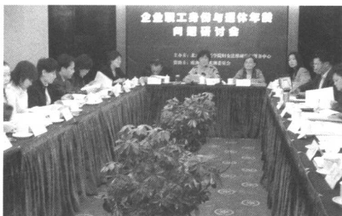
2006年1月21日，中心召开了企业职工身份与退休年龄问题研讨会。