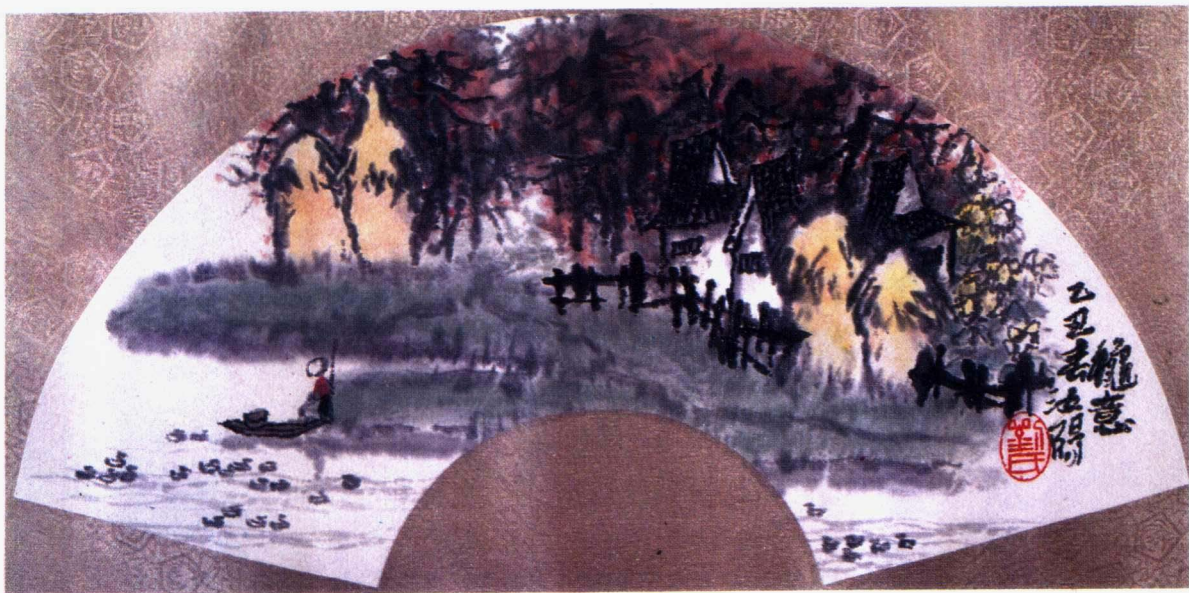
牧 归 1985年