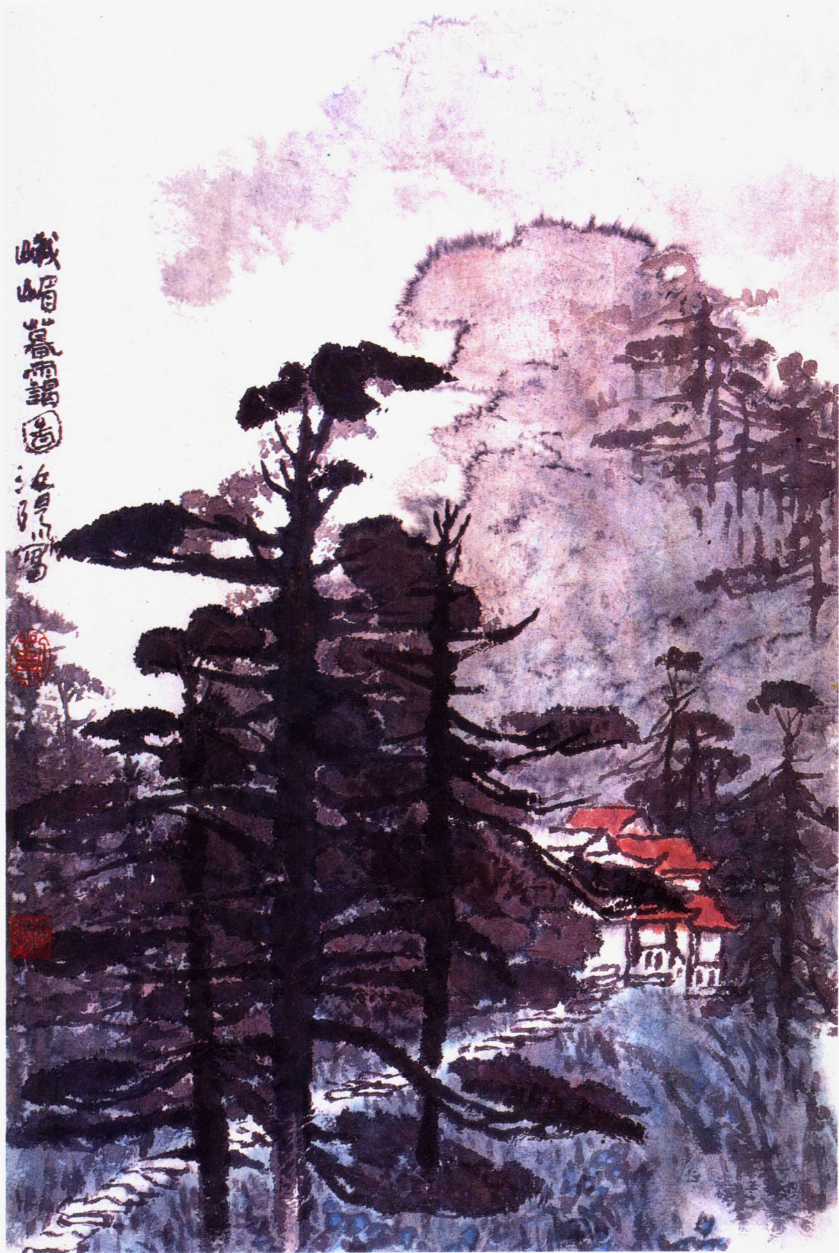
峨嵋暮雨 一九八九年