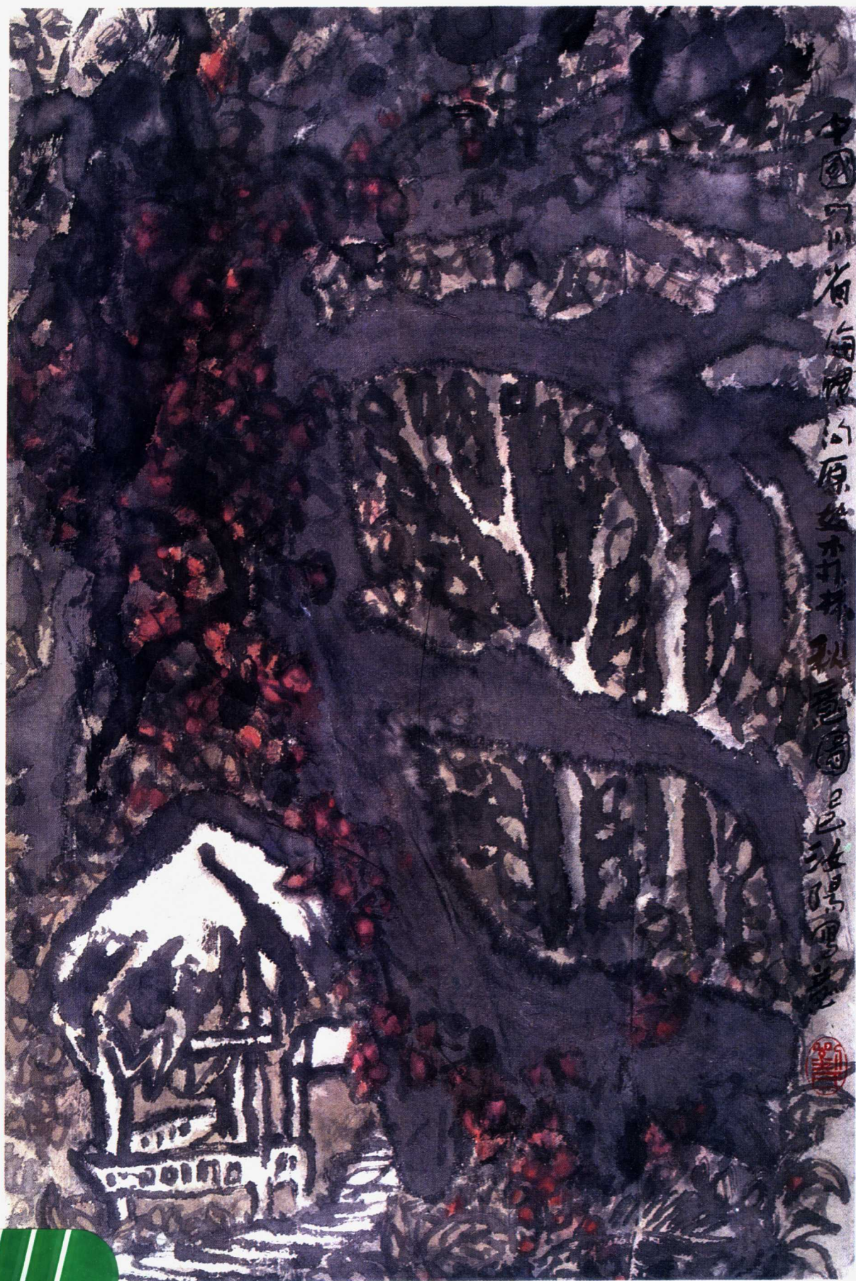
霜染海螺沟 一九八九年