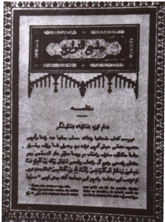
《元朝秘史》的蒙古文版本

塔塔兒部。其時，塔塔兒人是游牧於蒙古草原東邊呼倫貝爾湖一帶最強大的部落，塔塔兒人凶猛强悍，能騎善射，英勇無比，也速該曾先後與他們交戰過 13 次，13 次都以失敗而歸。這一次也速該出征却大獲全勝，殺得塔塔兒人潰不成軍、落荒而逃，而且生擒了兩個塔塔兒部的酋長，其中一個