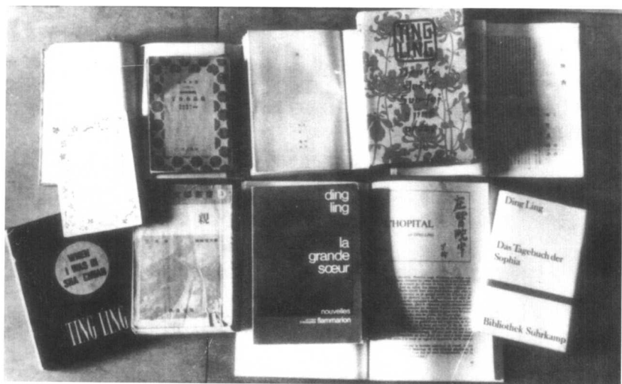
国外出版的部分丁玲著作。