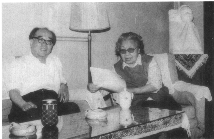
1985年6月4日，丁玲与魏巍在北京。