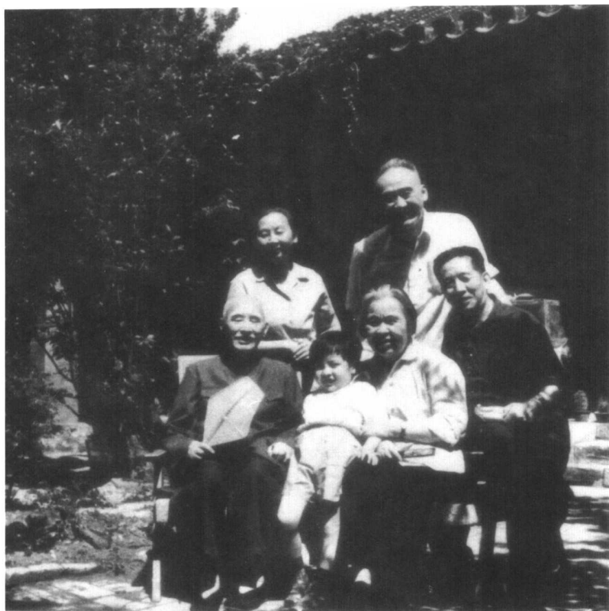
丁玲与叶圣陶。 前右：陈明。后排：叶至善夫妇。