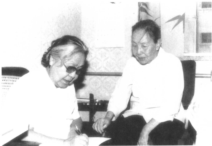
1984年8月，丁玲与冰心在一起。