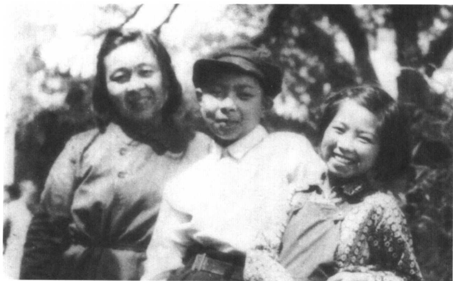
1946年7月，丁玲与儿子蒋祖林、女儿蒋祖慧摄于张家口水母宫。