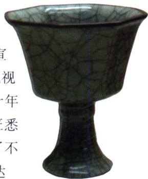
图1 明 成化仿哥窑高足杯

清朝盛世的康熙、雍正、乾隆百余年间（1662—1795年）是仿古瓷生产的极盛时代。这时国力强盛，督陶官学识渊博，勤心供职，工匠身份相对自由，有较高的生产积极性，仿宋、仿明多能得心应手。康熙晚期，在仿明宣德鲜红釉的基础上烧成的“郎窑红”，在当时即有“比视成宣欲乱真”之说。雍正六年（1728年）到乾隆二十年（1755年）的二十多年间，督陶官唐英在御器厂与工匠悉心钻研，在“仿古、创新”两个方面下功夫，创造了不少成就。从雍正到乾隆初年，景德镇的仿古瓷生产达到了历史的最高工艺水平，对宋代的汝、官、哥、钧、定、龙泉等名窑无所不仿（图2），雍正官窑的仿官、仿钧更是成功，其中仿钧窑变釉已能比较有人为地控制成色。对于明代的永宣青花、成化斗彩、五彩等也都有一定量的仿烧。清朝盛世官窑的仿古瓷有一个区别于明代的显著特点，即有不少器物是以内务府发出的真品为蓝本，不仅仿釉仿彩，也仿造型，有些仿品已可达到乱真的程度，有时还以新仿器为古器配盖、配对等，有关这方面的内容在清宫造办处档案中有不少