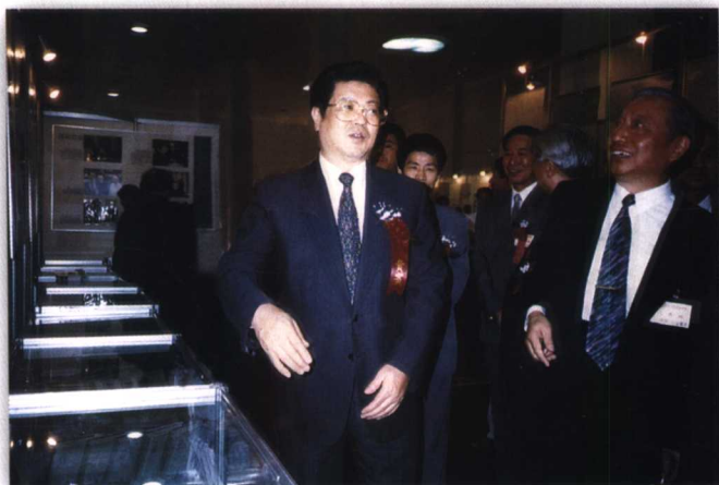
1996年9月，全国政协副主席、中共中央统战部部长王兆国在北京参观全国文史研究馆成果展福建展区