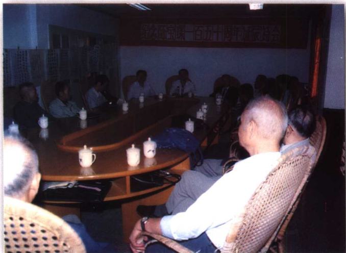
1997年10月，省文史館主辦紀念 陳寶琛誕生150周年詩會