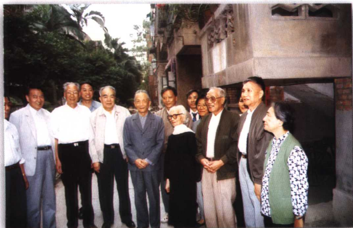
1991年秋，省领导胡宏（左六）看望省文史馆馆员