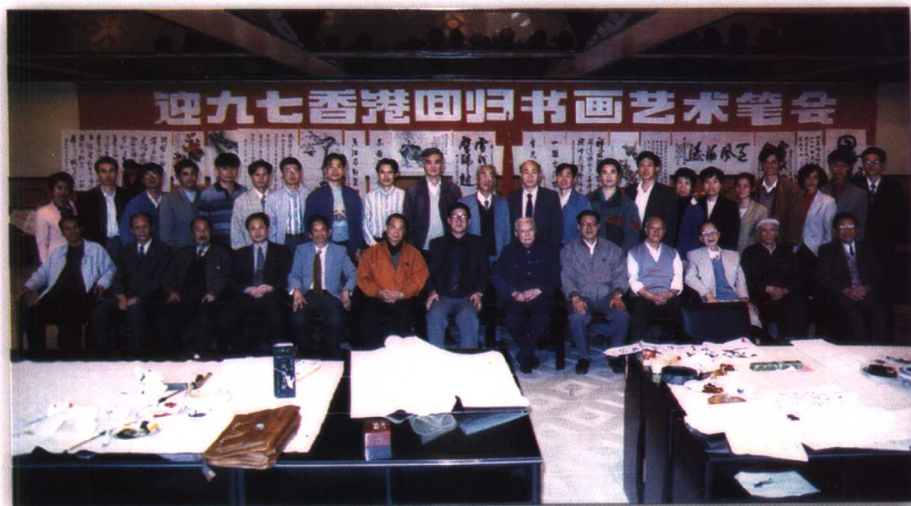
1996年11月，館員應福建省委黨校邀請參加迎香港回歸書畫藝術筆會