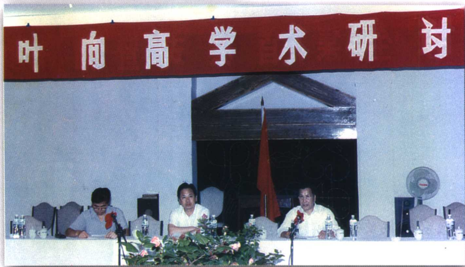
1995年8月，省文史馆在福清举办叶向高学术研讨会