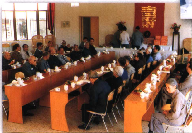
1990年10月敬老节，为80岁以上馆员祝寿