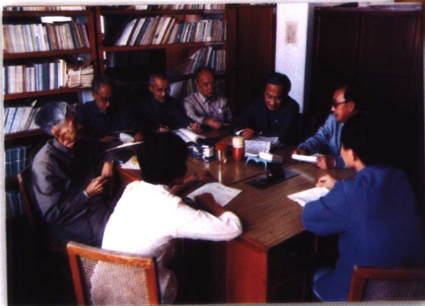
1989年11月，《福建文史》创刊筹备会议