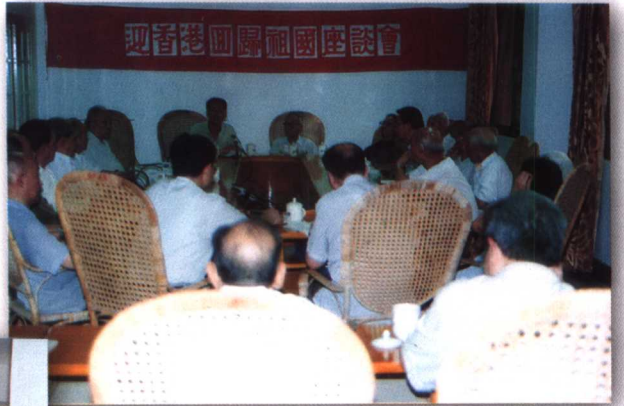
1997年，省文史馆举行迎香港回归座谈会