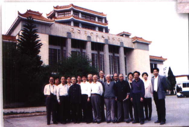
1996年4月，馆员参观闽西革命历史纪念馆