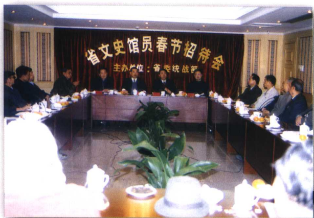
省委统战部举行省文史馆馆员春节招待会