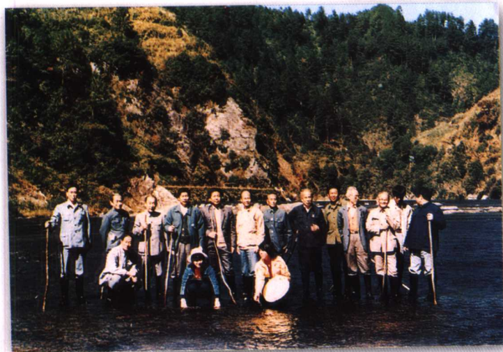
1988年11月，诗词组馆员到屏南白水洋采风