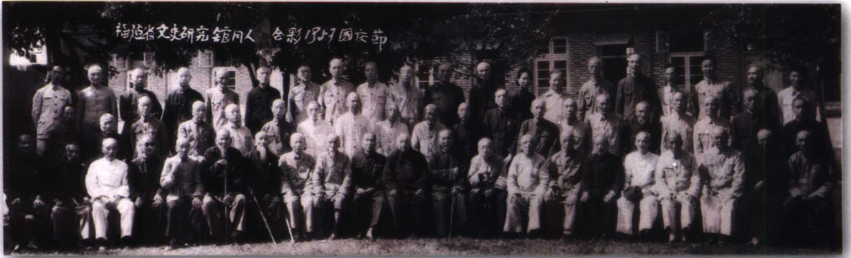
1957年国庆节，省文史馆馆员在福州圣庙路旧址合影