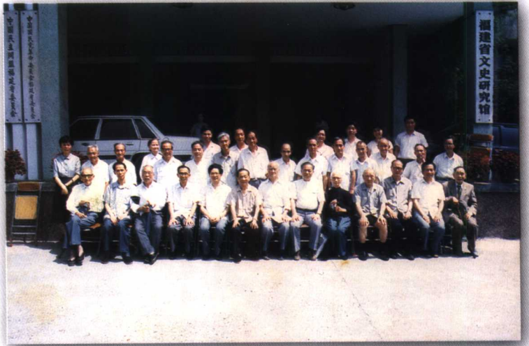
1989年省文史馆在省政协大楼办公时，部分馆员在楼前合影