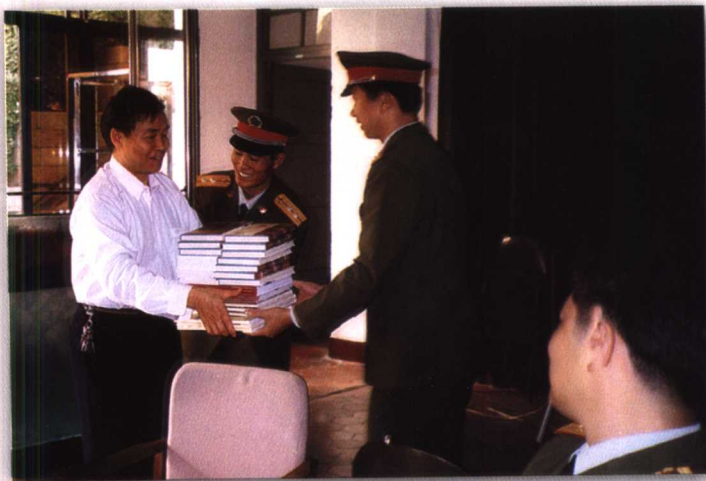
2002年12月，省文史馆向厦门鼓浪屿好八连官兵赠送馆员作品