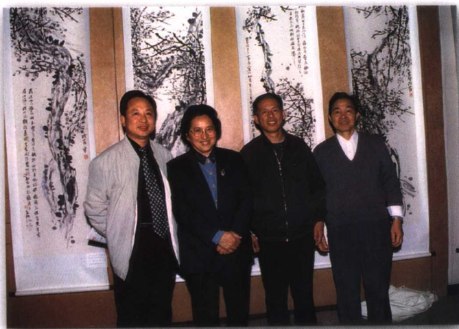
2002年10月，全国人大常委会副委员长何鲁丽在北京参观京津豫闽黔文史研究馆书画邀请展