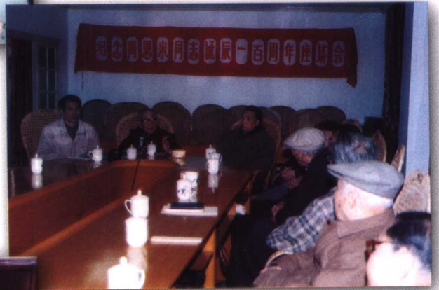
1998年3月，省文史馆举行纪念周恩来诞辰100周年座谈会