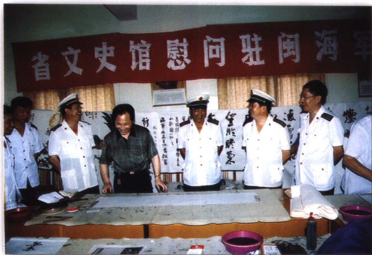
1997年7月，省文史馆慰问驻闽海军基地官兵