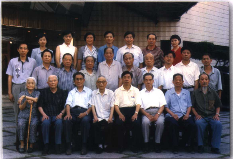
1998年6月，副省长潘心城(前左五)出席省文史馆老馆员座谈会时与馆员合影