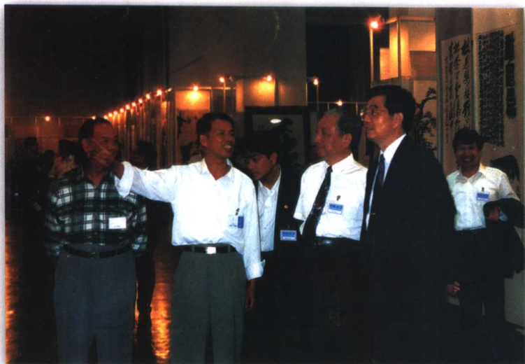
1996年9月，在北京举办全国文史研究馆成果展，中共中央政治局常委胡锦涛在中央文史馆副馆长王楚光、福建省文史馆副馆长欧孟秋陪同下参观福建展区