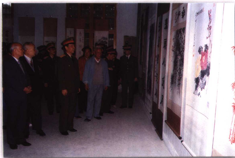
1997年11月，省委常委、省军区司令员陈明端观看省文史馆赴军营展出的书画作品