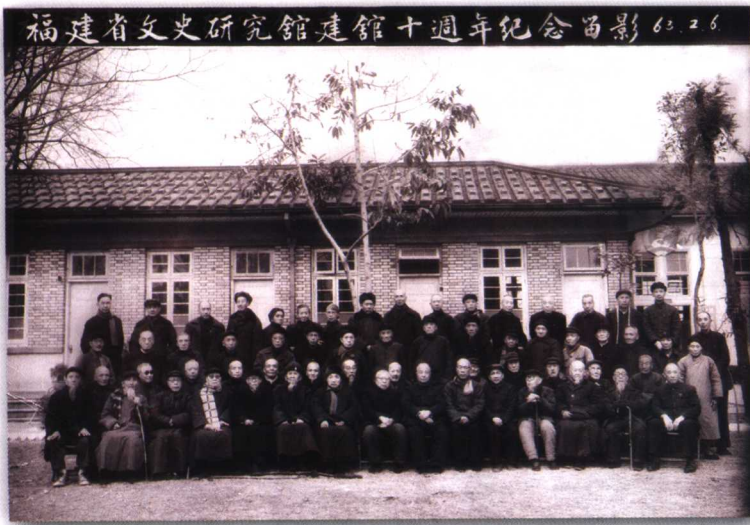
1963年2月，纪念省文史馆成立10周年时馆员合影