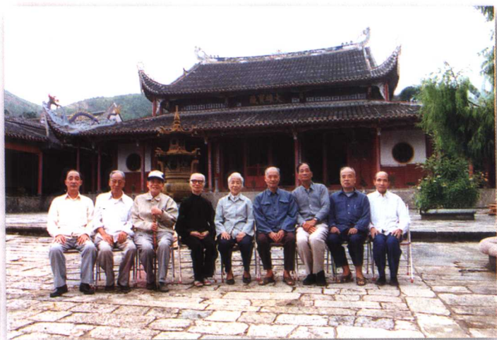
1988年，在闽侯雪峰寺举办暑期读书会时馆员合影