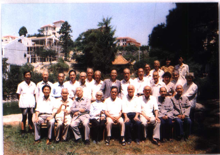
1992年7月，在福州鼓岭举办读书会时馆员合影