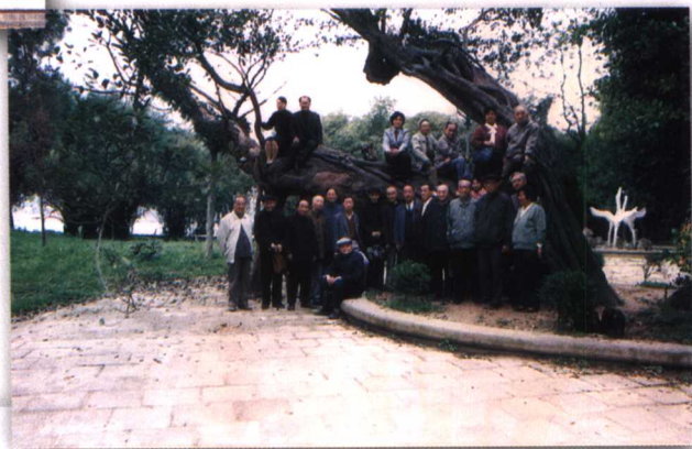
1993年，馆员到闽江三县洲采风