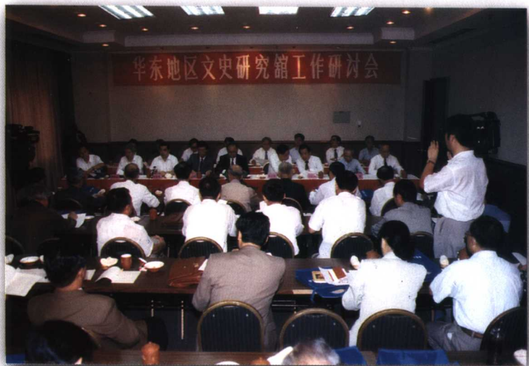
1995年10月，省文史馆在福州主办华东地区文史馆工作研讨会