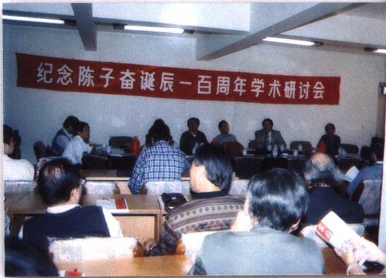
1998年，省文史馆与福州画院联合举办纪念陈子奋学术研讨会