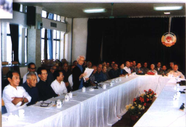
1989年10月，在省政协会议厅举行敬老节座谈会