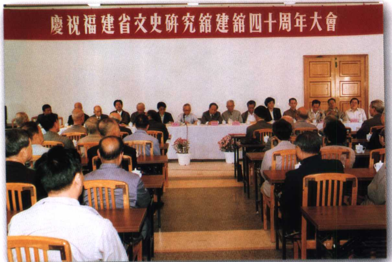
1993年10月，举行建馆40周年庆祝大会