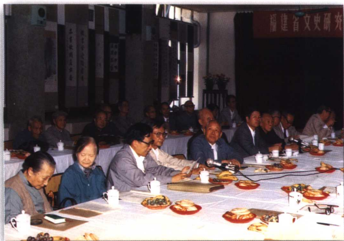
1988年10月，省领导伍洪祥（前左五）出席省文史馆成立35周年座谈会