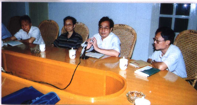
2002年1月，《福建丛书》编委会 业务会议