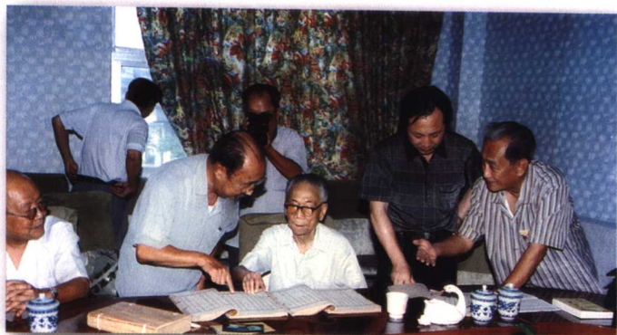
1998年3月，为刊印《福建丛书》 选定书目