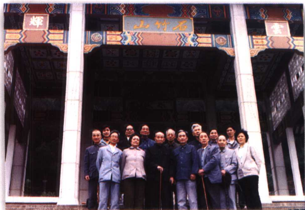
1988年上巳节，馆员到福清石竹山采风