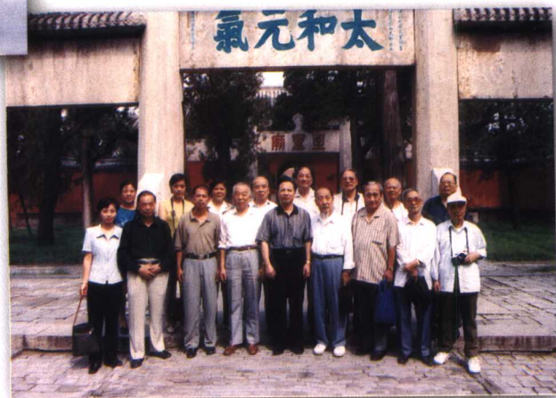
1998年9月，省文史馆组团赴山东进行文化考察