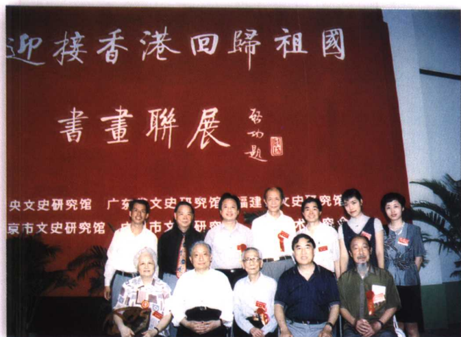
1997年6月，省文史館在廣州 參辦迎香港回歸書畫聯展