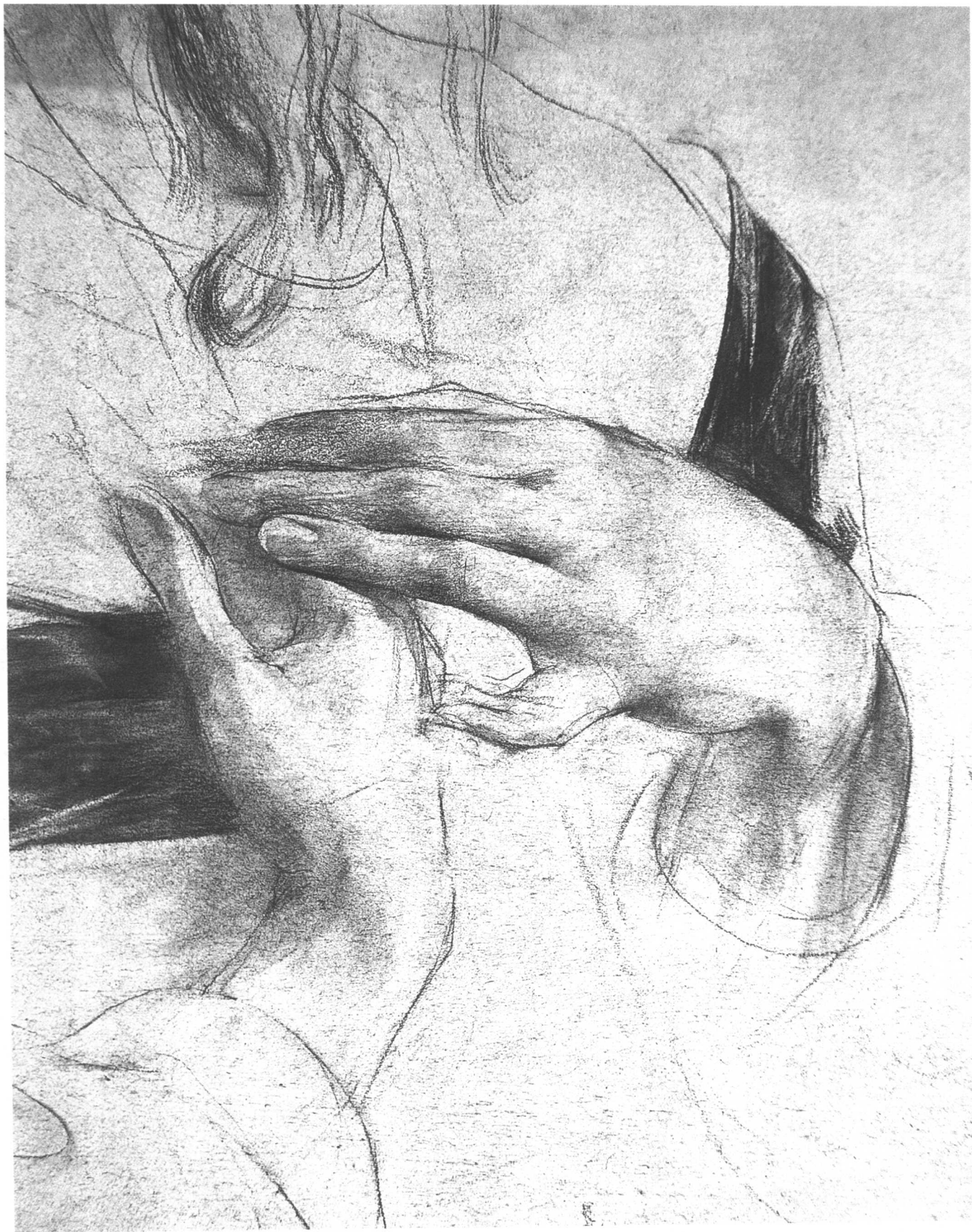
4. АНТОНОВ Е.Ю. 耶·尤 安东诺夫 铅笔 带调的纸 43 × 33cm ·克利斯蒂娜像(局部)