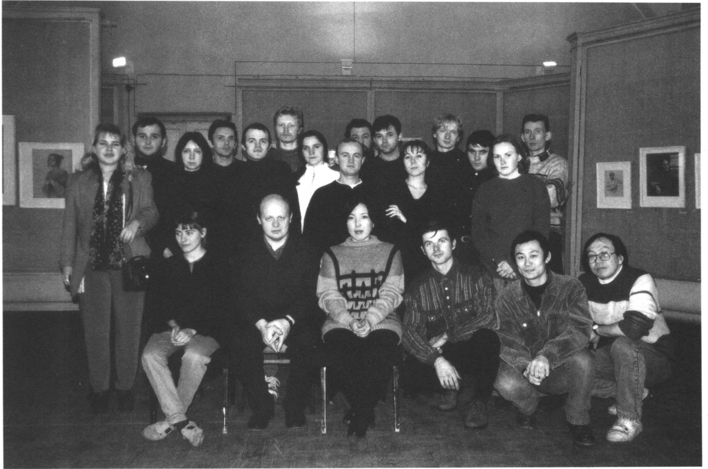
油画系索柯洛夫工作室素描教师及学生合影