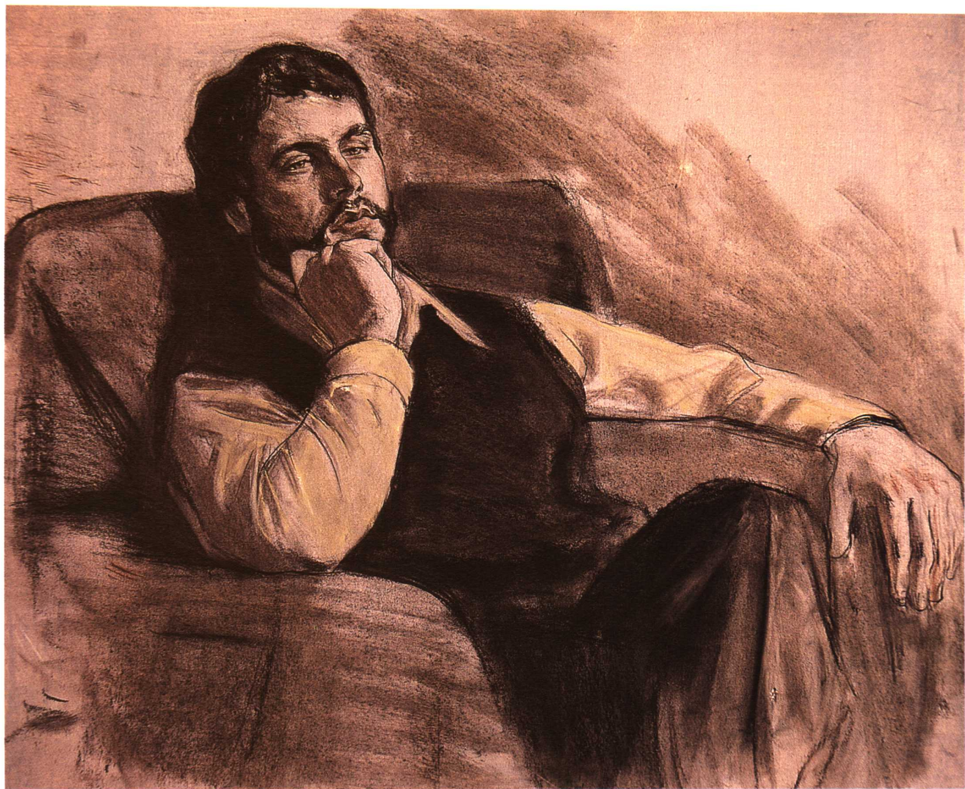
8. Дьячков Г.В. 戈·沃·吉亚契柯夫 带调的纸 混合技法 35 × 44cm 潘秋辛 吉玛像