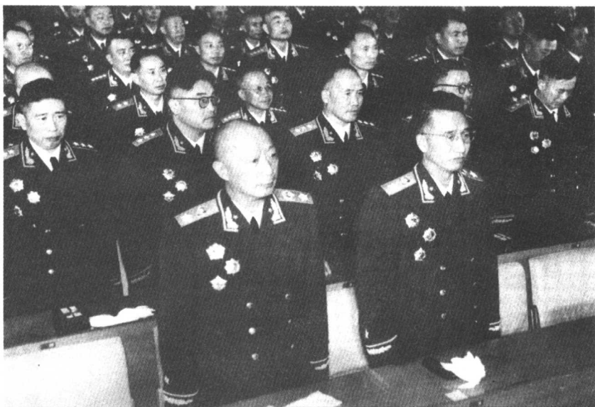
◇ 授衔仪式上的部分元帅和将军