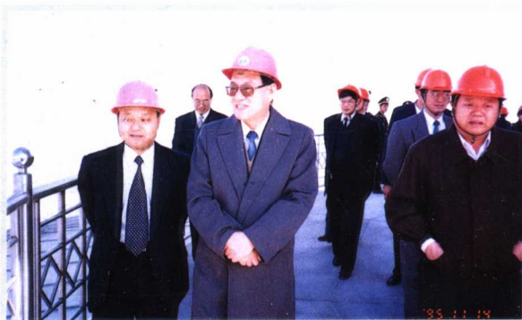
1995年11月4日中共山东省委书记赵志浩视察青岛广播电视发射塔。图为在电视塔露天观光平台上。