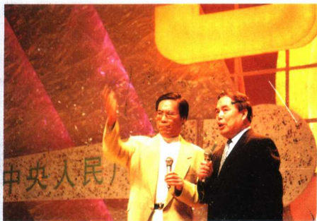
著名相声演员笑林、李国盛在庆祝中央人民广播电台55周年文艺晚会上表演。