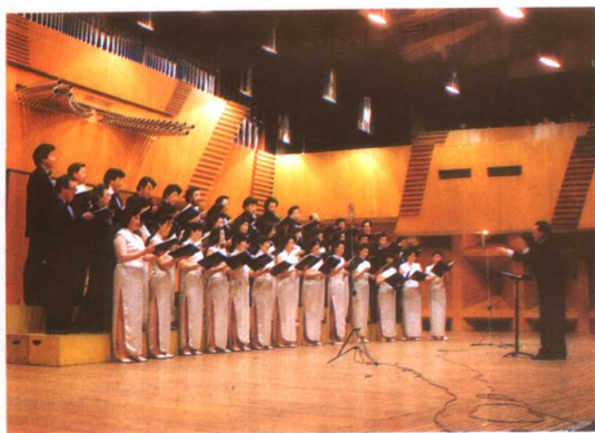
1995年1月4日中国广播民族乐团在台湾省台中市首场访问演出。