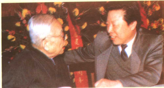
广电部部长孙家正在会上讲话。图为孙部长(右)与广播界前辈梅益亲切交谈。