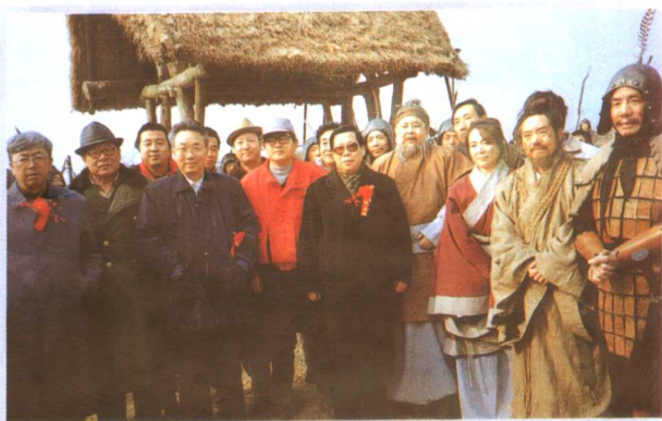
1995年12月3日，广播电影电视部副部长、中央电视台台长杨伟光与河南省委副书记宋照肃，省委常委、省委宣传部长张文彬等领导参观焦作黄河文化影视城时与正在拍摄大型历史电视剧《东周列国》剧组的导演及演员们合影。