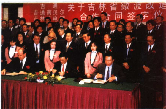
由吉通通信有限公司、吉林省广播电视厅、吉通南贝尔通信信息工程有限公司共同进行的吉林全省广播电视系统微波通信数字化改造工程合作合同签字仪式,3月10日在北京举行。