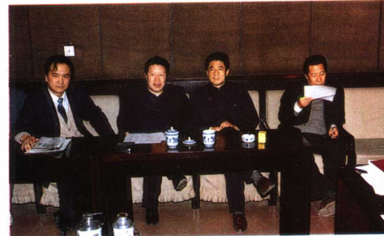
孙家正部长、杨伟光副部长及有关领导在审看中央电视台新闻节目。