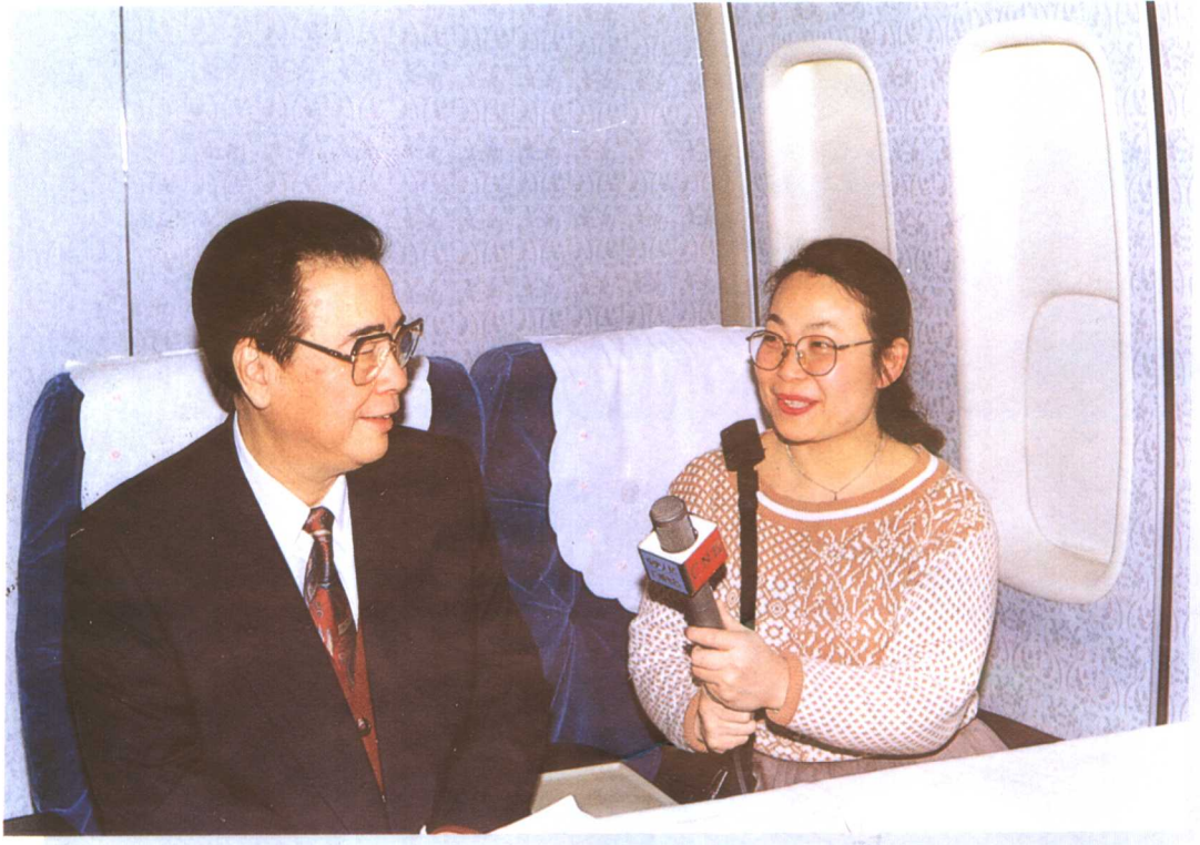
1995年3月，李鹏总理出席在丹麦哥本哈根举行的国际会议后，在回国专机上接受中央人民广播电台记者采访。