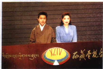
西藏电视台播音员在新落成的“广播电视译制制作播出中心”播音。