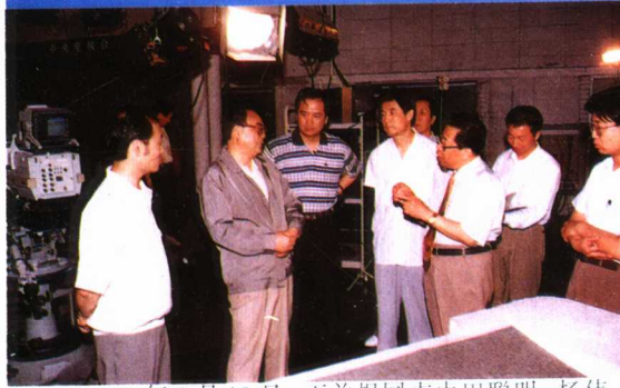
1995年6月13日，丁关根同志由田聪明、杨伟光同志陪同，视察中央电视台新闻中心，他称赞《焦点访谈》很受欢迎。