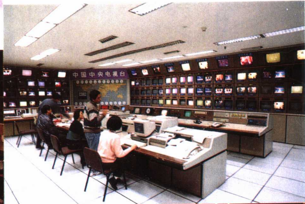
中央电视台一九九四年平均每天播出20.5小时，到一九九五年平均每天播出22.5小时，增加了百分之九十九以上。