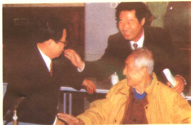
广电部副部长兼中央台台长同向荣主持会议。图为同向荣(中)、广电部副部长杨伟光(左)和广播界前辈温济泽(右)亲切会面。