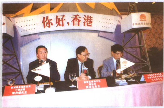
中国国际广播电台为香港听众制作的《你好，香港》特别节目（普通话、英语、广州话各1小时）从5月1日起在香港新城电台正式播出。