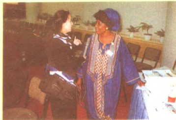
世妇会期间,华语台记者采访外国代表。