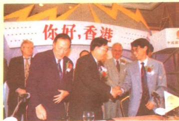
华语台为香港听众制作的《你好,香港》节目在香港新城广播电台播出后,受到香港听众的欢迎。