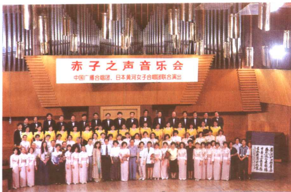
1995年7月24日中国广播合唱团和日本黄河女声合唱团联合举办“赤子之声”音乐会。（中国广播艺术团提供）