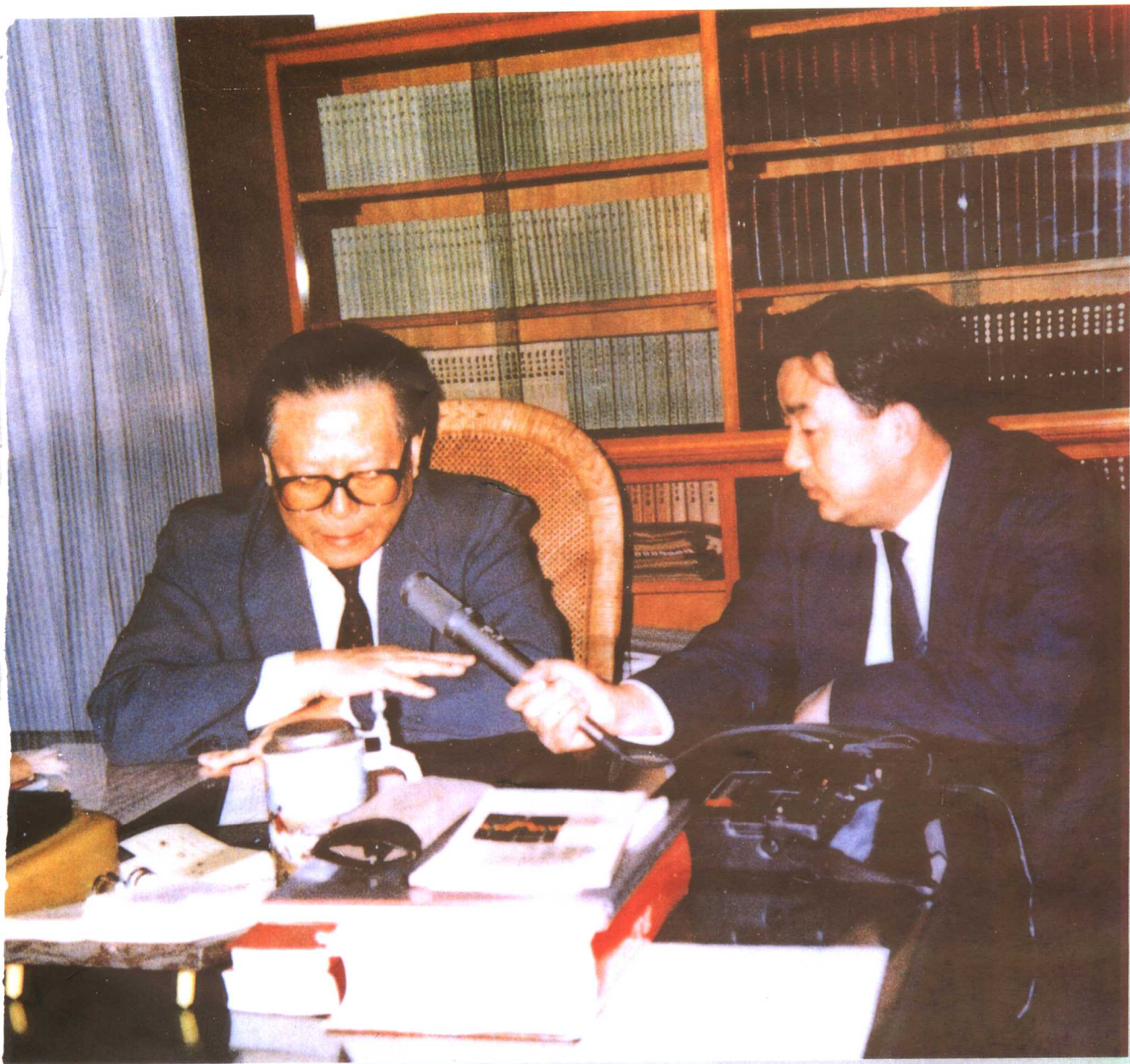
江泽民主席接受中央人民广播电台记者刘振英的采访