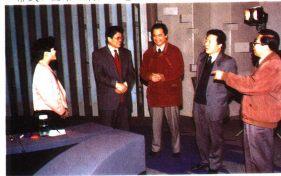
12月27日，李铁映同志由孙家正、杨伟光、李东生同志陪同视察了中央电视台新闻中心。