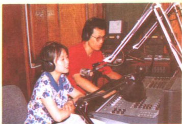
节目主持人正在录制《五彩周末》节目。