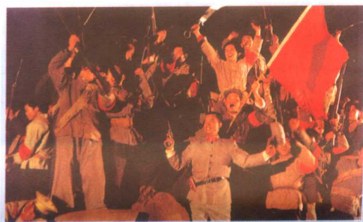
11集电视连续剧《上海大风暴》剧照。