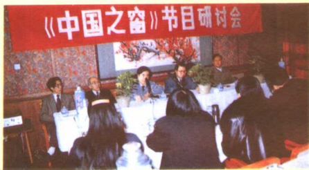
◀1995年12月12日，《中国之窗》节目研讨会在北京举行。与会代表一致认为，《中国之窗》已经成为世界各国听众了解中国改革开放和经济建设的窗口。