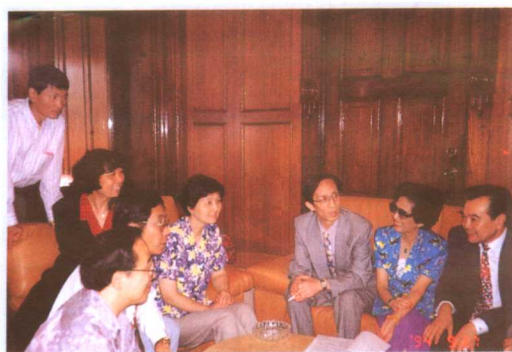
盛重庆和《大家族》主创人员讨论剧本。