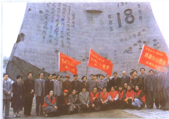
沈阳、吉林、哈尔滨三市经济广播电台为纪念抗日战争和世界反法西斯战争胜利50周年举办《跨越白山黑水》大型联合采访活动。