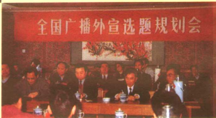
◀广电部部长孙家正(中)，国务院新闻办原副主任李源潮(左)和国际台台长张振华(右)亲切交谈。