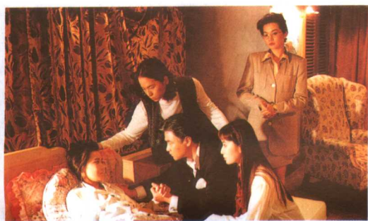
18集电视连续剧《大家族》剧照。