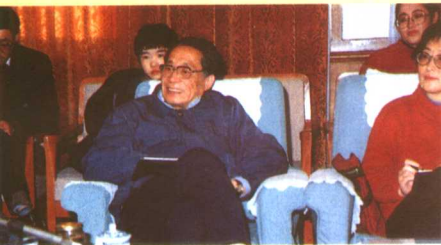
▲在《中国之窗》节目研讨会上，各省、区、市台代表们畅所欲言。