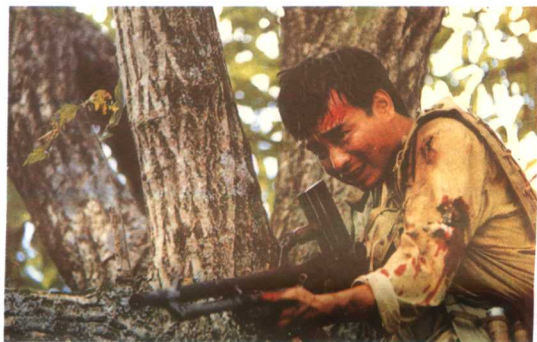
18集电视连续剧《乌龙山剿匪记》剧照

自1980年4月至今,15年间共组织(参加)摄制电视剧二百多部(集)。其中:作为制片人(制片主任)组织(参与)拍摄的84集电视连续剧《三国演义》、18集电视连续剧《乌龙山剿匪记》、3集戏曲电视剧《喜脉案》、单本剧《她从画中走出来》荣获全国优秀电视剧“飞天奖”;两集电视剧《毛泽东