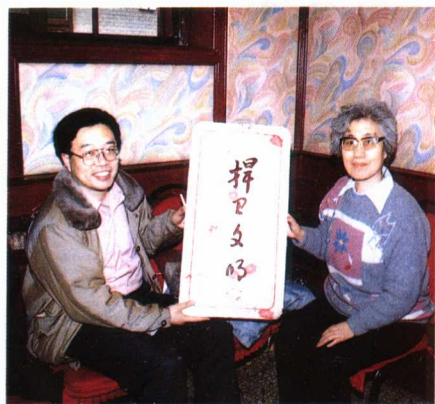
听众把亲手绣制的“捍卫文明”的匾额赠给北京人民广播电台新闻部。