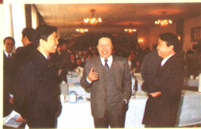
——广播电影电视部部长孙家正在首届全国广播对外宣传协作会上讲话

根据《首届全国广播对外宣传协作会议》的精神，开办的《中国之窗》节目的宗旨是：适应各地加强对外开放、对外宣传的需要，通过中国对外广播渠道，利用中国国际广播电台数十年广播外宣经验及各地丰富的新闻报道资源和人力资源，形成的广播外宣合力，更全面、更充实地介绍中国各省区市经济发展和 社会进步，增进海外听众对各地的认识和了解，以利中国改革开放事业。