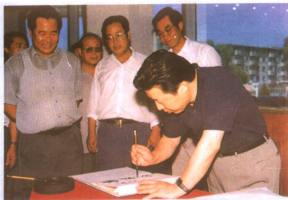
广播电影电视部孙家正部长视察沈阳广播中心大楼，并为中心题词。