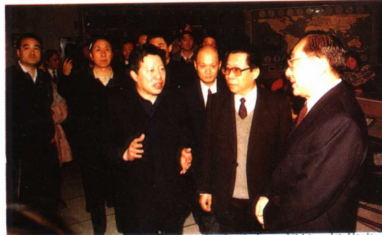
12月8日李岚清副总理由孙家正部长、杨伟光副部长陪同，出席全国少儿电视节目题材规划会闭幕式，暨第三届少儿电视节目“金童奖”颁奖大会。