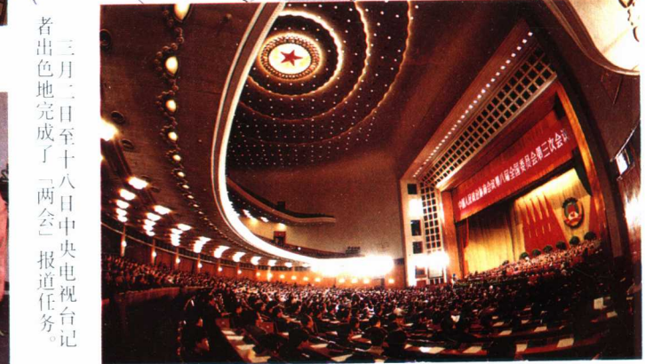
9月4日至15日顺利完成了“世妇会”报道任务，受到了中外各界好评。