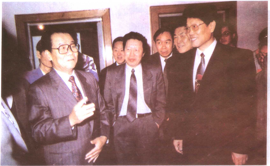
中共中央政治局常委、政协主席李瑞环，国务委员李铁映在中国国际广播中心大楼落成典礼上。