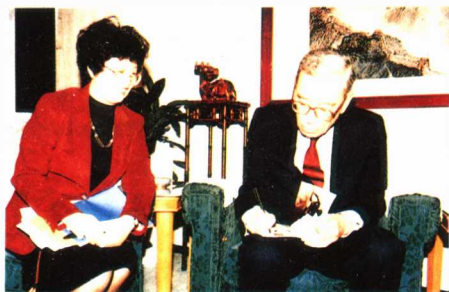
联合国秘书长加利为中国国际广播电台举办的“天津杯·联合国第四届世界妇女大会”题词。