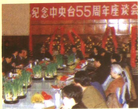
纪念中央人民广播电台 55 周年座谈会场景。