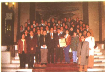
华语台被评为1995年度广播电视影视系统先进集体。

华语台与国内31家省市电台联合开办《中国之窗》节目,开辟了中央、地方联合共创广播大外宣的新路。