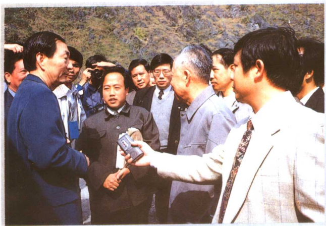
1995年11月14日，国务院副总理朱镕基到广西壮族自治区贫困的大石山区访贫问苦。图为朱镕基副总理在广西大化瑶族自治县七百峯乡考察时，接受记者采访。