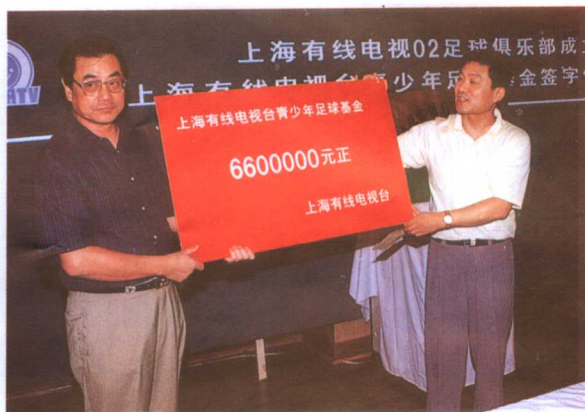
上海有线电视“02足球俱乐部”成立。