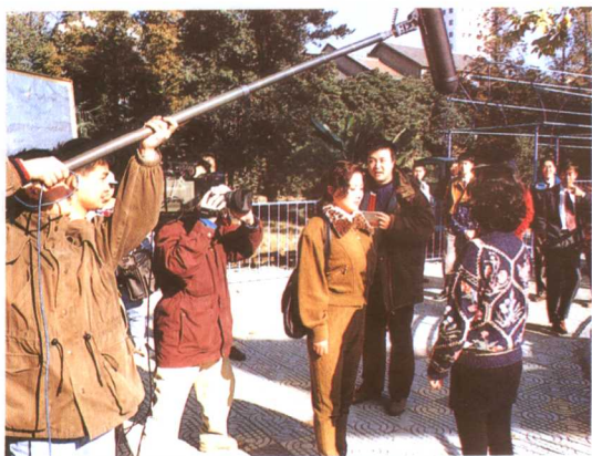
上海有线电视台的百集小品《你说好不好》拍摄现场。