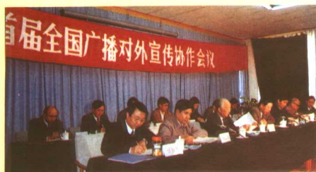
◀1994年10月24日至27日，中国国际广播电台受中央外宣办及广电部委托，在北京召开了首届全国广播对外宣传协作会议。

根据广播电视并举、内宣外宣并重的思想，落实全国外宣工作精神，发挥系统优势，建立一个以国际台为龙头，以各省市电台为依托，相互弥补，相互支持的全国性广播对外宣传协作网，使广播电台系统对外宣传登上一个新台阶、开拓一个新局面、摸索一种规范和有效的合作模式。这也是一种中国特色。