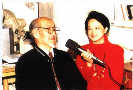
北京音乐台记者采访著名词曲作家王洛宾。