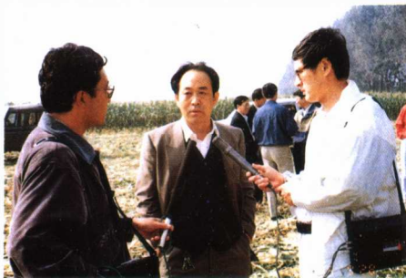
中央人民广播电台经济部记者在通县城关镇采访。