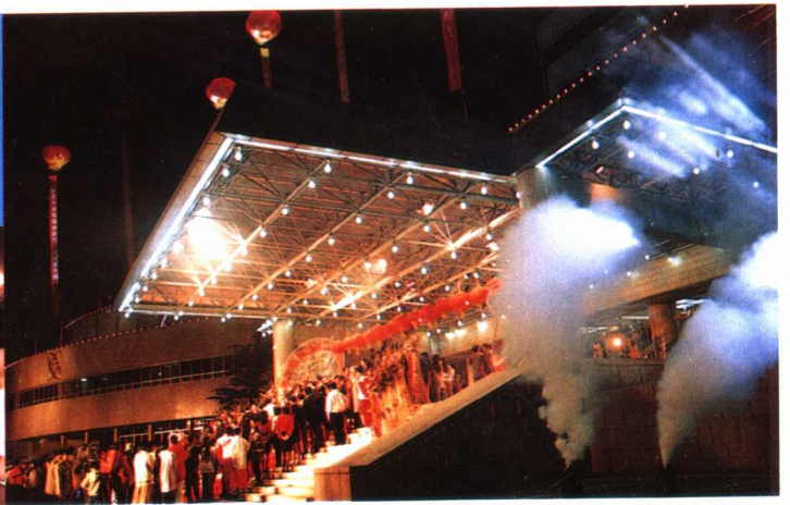
11月30日，中央电视台加扰卫星电视开始试播。这是正在举行的开播仪式。