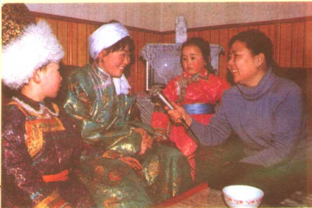
▲内蒙古台记者为制作《中国之窗》节目，深入牧区采访。