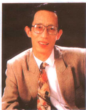
上海电视台台长盛重庆，在电视连续剧《大家族》和《上海大风暴》中，出任总监制人。