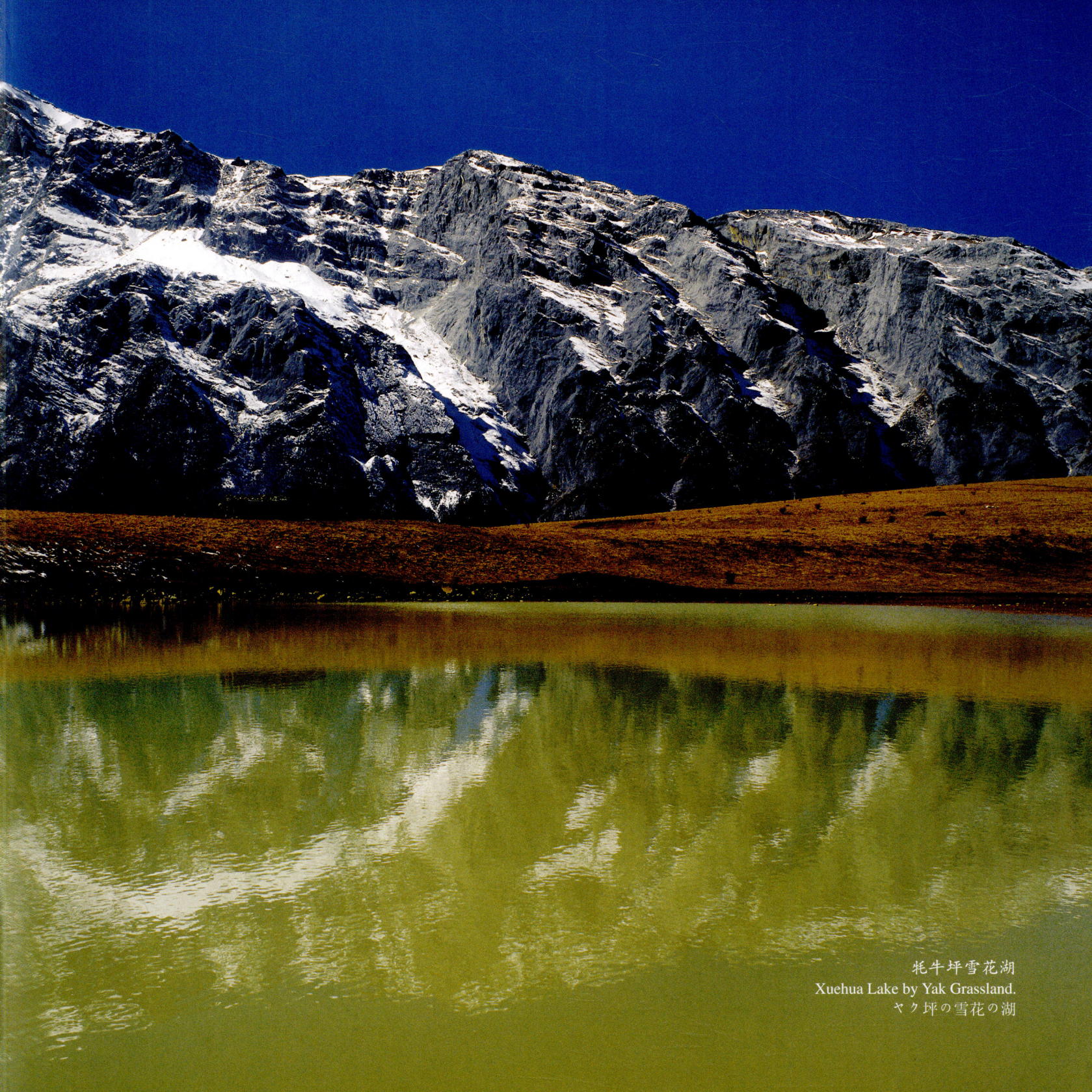
牦牛坪雪花湖 Xuehua Lake by Yak Grassland. ヤク坪の雪花の湖