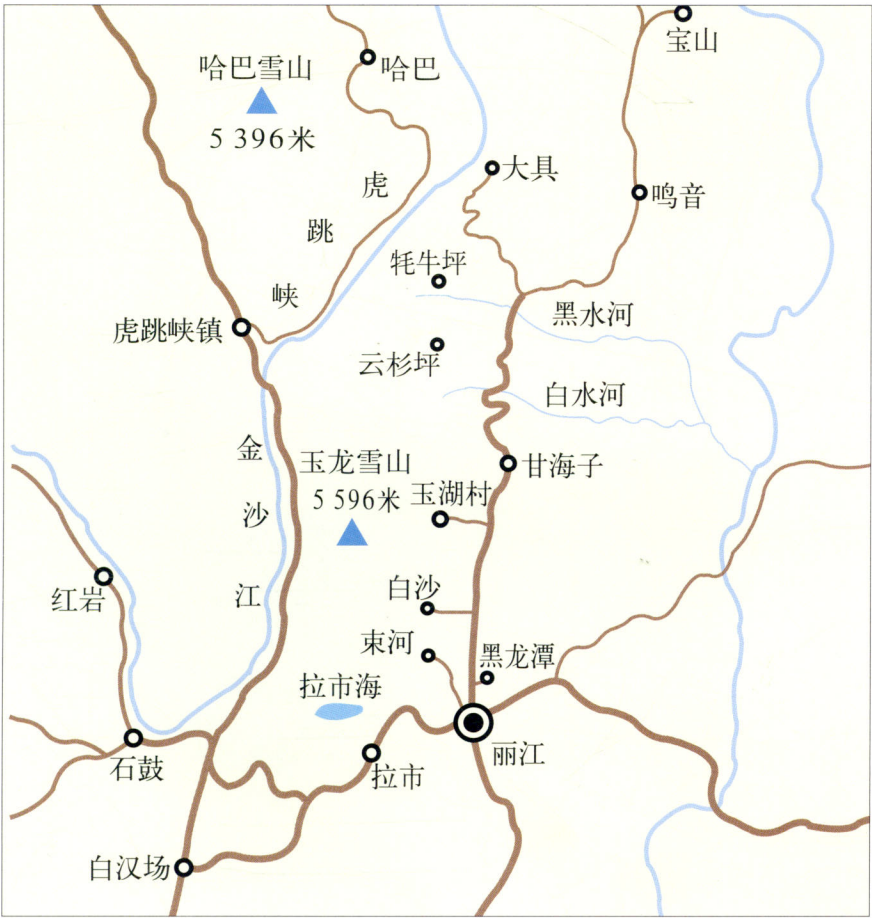
玉龙雪山主要景点示意图