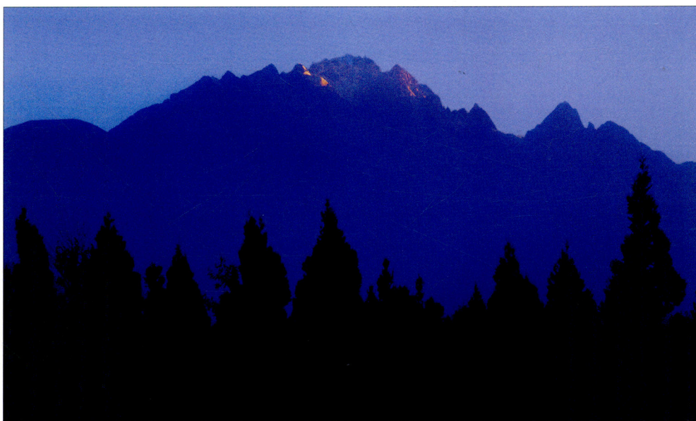
晨曦中的玉龙雪山 Yulong Snowy Mountain at dawn. 夜明けの中の玉龍雪山