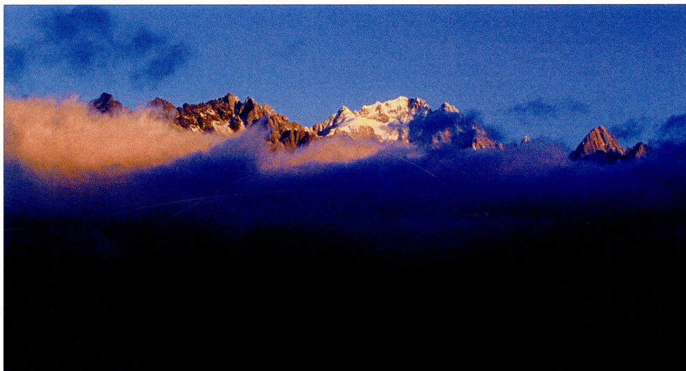
雪山日出 Sunrise at Yulong Snowy Mountain. 雪山の日の出