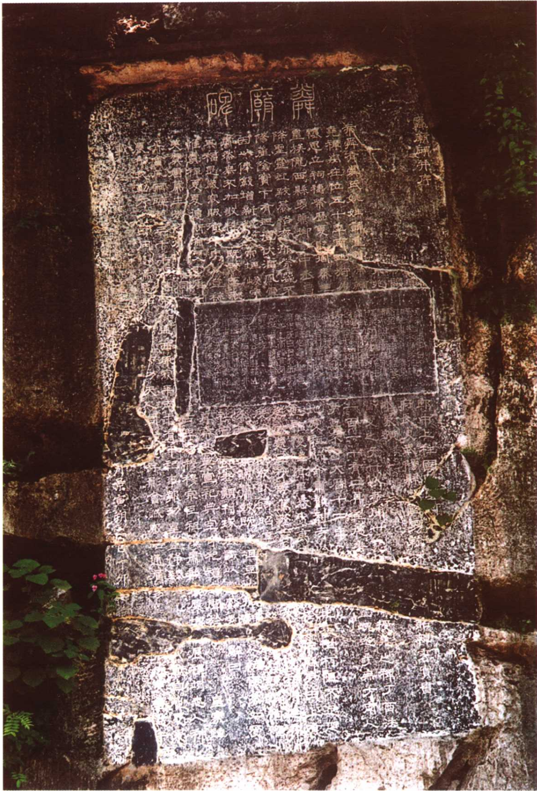
8. 唐·韩云卿《舜庙碑》(虞山)