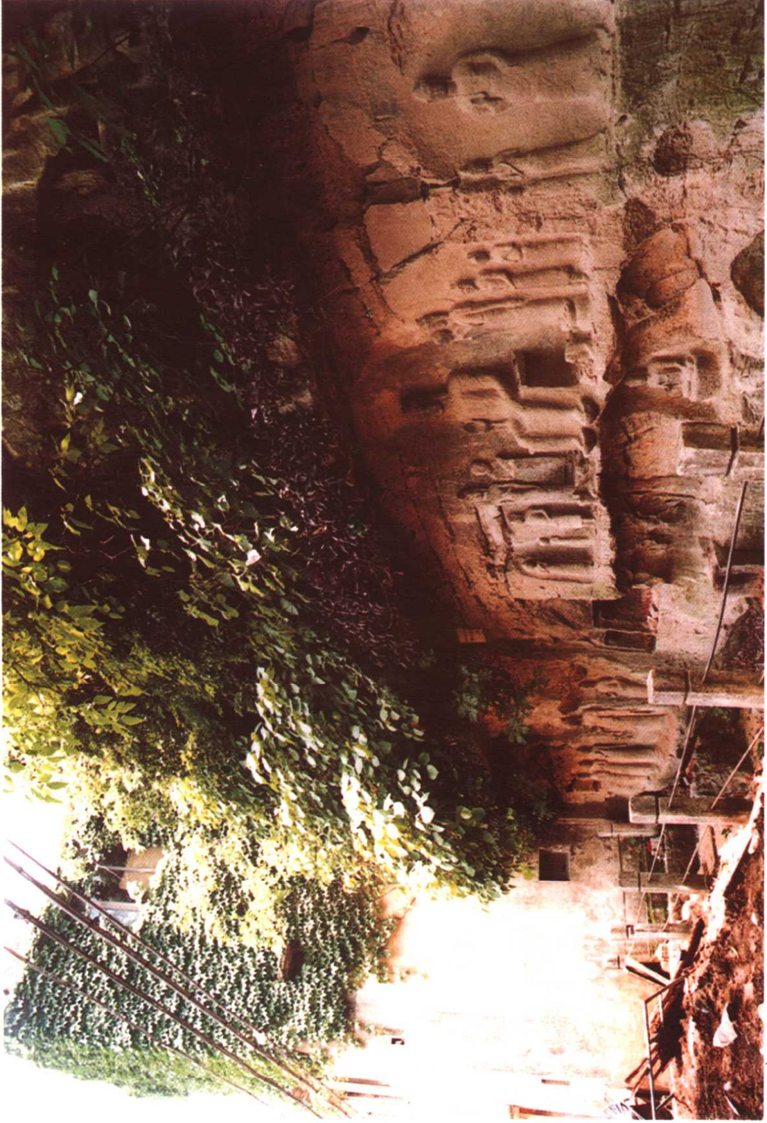
7. 唐·骝马山摩崖造像