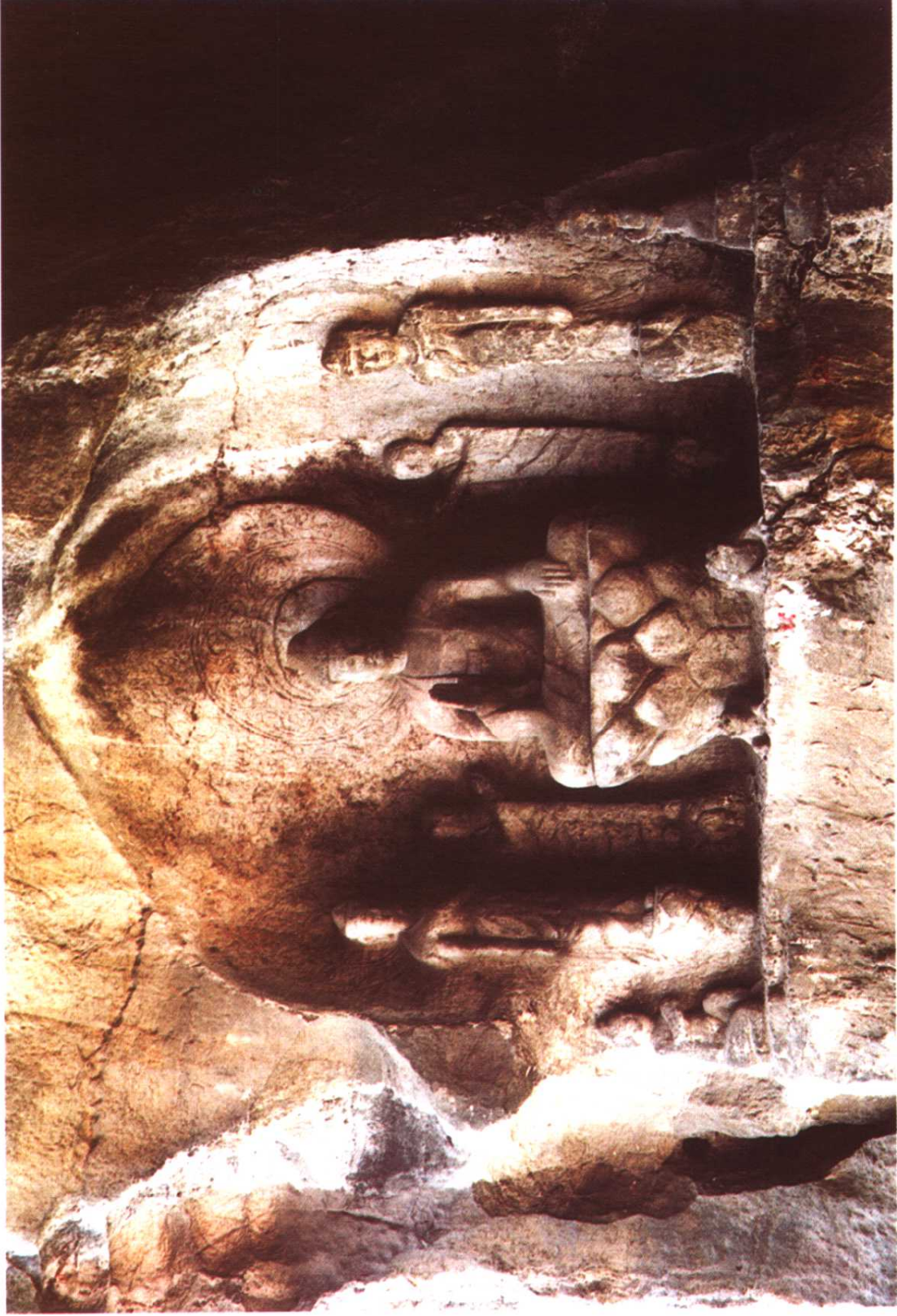
6. 唐·伏波山摩崖造像