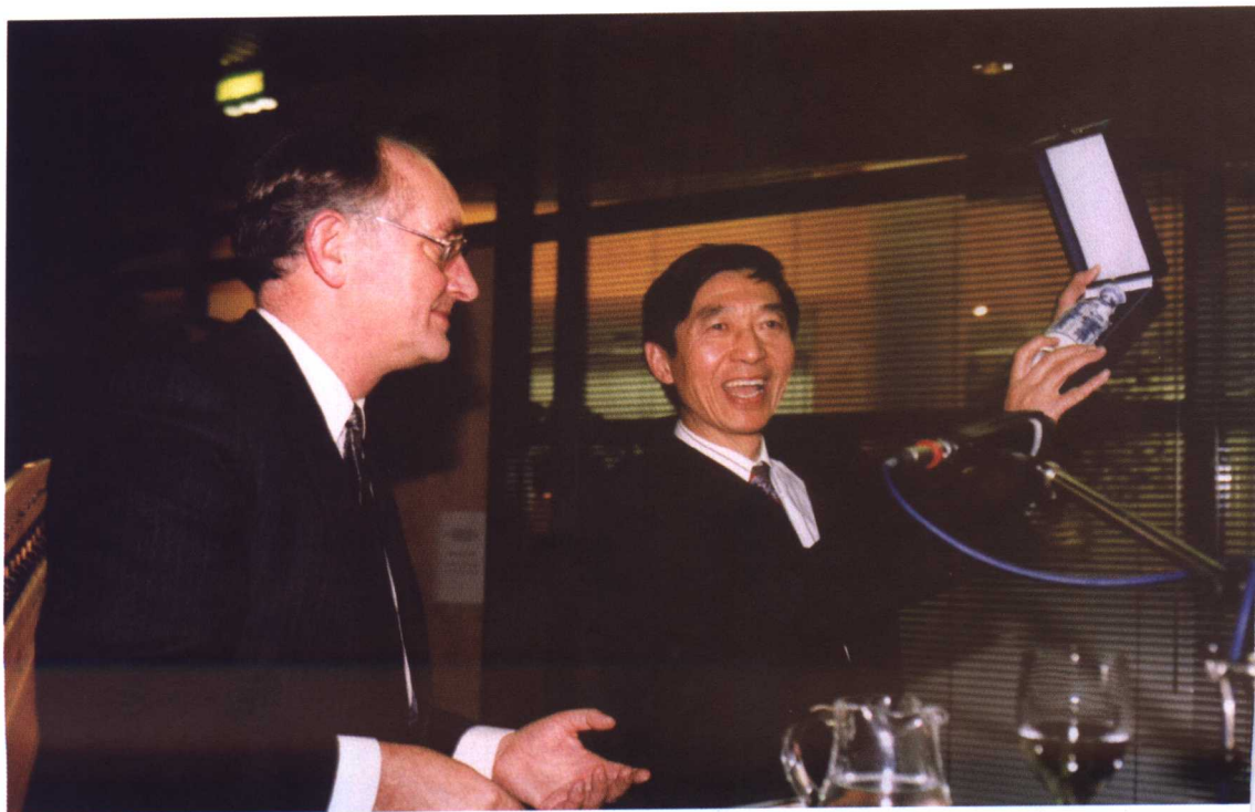
1995年11月9日，吴建民大使在荷兰出席KLM活动（Skippers of the Fly Dutchman）。