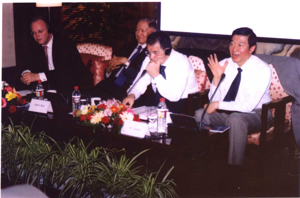
2005年5月18日，吴建民院长在外交学院举办的“中欧全面战略伙伴关系”高层对话会上讲话。