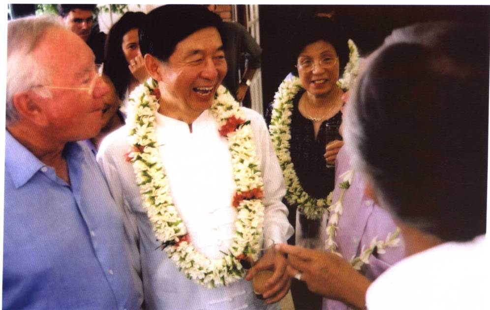
2001年4月，吴建民大使夫妇访问法属波利尼西亚。