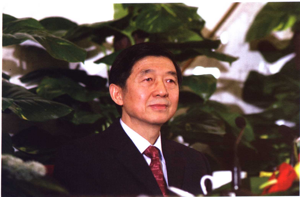
2006年3月2日，全国政协副主席兼新闻发言人吴建民在全国政协十届四次会议新闻发布会上。