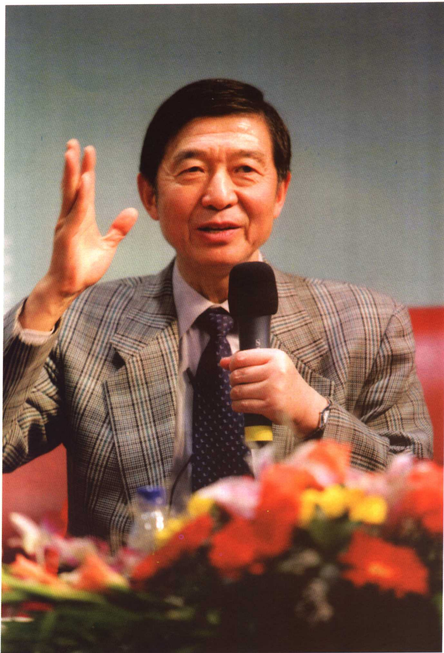
2005年12月19日，吴建民院长在上海《解放日报》举办的“文化讲坛”讲话。