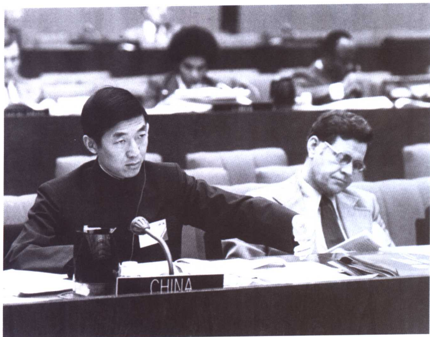
1977年，中国常驻联合国代表团成员吴建民在联合国会议上。