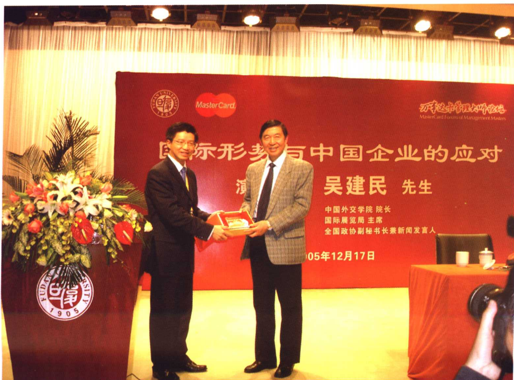
2005年12月17日，吴建民院长在“万事达卡管理大师论坛”演讲。