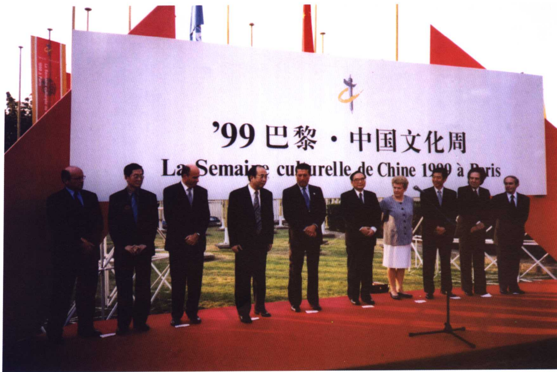
1999年1月10日，吴建民大使(右三)与法国总统希拉克在巴黎参加中国文化周活动。