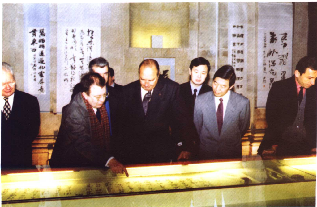
1999年1月10日，法国总统希拉克在巴黎观看中国书法展。