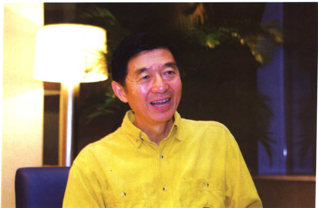
外交学院院长、国际展览局主席吴建民