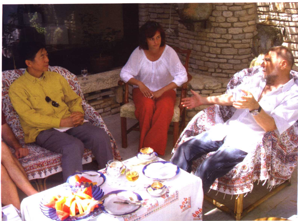
2006年7月2日，吴建民院长在Wangn 岛会见克罗地亚总统梅西奇。