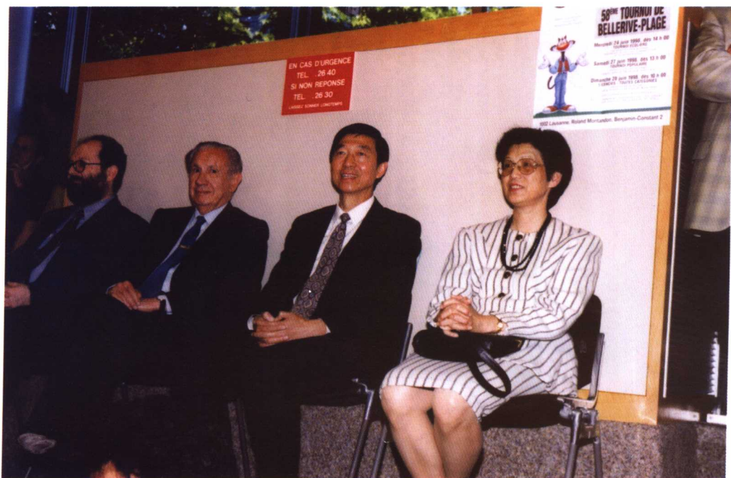
1998年8月，吴建民大使夫妇与国际奥委会主席萨马兰奇在洛桑观看乒乓球表演赛。