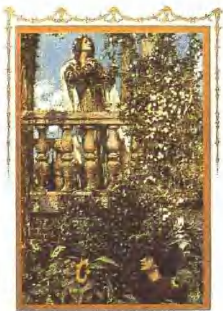
话剧《罗密欧与朱丽叶》（戏剧画）

《万里》的戏剧结构，开头通过着费和四风的一场微妙的神话交代了生活在周公馆内的人物及其关系。随后，剧情迅速发展，情节环环相扣，各种人物先后登场。该剧冲霄越尖越亮；最后一幕中，剧情向高潮推进，四风、周萍触电身亡，周萍拔枪自杀。全剧结构十分紧凑，富于戏剧性（1941年，西北战地服务团抗敌剧社演出的《万里》）。