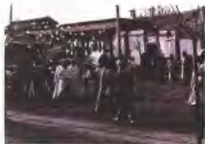
清末民初老北京的出殡场景