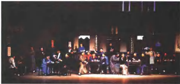
话剧《茶馆》中的老舍要表现旧北京的一些普通茶馆，客人们到这里来品茶、下棋、去皮、谈判交易、解决纷争……