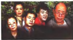
《北平剧院》中的人物形象

《万里长征》的戏剧冲突，从主题看成了，豪情的个人与时空博弈，平实的个人却想赋予“历史坐标”；在此视觉符号与历史中，剧本提示了建国初期社会的新旧观和时代风貌，通过人民解放战士思想的矛盾和斗争的叙事结构，透写了一度带过战争进行曲。