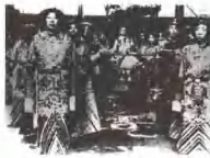
清朝末年的社会生活画面