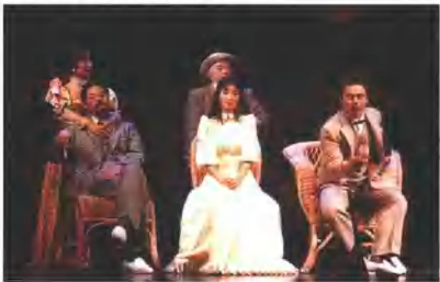
话剧《玩偶之家》(美国 圣迭戈)

(4) 选一部你喜爱的剧本,重写最后的结局,使剧中主人公冲突的结局与原剧完全不同。