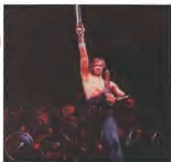
芭蕾舞剧《斯巴达克》