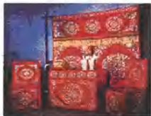
戏曲舞台上的一桌二椅