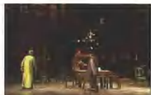
《茶馆》终场，王利发、常四爷、秦仲义三位老人慨然祭奠自己押运的奇迹，也寓意着力旧社会悲剧