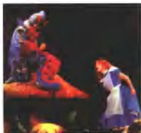
儿童剧《爱丽丝漫游奇境记》