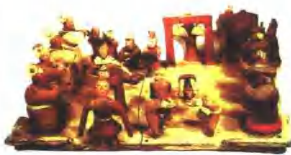
西泠乐舞百戏影乐团