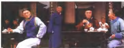
剧中，对清朝末年军机处向袁世凯等历史事件也有所反映