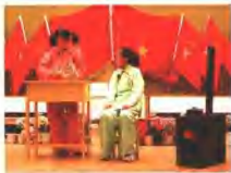
同学们表演的课本剧《小灯笼》