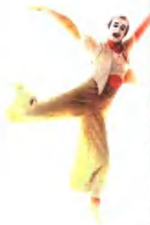
哑剧(德国,米兰斯拉什克)