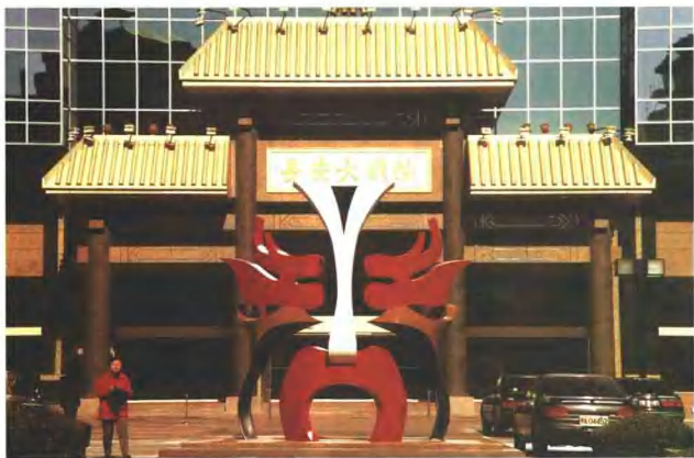
北京长安大戏院的现代玻璃幕墙，古典的门楼和传统戏曲脸谱造型