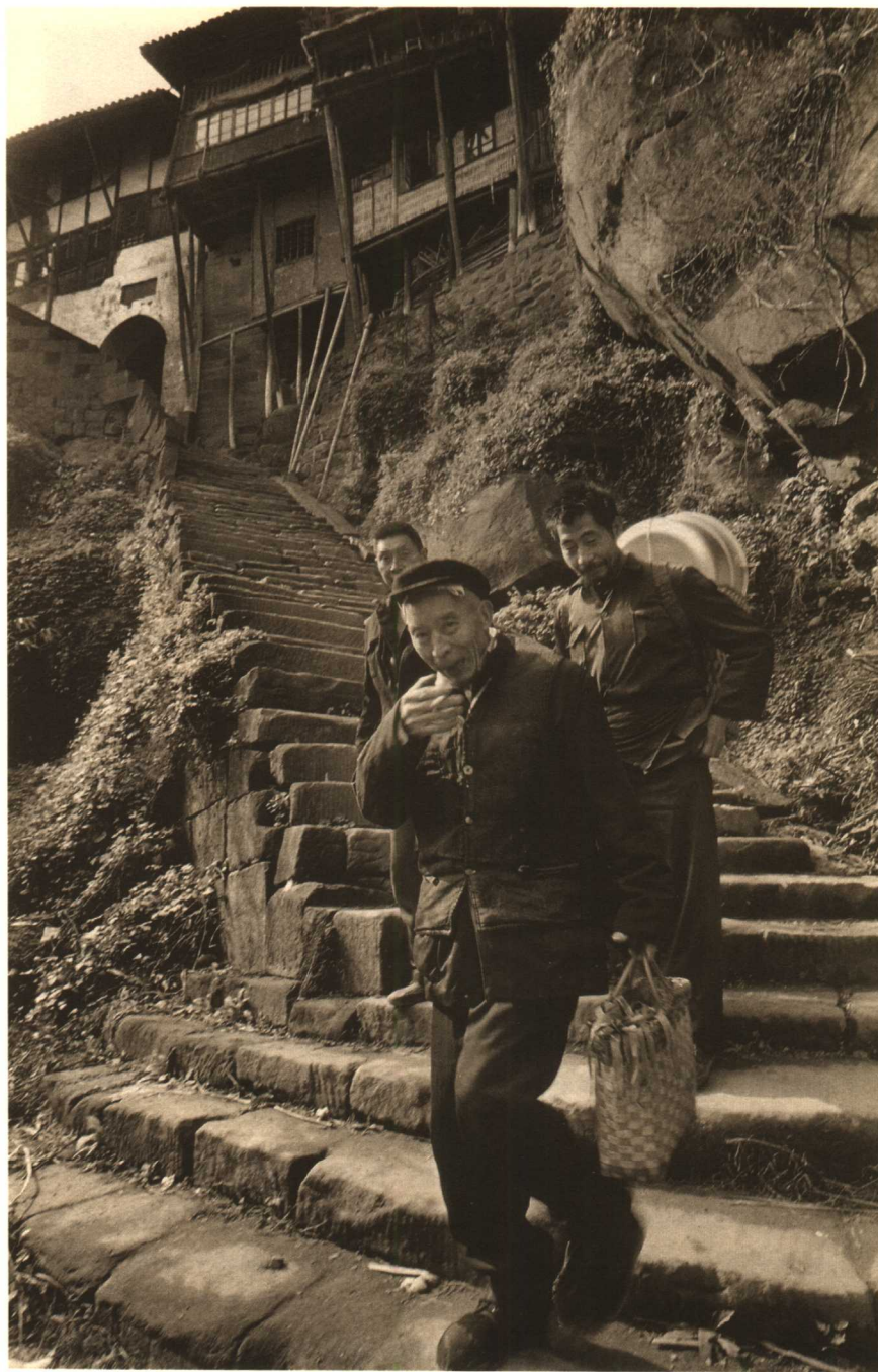
4 老汉回身指着长长的石桥说，当年中央红军是从习水方向开来的，攻占丙安后，红军的团部设在了老街之上。