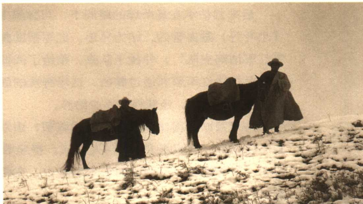
红军顺利地穿越了古老的凉山。

从100米打陶罐到200米打土豆。在空旷的田坝边几番枪战后，比赛进入了白热化，决定胜负的一枪是用枪射击抛向空中的物品。那一刻，双方呐喊助阵的队伍突然安静下来，正是这决定性的一枪，红军神枪手险胜头人的手下。“服了！”彝人向神枪手向红军竖起了大拇指。刘伯承、聂荣臻率部进至彝海附近时，趁热打铁，向彝族同胞宣传红军的宗旨和共