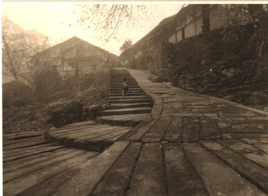
清冷的老码头上，曾经迎接过红军的到来，岁月走远，红军的记忆没有丝毫淡忘。 5

丙安东华门下有座建于清初的双龙石桥，桥中两座桥墩上今存有一雄一雌石龙，通体雕刻有龙鳞和云花。当年红军攻取丙安也曾经过此桥。如今过河赶场的百姓们在镇上卖农作物，喝完清淡的水酒，也是经此桥回家。赤水河边有许多古老的大树，粗细不一的根藤从岩石的缝隙里伸出，把整块的岩石缠裹。大树遮天的树头伸向河心，沧桑古树见证着几十年前红军长征途经此地的风风雨雨。