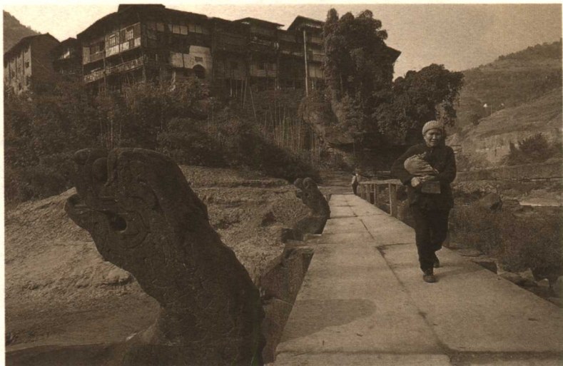
—— 双龙石桥建于清初，站在桥上还能想象当年红军攻取丙安桥的情景。

泸州之间北渡长江，与川陕根据地红四方面军会合。蒋介石调集重兵封锁了长江，红军迅猛进抵赤水、习水县境后，于27日、28日在土城、元厚（猿猴）一渡赤水河，转战云南扎西地区。2月18日、19日在二郎滩、太平渡、九溪口二渡赤水河，直捣桐梓县城，攻克娄山关，重占遵义城，取得了长征以来第一个大胜利。3月16日、17日在茅台三渡赤水河，进入四川古蔺县境。3月21日晚至22日，从二郎滩、太平渡、九溪口四渡赤水河，并于5月上旬巧渡金沙江。至此，红军成功摆脱了数十万敌军的围追堵截。