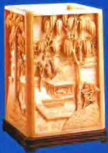
象牙雕山水人物方笔筒(清)