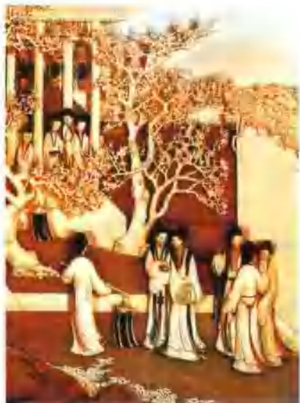
象牙雕月漫清游册(清)