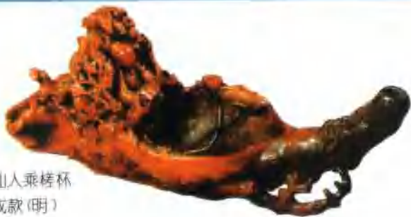
犀角雕仙人乘楞杯 鲍天成款(明)