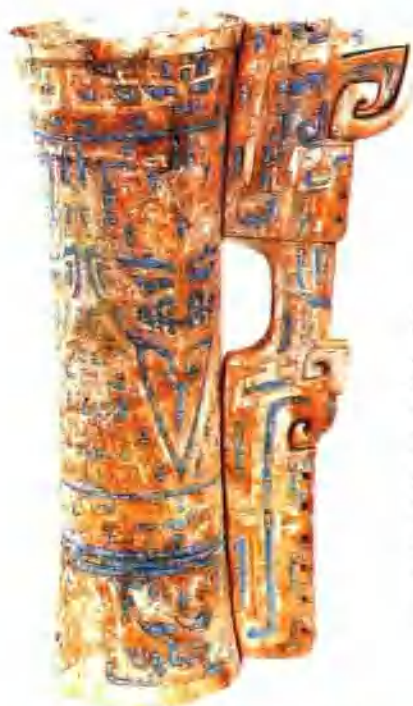
镶嵌松石象牙(林妇好墓出土)(商)