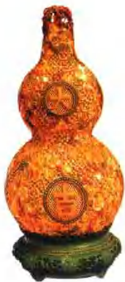
大吉葫芦式牙雕花薰(清)