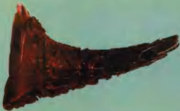
犀角透雕花卉蟠龙杯(明)