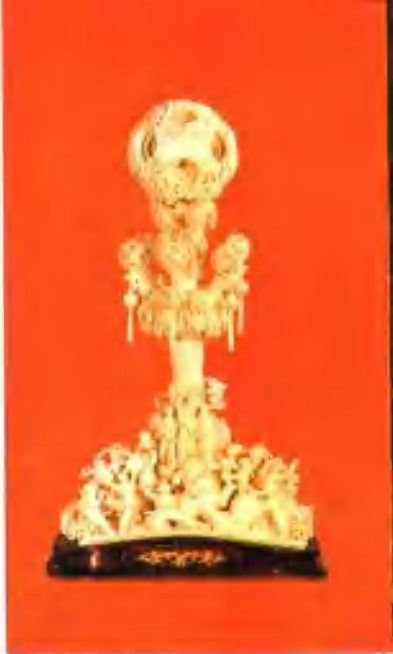
象牙雕庆丰收 30层牙球(当代)