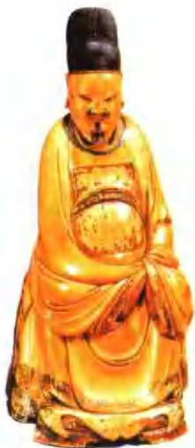
象牙雕文官人物(明)