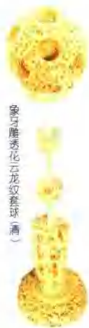
象牙雕透花云龙纹套球(清)