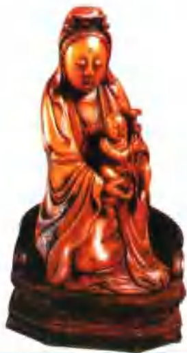
象牙雕送子观音像(明)