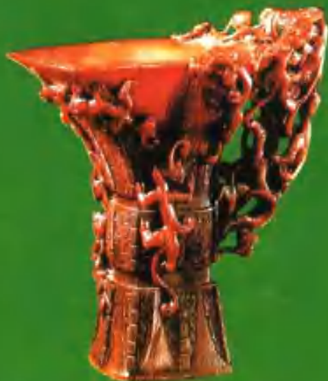
犀角雕螭纹杯 胡允中款(清)