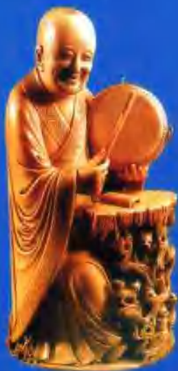
犀角雕群真海会觥(清)