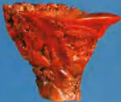
犀角雕山水人物杯 尤侃款(清)