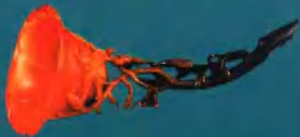
犀角雕玉兰花式杯(清)