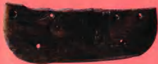
象牙刻“双鸟朝阳”河姆渡遗址出土(新石器时代)