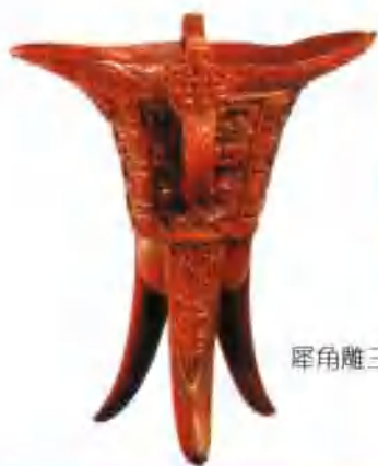
犀角雕三足爵杯(清)