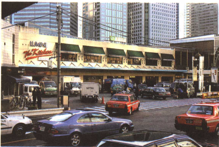
日本东京地铁入口

解说： 美国的研究报 告指出，人口 老龄化是日 本20世纪后 十年经济持 续低迷的重 要原因，这 个长寿之国 不得不出多 种办法来应 对。