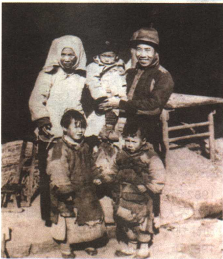
上：民国时期的中国妇女

解说： 60岁是进入老年的门槛，老年人口占到10%是老龄化国家的标志。随着医学的发展，一些发达国家的人口平均预期寿命可达78岁。老龄化也踩着人类文明的脚步跟进了。人类追求长