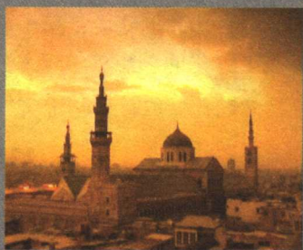
第二集 积极老龄化 / 19