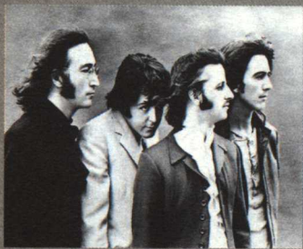
第三集 情系老龄化 / 37