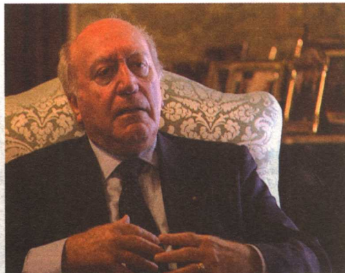
法国AG2R老年保险集团社会福利部部长 白伊 马耳他总统 格伊多·德马科