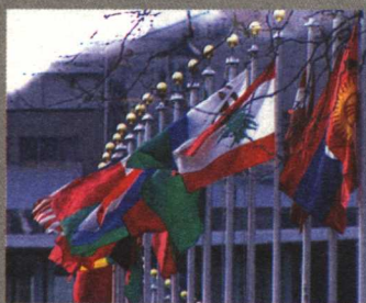
第一集 应对老龄化 / 3