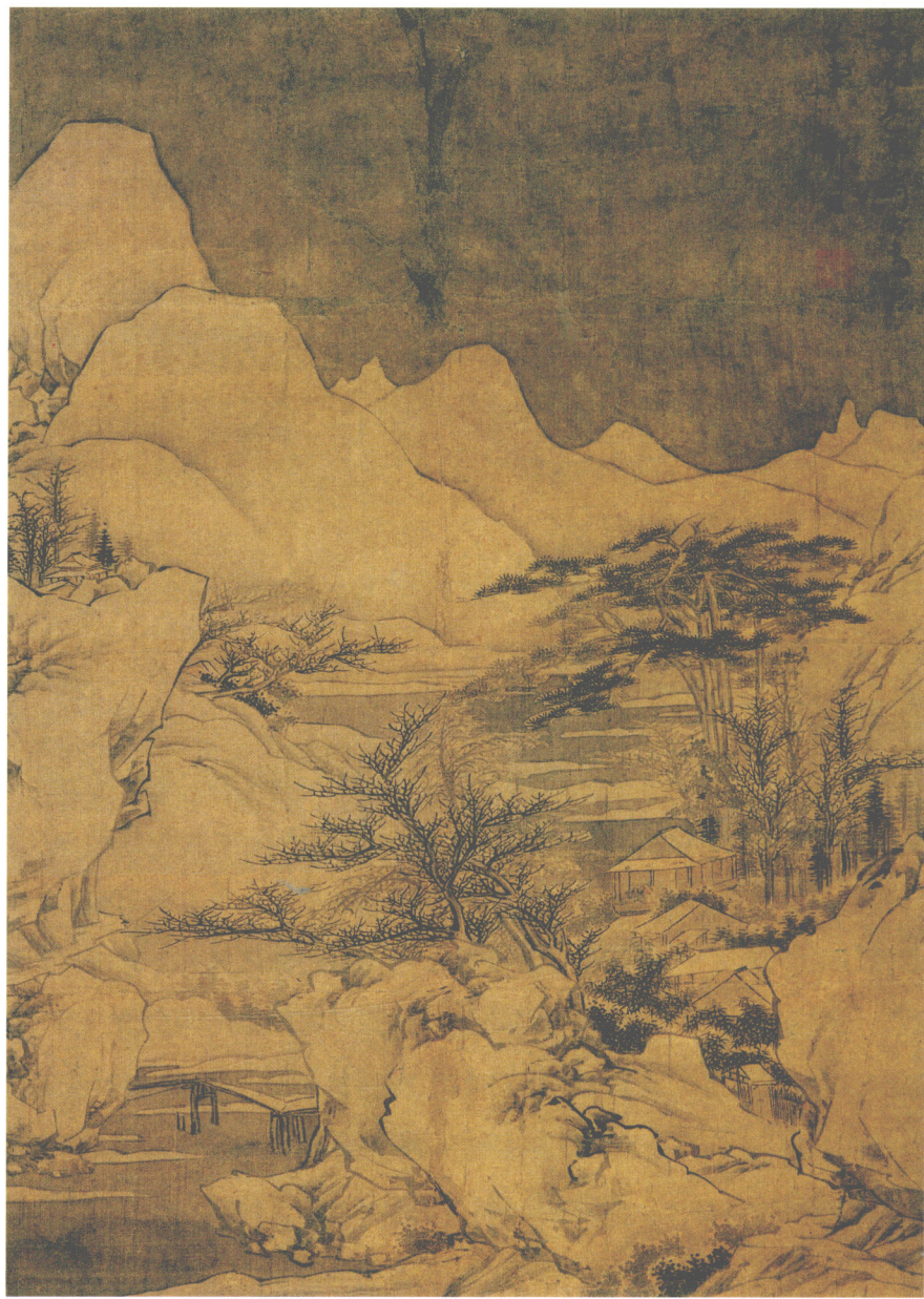
邹喆 雪景山水图轴