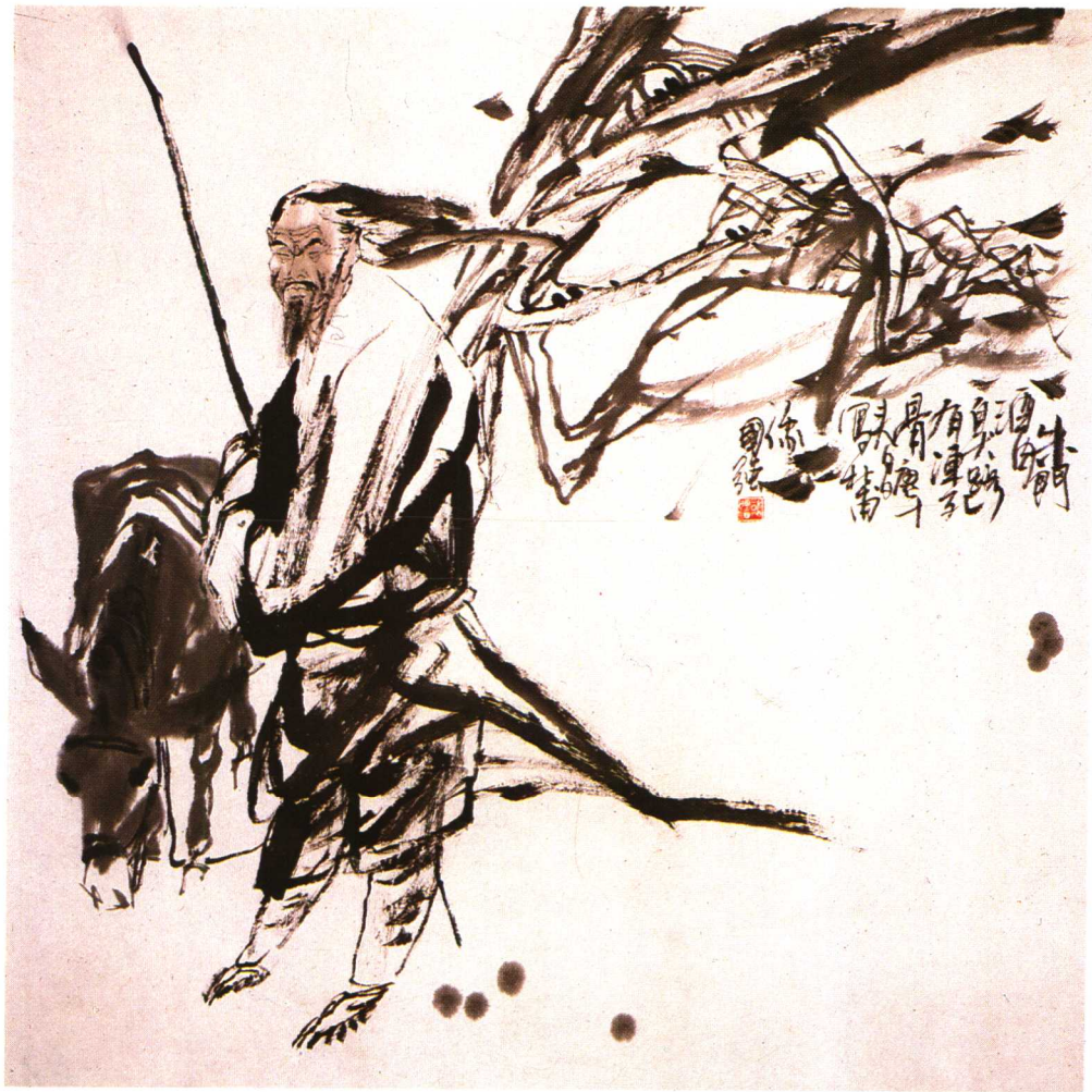
杜甫造像 ● 馬國強