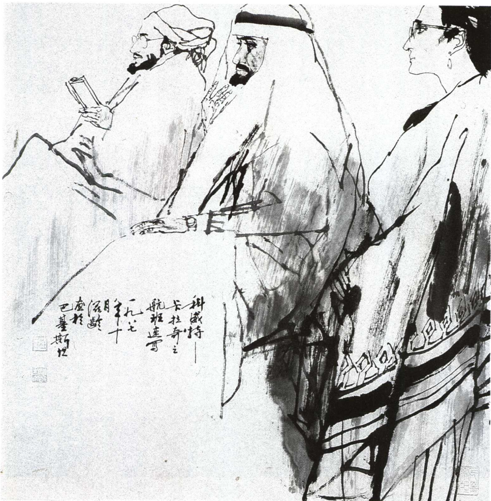
科威特卡拉奇航班速寫 ● 杜滋齡