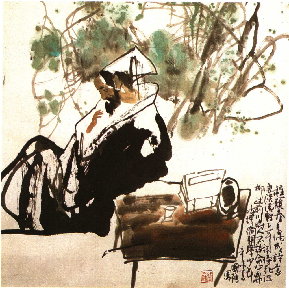
程顥 ● 馬國強