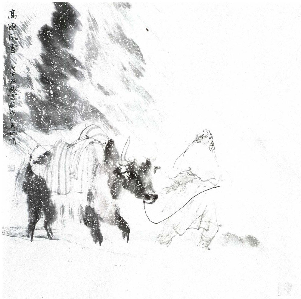
高原風雪 ● 杜滋齡