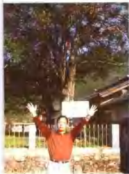
井冈山大井红豆杉、石楠

写了不少的如果，应该有个结果，结果是面对万千树木，树耶？人耶？神耶？却越来越糊涂了。倒是《世说新语》的一则故事，道出了结果：晋代桓温北伐前秦时，经过金城，看见他少年时栽种的柳树大已十抱，攀枝执条，潸然泪下，感叹：“树犹如此，人何以堪。”