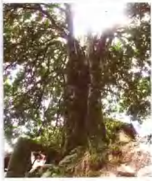
周宁祖龙村百年桂花

如果说有哪一位思想家，最能够从一株树中，把辩证法阐述得让你瞠目结舌，那只有庄子了。有一则故事：一个名叫匠石的木匠，要到齐国去，路过曲辕这个地方，见到一棵树植于村社之中，社树高大无比，若用来作舟，可能够十多艘的木料。匠石扫了一眼，继续赶路，他的弟子大惑，问：“师傅，自从我拿着斧头跟随您以来，从来没见过如此美材的树，而您却不正眼看它，为何？”匠石回答：“不要再提它了，不过是纹理散乱的无用之树。以其造船则沉于水下，以其为棺则很快腐烂，没有一点用处，所以才一直长在那儿，没人愿意砍伐它。”当天晚上，匠石做了一个梦，他梦见社树对他说：“匠石啊，