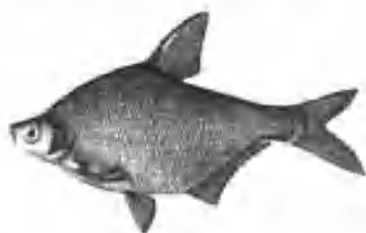
图 2 三角鲂

…………… 三角鲂 Megalobrama terminalis (Rich)(图 2)。