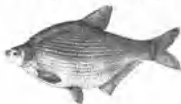
图 3 团头鲂

…… 团头鲂 Megalobrama amblycephala (Yih)(图 3)。