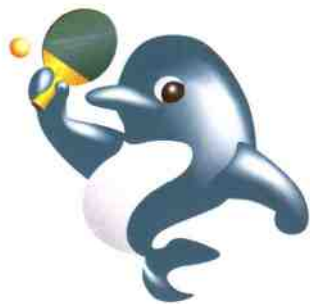
第48届世界乒乓球锦标赛 吉祥物

吉祥物选用受世人喜爱的海洋动物“海豚”，体现出海滨城市上海的特征。欢快腾空而起的“海豚”象征上海人民热情欢迎世界各国（地区）来宾。体态圆润可爱的“海豚”取名“迎迎”，象征中国人民欢迎各方来宾的情谊，其谐音又象征祝愿大家“赢”得友谊，“赢”得胜利。