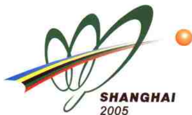
第48届世界乒乓球锦标赛 会徽

会徽由运动中的乒乓板重叠构成上海市市花“白玉兰”的外形，寓意本届比赛在中国上海市举行，象征友谊的彩带形成了乒乓球的轨迹，象征通过本届比赛将增进中国与世界各国（地区）人民和运动员之间的友谊。