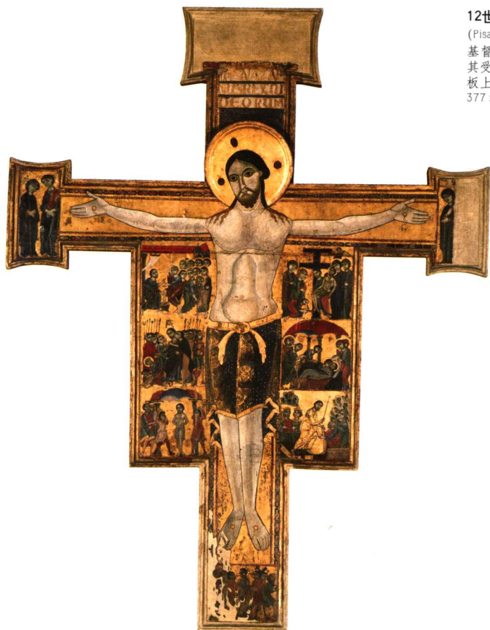
12世纪晚期比萨 (Pisan) 艺术家 基督钉在十字架上及 其受难故事画 板上绘画 蛋彩 377 × 231 厘米