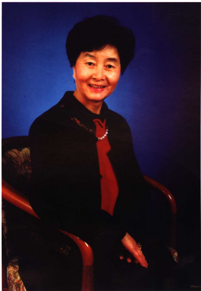
|| 主编 吴大真 ||