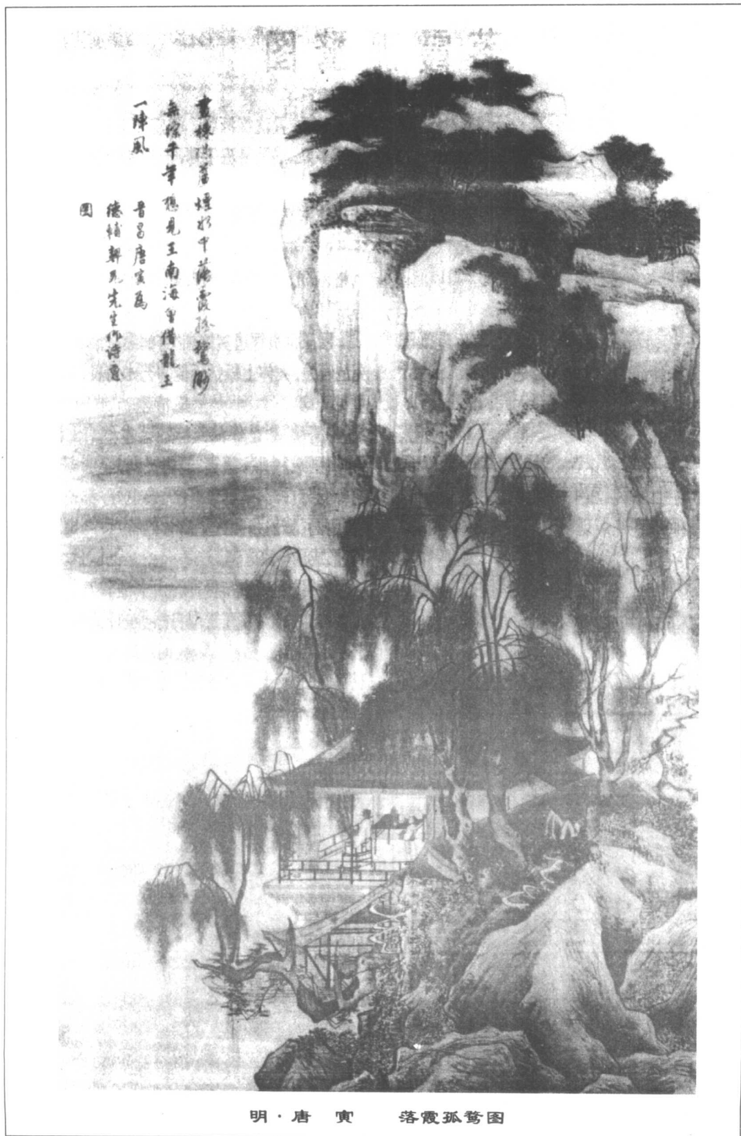
明·唐寅 落霞孤鷺圖