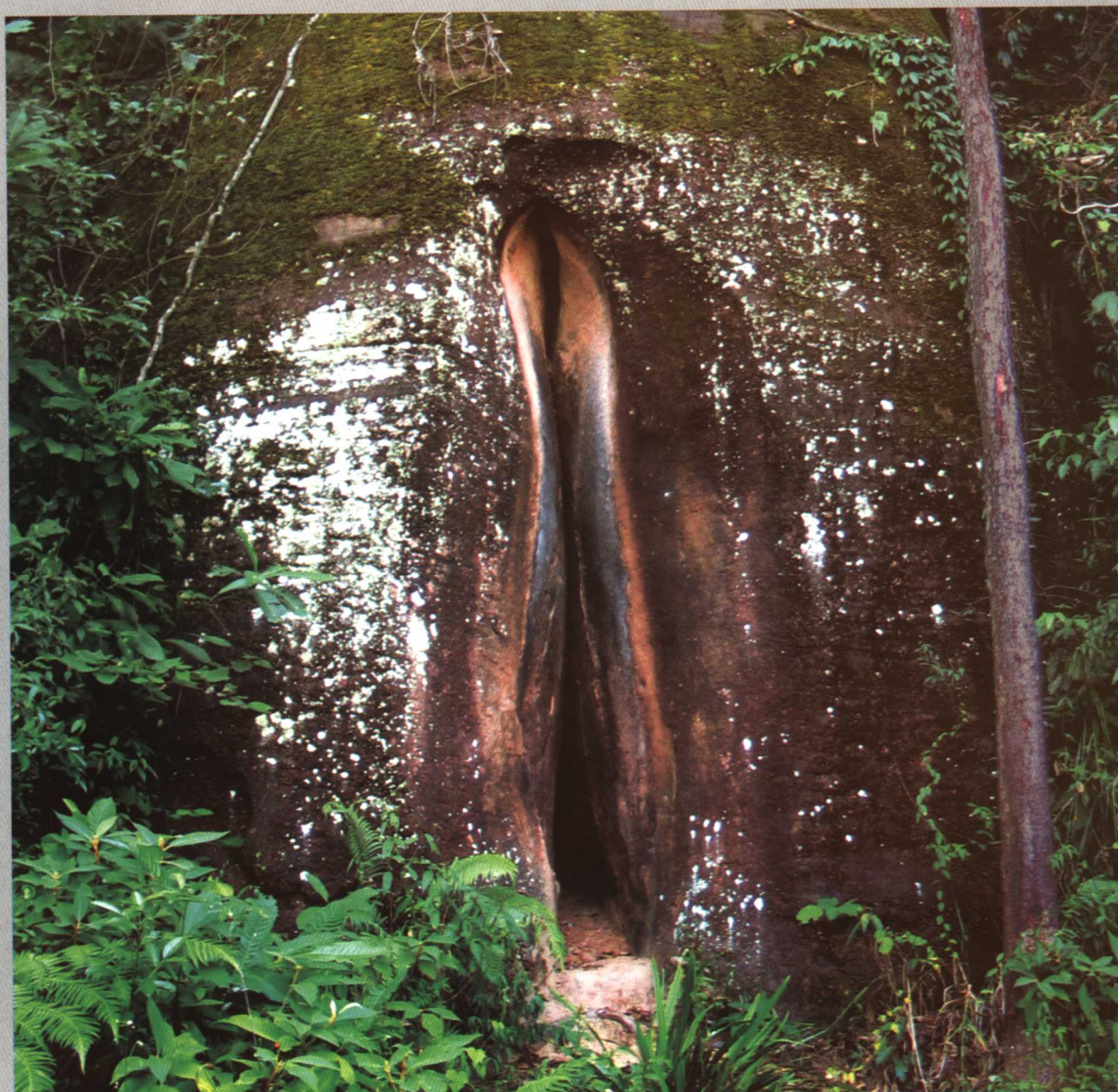
世界地质公园——广东韶关丹霞山少阴石