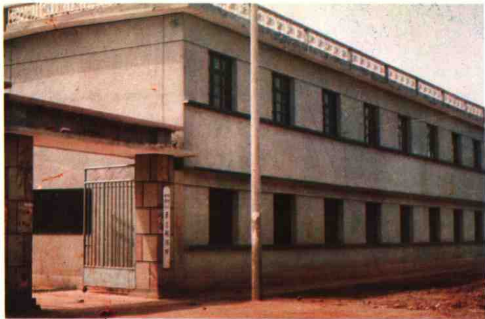
王店税务所办公楼