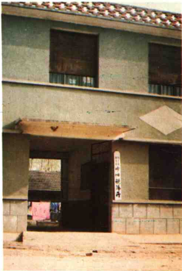
乍岫税务所办公楼