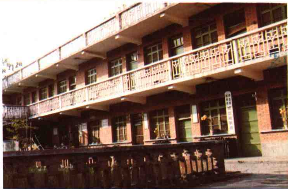
城郊税务所办公楼