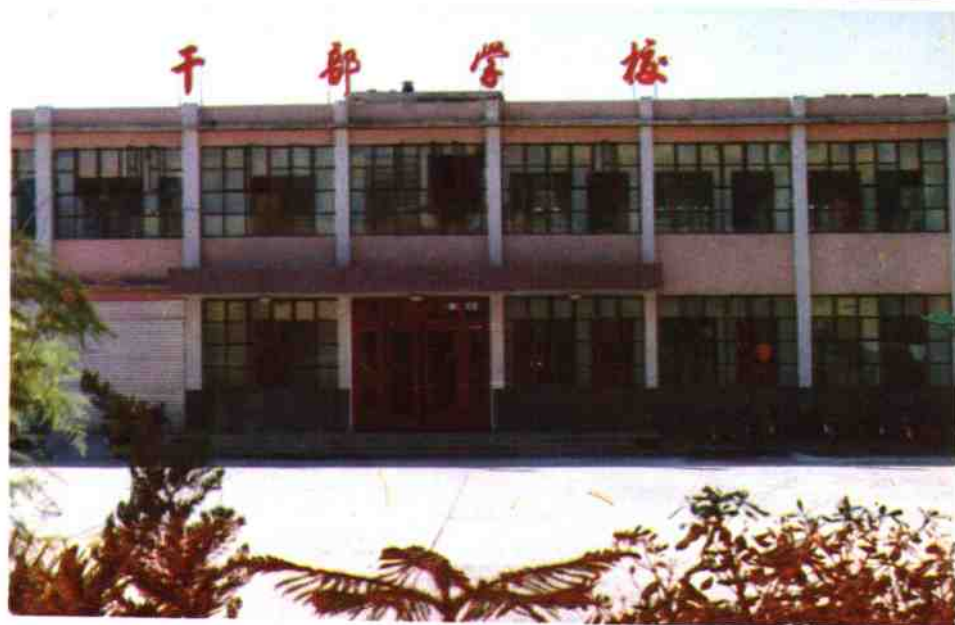
内乡县税务干部学校楼