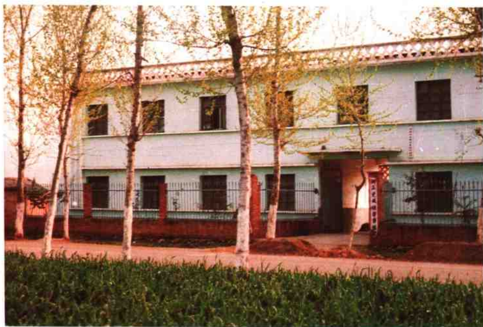
夏馆税务所办公楼