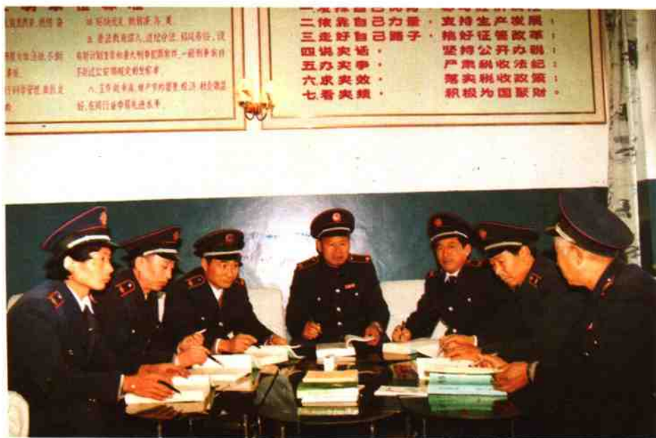
上图：编纂领导小组审定《税务志》报批稿合影