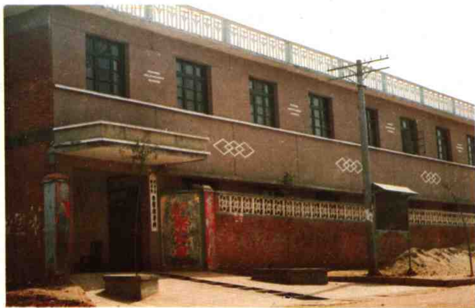
赵店税务所办公楼