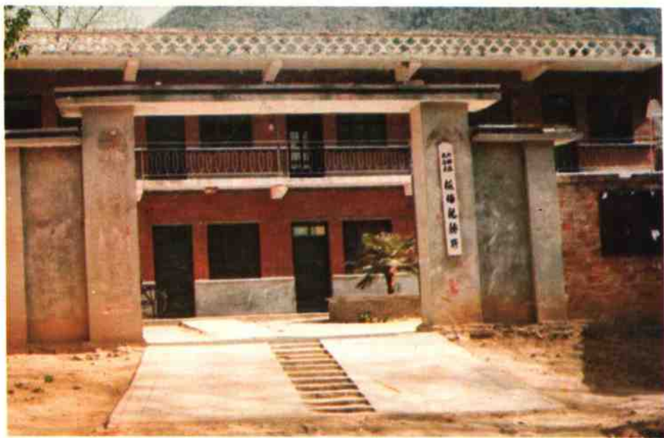
赤眉税务所办公楼