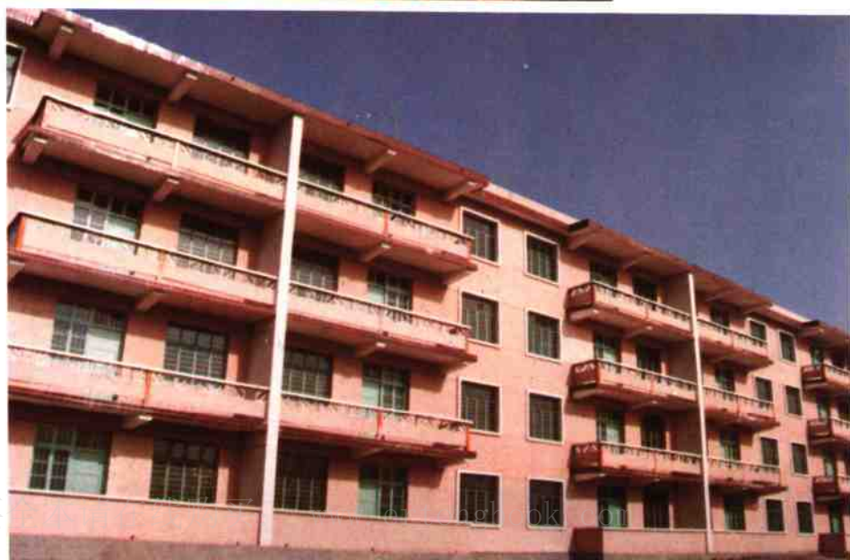
税务干部职工宿舍楼