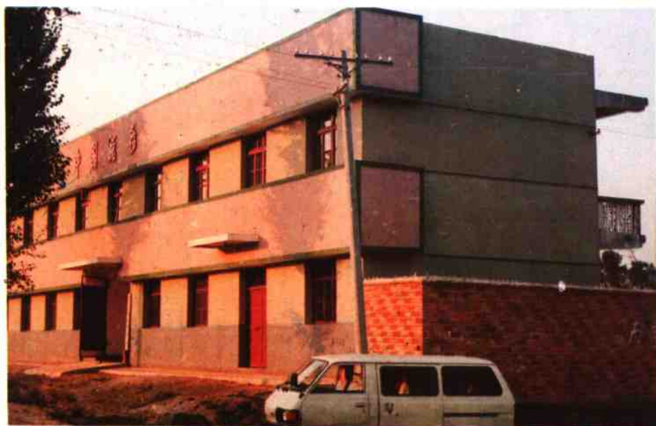
余关税务所办公楼