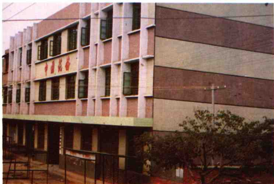
师岗税务所办公楼