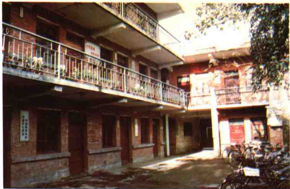
城关镇税务所办公楼