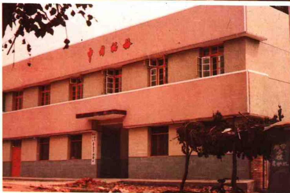
庙岗税务所办公楼