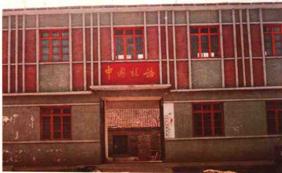
瓦亭税务所办公楼