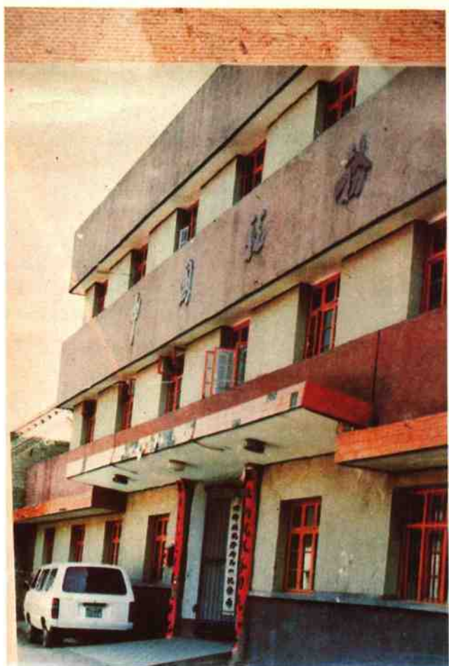
马山税务所办公楼