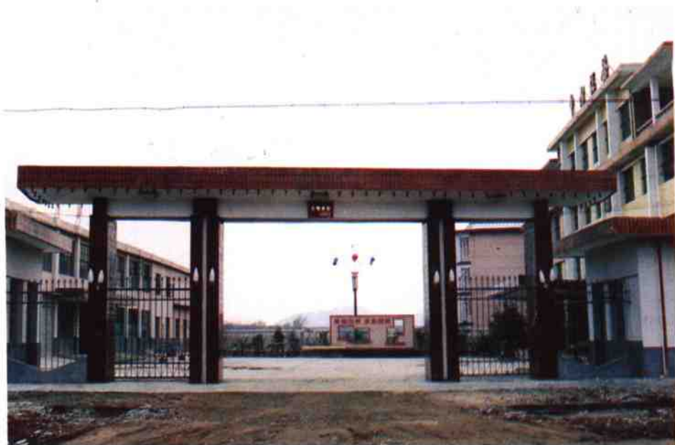
内乡县税务局大门