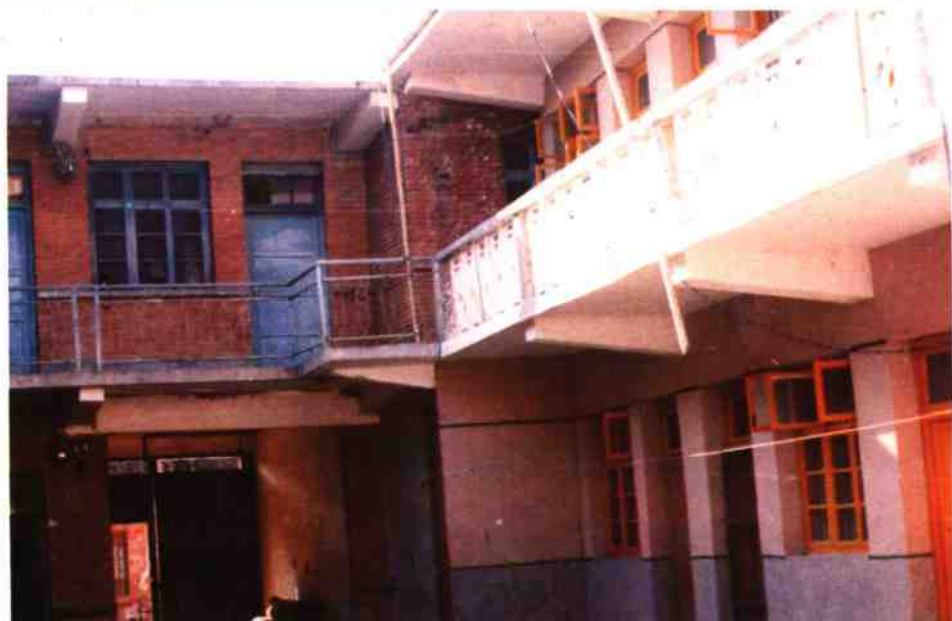
七里坪税务所办公楼