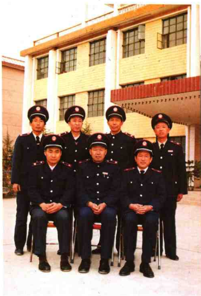
左图：内乡县《税务志》编纂领导小组成员：合影