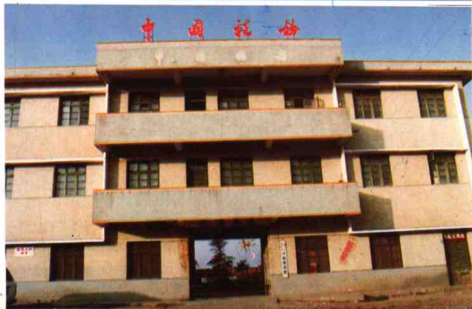
灌涨税务所办公楼