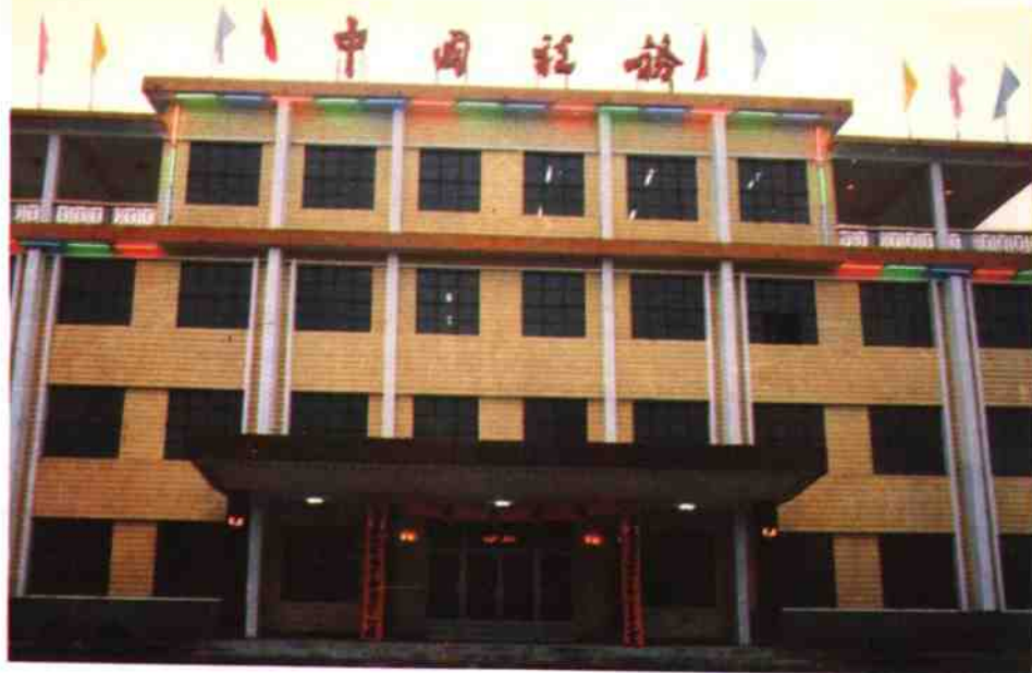
内乡县税务局办公楼