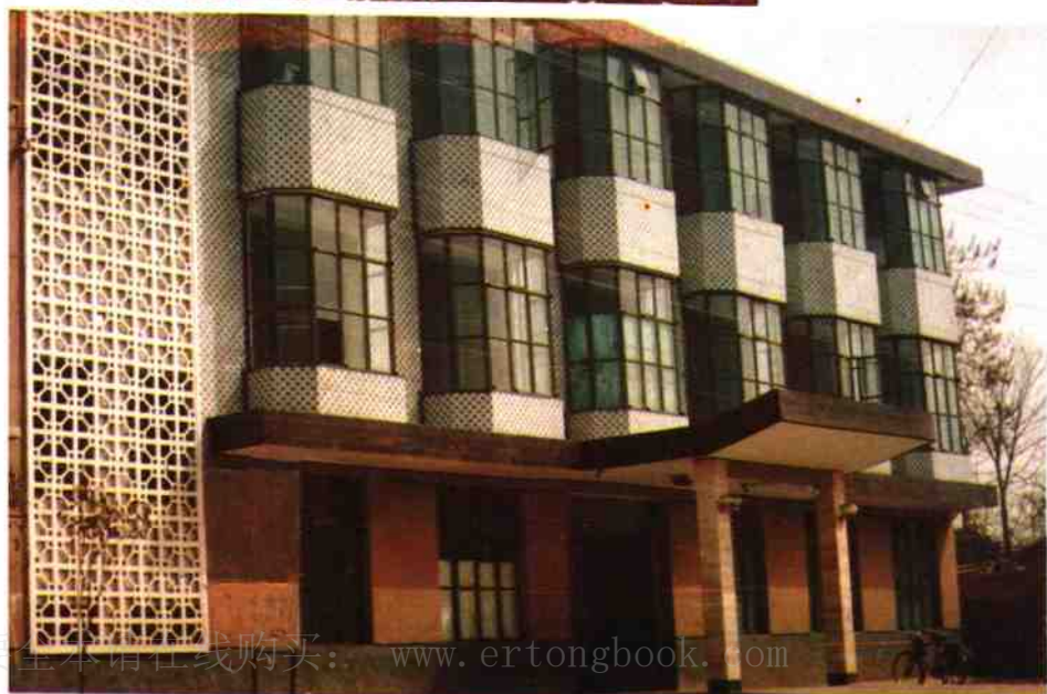
县直征收处办公楼