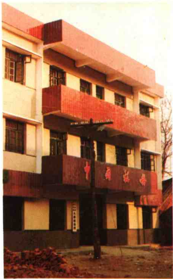
大桥税务所办公楼