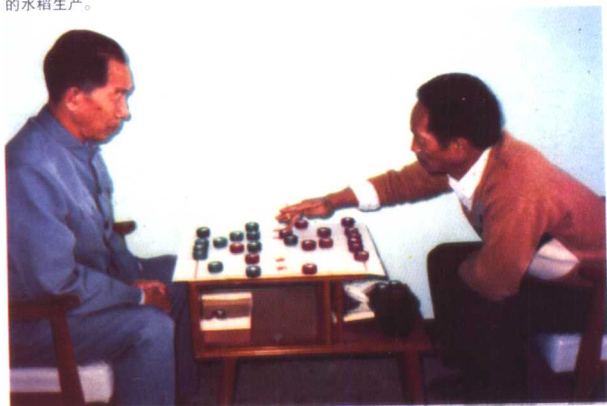
1988年12月在深圳召开专家顾问组年会期间,休息时与袁隆平对弈象棋。