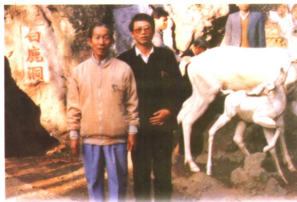
1990年11月28日,陈老带着秘书因公到郴州,又来到白鹿洞前,再次观赏了石壁上的“三绝碑”。