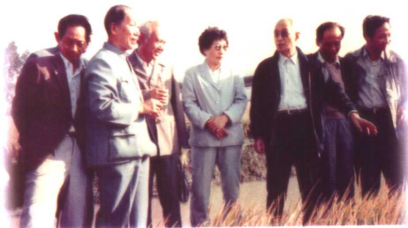
1986年陈洪新(右5)率专家顾问组在湖南衡东、衡山县考察杂交早稻。

全国杂交水稻专家顾问组部分成员在南方考察杂交水稻留影，陈洪新(左二)、袁隆平(左一)。