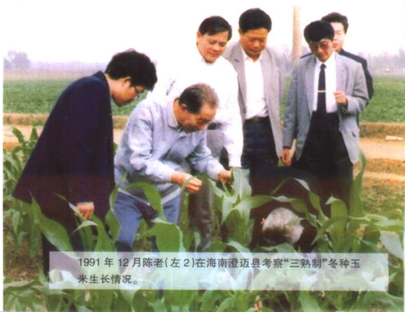
1991年12月陈老(左2)在海南澄迈县考察“三熟制”冬种玉米生长情况。