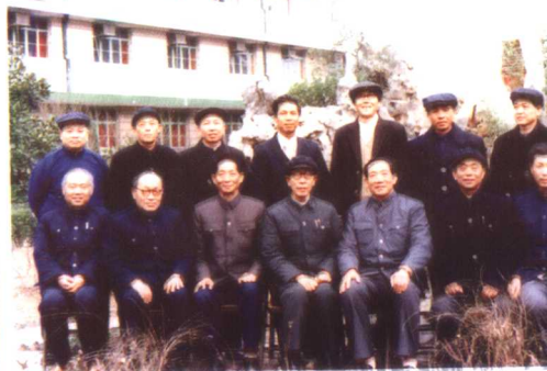
陈洪新(前排中)1985年12月27日在江苏常州市召开全国杂交水稻专家顾问组年会留影。

全国杂交水稻专家顾问组部分成员在南方考察杂交水稻留影，陈洪新(左二)、袁隆平(左一)。