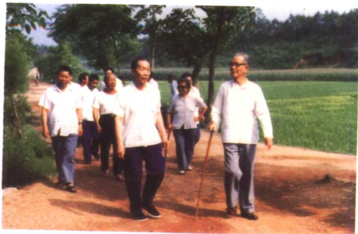
1987年7月1日,陈洪新(前排左1)陪原中顾委委员李雪峰(前排右1)及其夫人瞿英(2排右2)在长沙县武塘村考察杂交水稻。