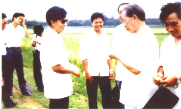
1991年陈老(右2)和海南省委常委、常务副省长鲍克明(右5)等一道深入海口市琼湘联办高产样板田验收杂交早稻产量。