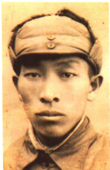
1946年1月在涑水县城留影,时任中共涑水县委书记兼县大队政治委员。