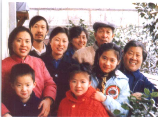
三代人合影,前排1、2、3是外孙、外孙女和孙女。