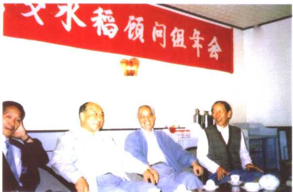
1992年12月在海南省三亚召开全国杂交水稻专家顾问组年会上与时任中共海南省委书记邓鸿勋(左2)等留影。