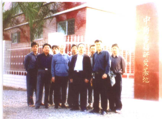
2004年陈老(前排左2)在中海香稻研发基地考察时与基地工作人员合影留念。