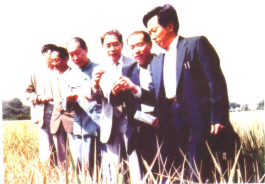
陈洪新(左三)与袁隆平(左二)等在福建考察杂交水稻。